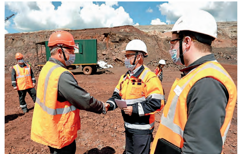
▲ За высокие результаты работы машинистам и помощникам буровой установки вручили благодарственные письма и премии

— Азам профессии обучает наставник, он знакомит молодого сотрудника с узлами, учит, как ухаживать за станком, — сообщил са-