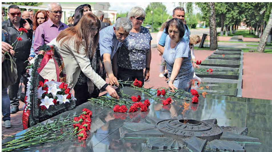
▲ Участники фестивалей — на мемориальном комплексе «Героям Северного феса Курской дуги»

Д ля их открытия были выбраны Поньри — «маленький город большой Победы»: именно здесь, на северном фесе Курской дуги, в июле 1943-го года советские войска оставили немецких захватчиков. Организаторы и участники музыкального форума почтили память павших воинов, посетив мемориальный комплекс «Поклонная высота 269» в Фатежском районе и музей Курской битвы — в Поньровском, возло-