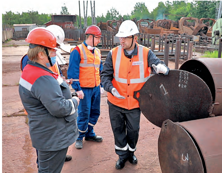
▲ Представители предприятий Металлоинвеста высоко оценили развитие Бизнес-Системы на производстве Михайловского ГОКа

Как должна выглядеть новая версия Бизнес-Системы? Новый этап её развития представители всех предприятий Металлоинвеста обсудили на стратегической сессии.