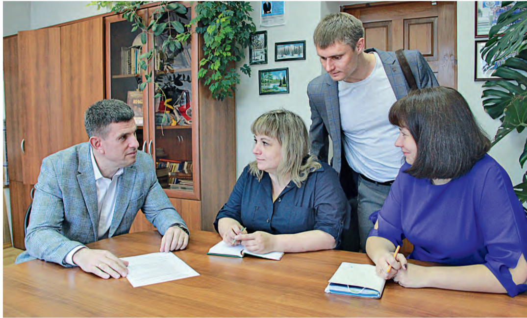
▲ Сплочённый и профессиональный коллектив подразделения справляется со своей работой «на отлично»!