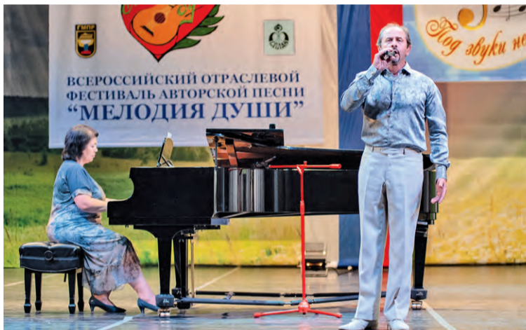
Конкурсанты на Гала-концерте исполнили свои лучшие номера.

— Самое главное — это то, что к нам приезжают представители различных профессий — от рабочих до инженеров, которые после смены находят время и силы для занятия творчеством. Особенно радует то, что такие начинания поддерживает компания «Ме-