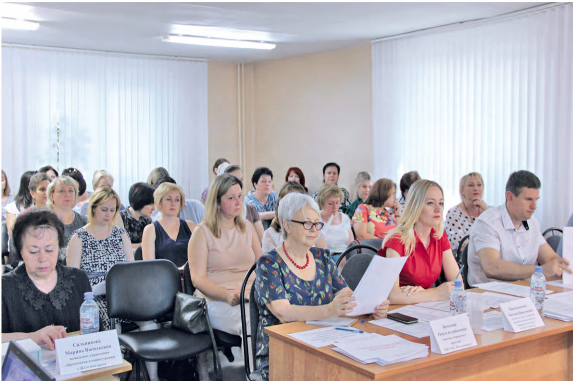
В этом году на рассмотрение жюри конкурса «Здоровый ребёнок» были поданы 23 заявки.