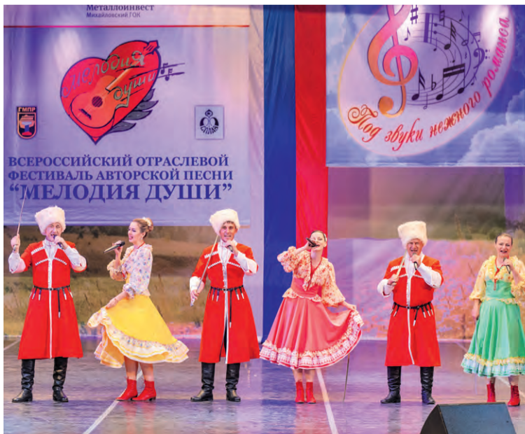
Яркие костюмы гармонично дополняли задорные песни.