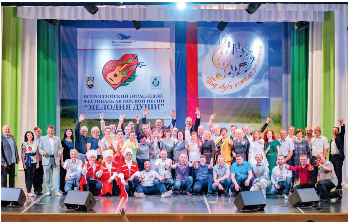
Участники фестивалей стали дружной творческой семьёй.