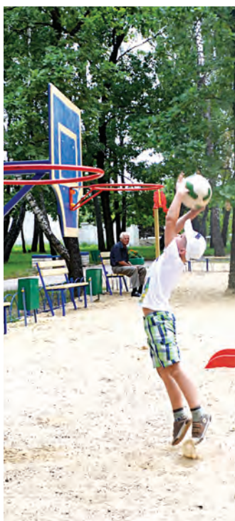
Каждый бросок будет удачным!

Атмосферу безудержного детского веселья еще больше оживили подарки от компании «Металло-