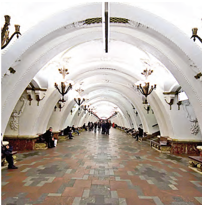
Станция метро «Арбатская»

■ Эрмитаж – один из самых крупных и старинных мировых музеев. В нём три миллиона произведений искусства от каменного века до современности. Если уделить каждому из этих произведений одну минуту, то потребуются больше 25 лет ходить в Эрмитаж, как на работу, и осматривать экспонаты по 8 часов в день, чтобы увидеть их все. ■ Россия занимает седьмую часть земной суши. ■ Российская Публичная библиотека – крупнейшая в Европе и