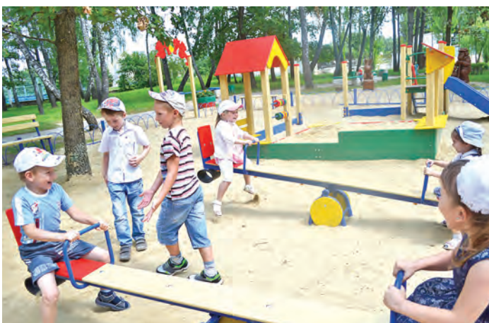
Как же весело на ярких новеньких качелях!