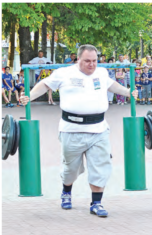
После 310-килограммового «коромысла» ведра с водой покажутся пушинками