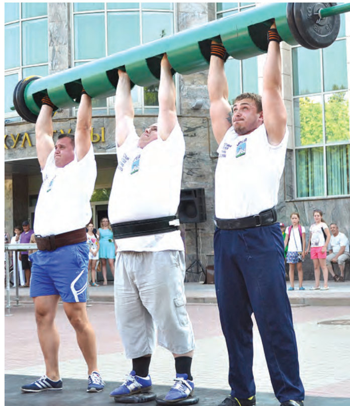
Трем богатырям большой вес по плечу