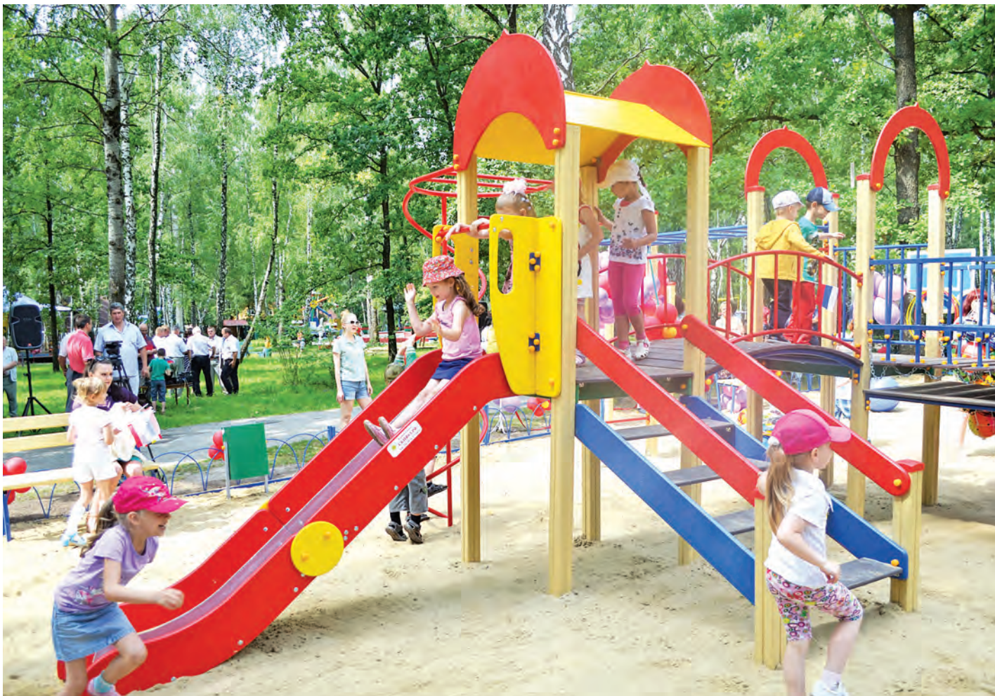
Детский городок - подарок малышам от депутатов областной и городской Думы

В ГОРОДСКОМ ПАРКЕ ИМЕНИ НИКИТИНА В ЧЕСТЬ 55-ЛЕТИЯ ДОБЫЧИ первой тонны руды Михайловского ГОКа открылся многофункциональный детский игровой комплекс. Новую площадку для игр и спорта ЖЕЛЕЗНОГОРСКИМ РЕБЯТИШКАМ ПОДАРИЛ МЕТАЛЛОИНВЕСТ ПО ИНИЦИАТИВЕ ДЕПУТАТСКОГО КОРПУСА МГОКА.