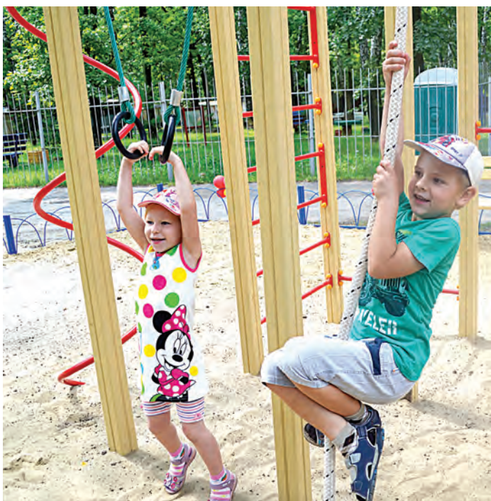
Гимнастические снаряды для будущих чемпионов