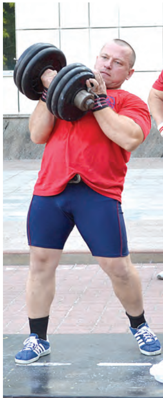
Четыре с лишним пуда одной правой!