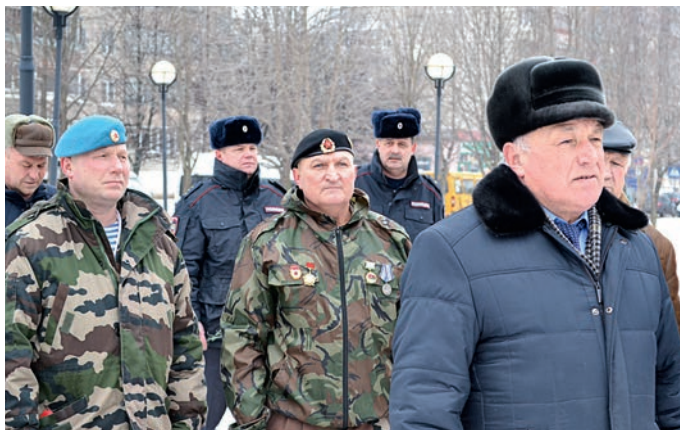
Участники акции поблагодарили железнгорских солдат за мужество и воинскую доблесть.