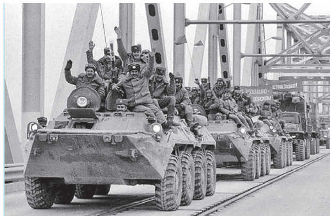
Советские солдаты возвращаются домой.