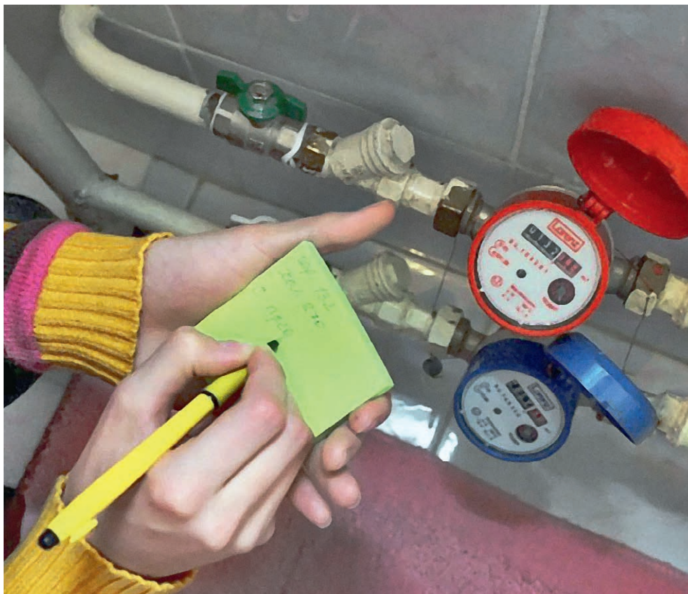
Большинство железнгорцев исправно оплачивают услуги водоснабжения. Несмотря на это, долги УК и ТСЖ перед ресурсоснабжающей организацией только растут.

У ряда железнгорских УК и ТСЖ в течение прошлого года существенно выросли долги за воду.