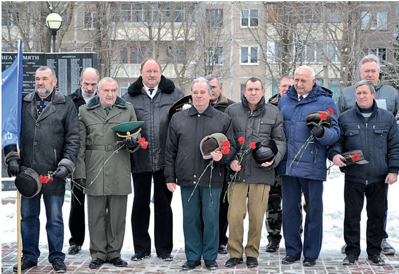
Почтить память павших собрались представители городской администрации, Михайловского ГОКа, общественных организаций.

Вот уже 29 лет прошло с тех пор, как советские войска были выведены из республики Афганистан. Но россияне бережно чтут память тех, кто погиб на этой войне, выполняя свой интернациональный долг.