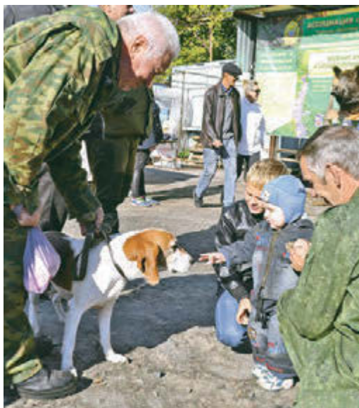
На ярмарке покупали все. Даже четвероногих друзей!

Выставки, конкурсы, соревнования и концерты вылились в настоящие народные гуляния, охватившие весь город.