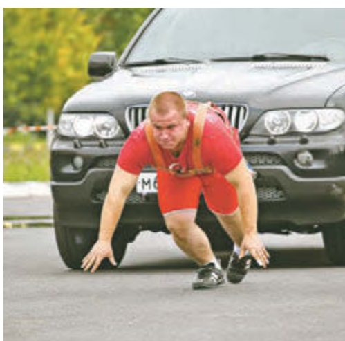
Силовые экстремалы демонстрировали невозможное