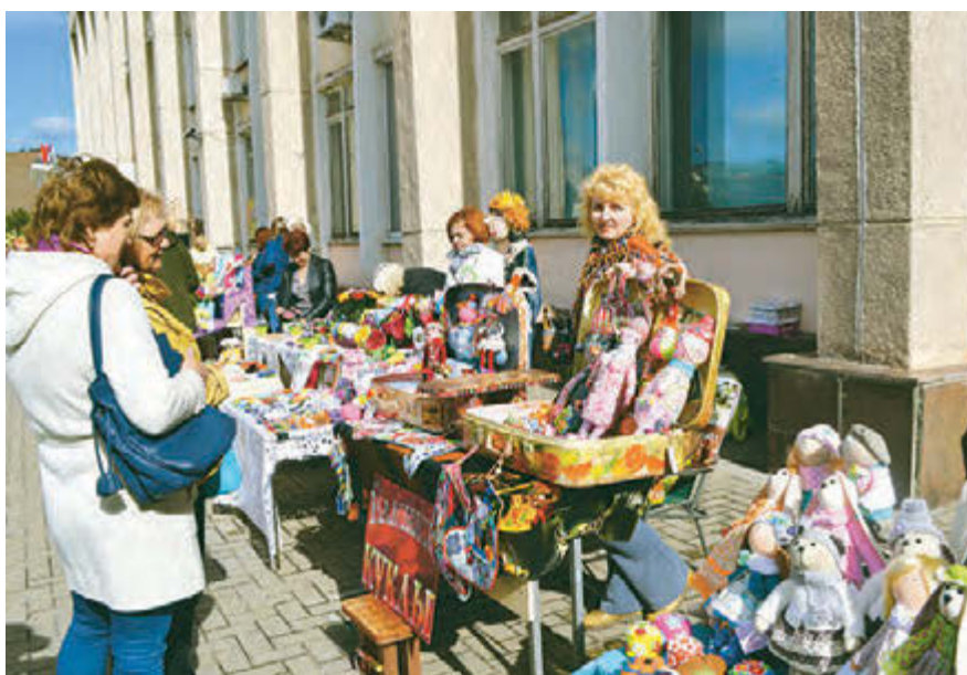
На площади администрации можно было и полюбоваться шедеврами народного творчества...

Ольга Богатикова