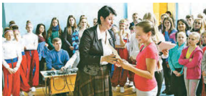
На школьной линейке поздравили победителей творческого конкурса

В железнодорожной школе № 11 подвели итоги конкурса на лучший эскиз оформления внутренних бортиков хоккейной площадки. Победители конкурса - ученики школы получили награды.