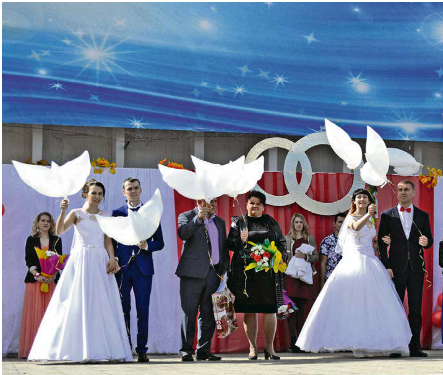
Молодоженам повезло: день рождения города совпал с днем рождения семьи

П раздничное настроение задала осенняя ярмарка. Овощи, фрукты, мясо, рыба, мед, специи, живые поросята и кролики, птица, а еще посуда, корзины, украшения... От обилия товара разбежались глаза. Неизменной изюминкой ярмарки становится выставка охотничьих собак и трофеев. Пока одни покупали, другие смотрели концерт. А позже возле городской администрации появились прилавки с настоящими произведениями искусства, изготовленными железнгорскими мастерами и мастерицами. Цветы из ленточек, бисерный бонсай, вышитые картины и иконы, букеты из соломы, поделки из кофейных зерен, куклы, кружевные салфетки, деревянные обереги, вязаная одежда и обувь и многое другое - к каждому прилавку на выставке-продаже покупатели подходили как к музейной витрине. Настоящей жемчужиной праздника стало торжественное поздравление молодоженов, которые зарегистрировали свой брак в День города. В этот раз через живой коридор, который составили железнгорцы на площади КЦ «Русь», и импровизированные ворота счастья прошли три молодые супружеские пары. Им торжественно