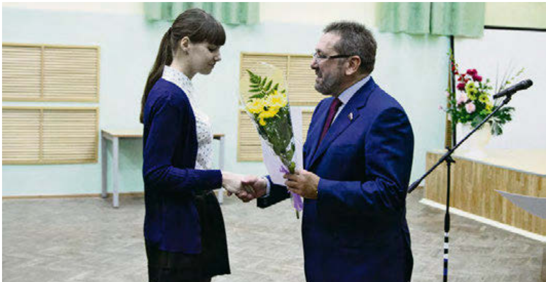
Стипендии от Михайловского ГОКа - мощный стимул двигаться вперед