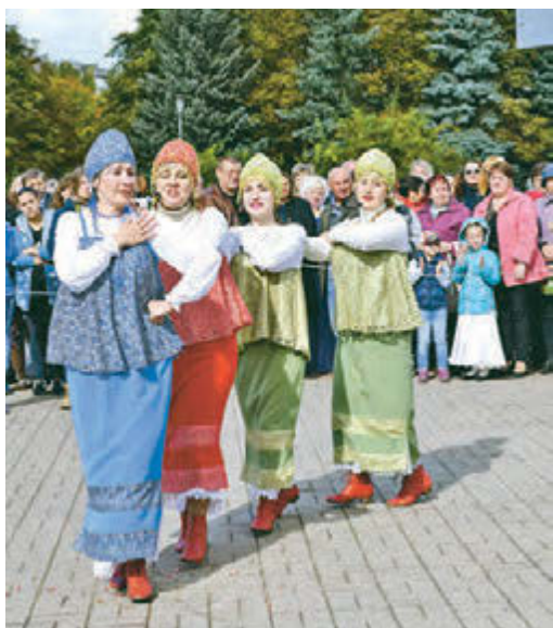
Праздник - это, прежде всего, песни и пляски!