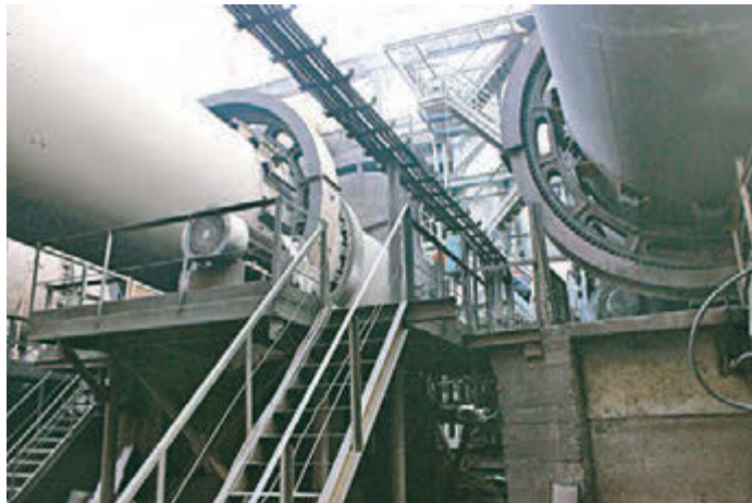
Оборудование дробильно-сортировочной фабрики отремонтировано и готово к работе