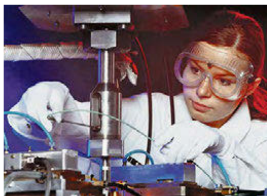
Идеи молодых ученых часто используются в практике

«Люблю тебя, мой Соловьиный край!» - так называется новый конкурсный проект. Фестиваль исследовательских и творческих проектов проводит в регионе Курское областное отделение Русского географического общества. Целью акции является популяризация географического, исторического и культурного наследия Курской области, осознание места и роли региона в развитии России. К участию в конкурсе приглашаются все, кто любит нашу курскую землю.