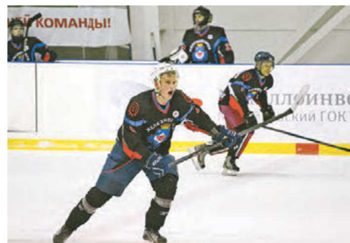
А железнгорские хоккеисты были неуправляемы!