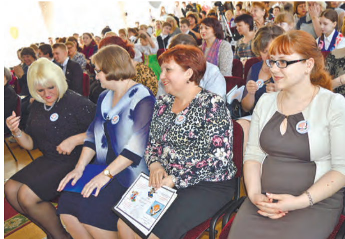
Конкурсантки в хорошем настроении. Они готовы поделиться своим опытом и побороться за победу