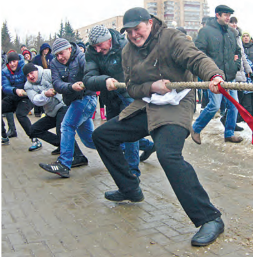
Железногорцы состязались в перетягивании каната