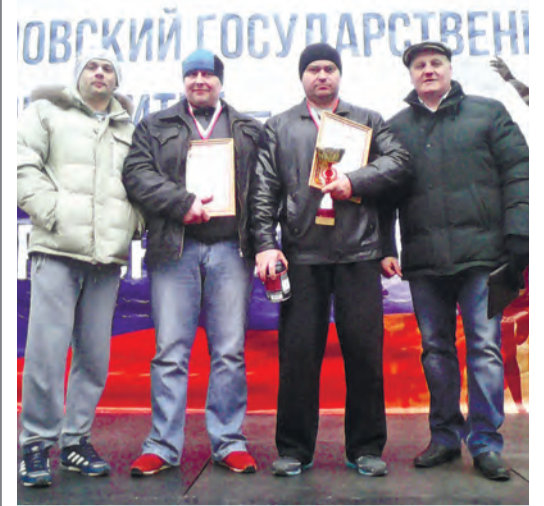
Силачи МГОКа не подвели!