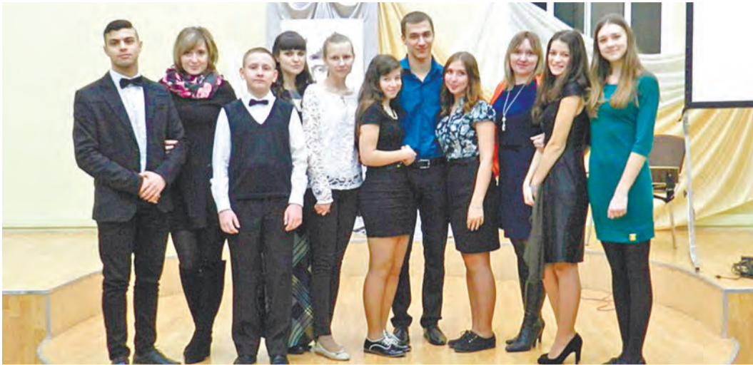
Активисты ШПД - участники вечера, посвященного Сергею Есенину

Год литературы в Музее истории и трудовой славы Михайловского ГОКа открылся мероприятием Школы полезного действия, посвященным творчеству Сергея Есенина.