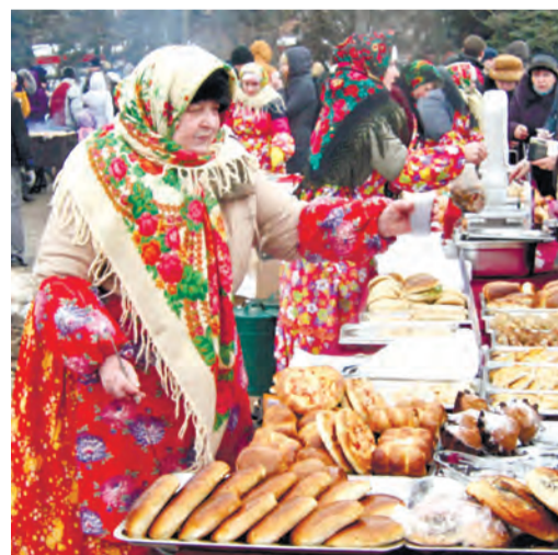
Продавцы выпечки тоже выглядели очень ярко и нарядно

До начала театрализованного представления железнорцы могли ознакомиться с выставками декоративно-прикладного искусства школы народных промыслов «Артель», культурного центра «Горница», Центра детского творчества. А более смелые состязались в перетягивании каната и стрельбе из пневматического ружья. Кто-то пришел со своей гармошкой и