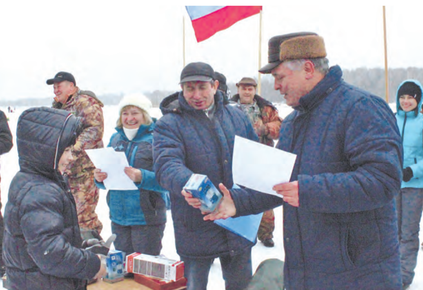
На МГОКе уже появились рыбацкие династии