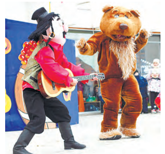
На площади развернулось театрализованное представление

зрительские конкурсы. Апофеозом праздника стало традиционное сожжение чучела Масленицы. Однако и после огневого финала публика не спешила расходиться по домам - полученный заряд хорошего настроения давал силы продолжить праздник. - Мы с мужем и сыном очень любим Масленицу, - говорит горожанка