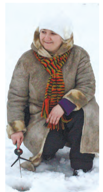
У рыбалки есть и женское лицо...

ла, ведь у парня уже есть опыт рыбалки на Волге - вместе с отцом он не раз возвращался с уловом. Вероятно, что и гоковские соревнования ему придутся по душе. - Здесь собираются люди с активной жизненной позицией,