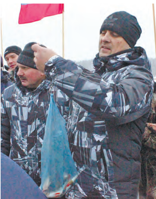
Зимний улов «вешают» в граммах. Рыбацкая добыча ЦЛЭМ - больше кило!

к концу. Как ни странно, рыба словно осознала это и стала ловиться куда активнее. И вот момент истины. Под общий смех и добрые шуточки пакеты с рыбой падают уже на крючок весов