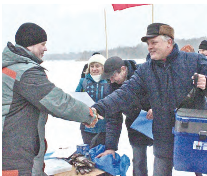
Представитель команды-победительницы ЦЛЭМ получает заслуженный приз