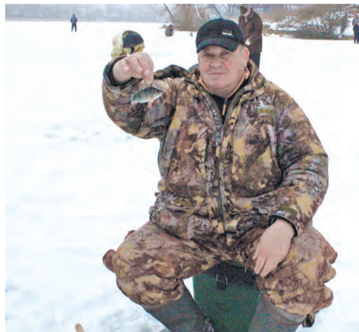
Первая рыбка - на крючке!