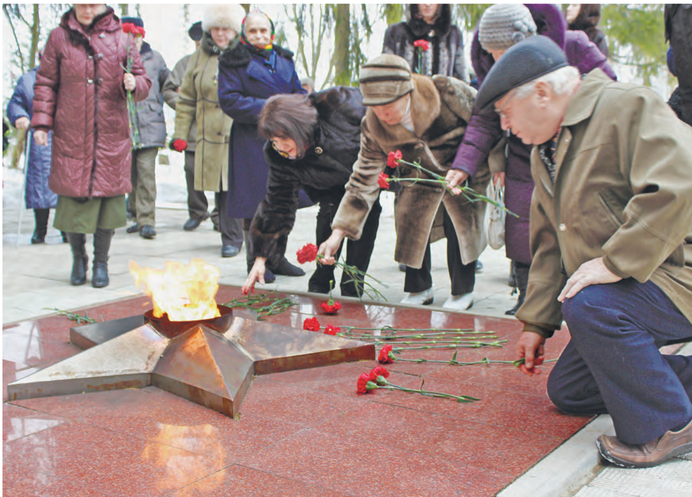
Участники митинга на мемориале «Большой Дуб» почтили память павших

72 ГОДА ПРОШЛО С ТЕХ ПОР, КАК СОВЕТСКИЕ СОЛДАТЫ ОСВОБОДИЛИ МИХАЙЛОВСКИЙ РАЙОН ОТ ФАШИСТОВ. ЭТОЙ ПАМЯТНОЙ ДАТЕ И ПРАЗДНОВАНИЮ ДНЯ ЗАЩИТНИКА ОТЕЧЕСТВА БЫЛ ПОСВЯЩЕН МИТИНГ, КОТОРЫЙ СОСТОЯЛСЯ В МУЗЕЕ ПАРТИЗАНСКОЙ СЛАВЫ «БОЛЬШОЙ ДУБ».