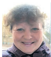
Татьяна Вячеславовна, жительница города:

— Праздник считаю нужным — это историческое событие для всего мира. Наша благодарность всем, кто причастен к первому полёту, освоению и изучению пространства. Однако, стоит ли сейчас усиленно развивать, сомневаюсь. В советское время, когда важным было показать ядерную и космическую мощь крупнейшего СССР, это активно изучалось и разрабатывалось. Сейчас же, в 21 веке, наше внимание направлено больше на внешнюю политику. Сейчас много военных конфликтов, где мы помогаем людям, попавшим в беду. Думаю, нам важно пока на этом акцентировать внимание. Но, тем не менее, мы всё равно поддерживаем уже существующую базу — развиваем космические программы, запускаем спутники и ракеты, построили космодром. Это тоже немаловажный вклад.