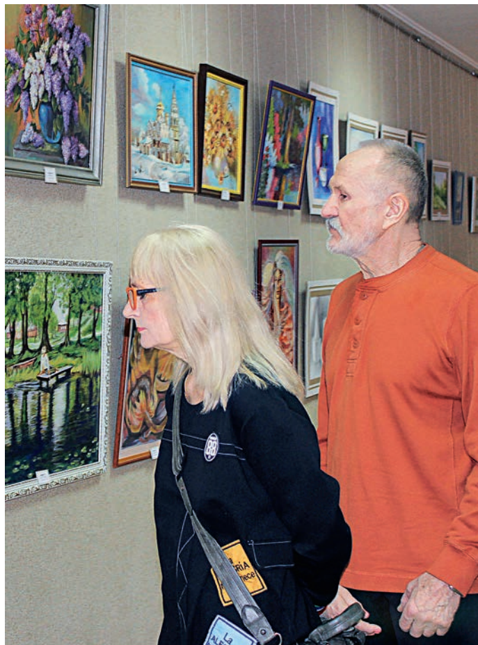
Порядка 50 картин размещены в коридоре ДК МГОКа.