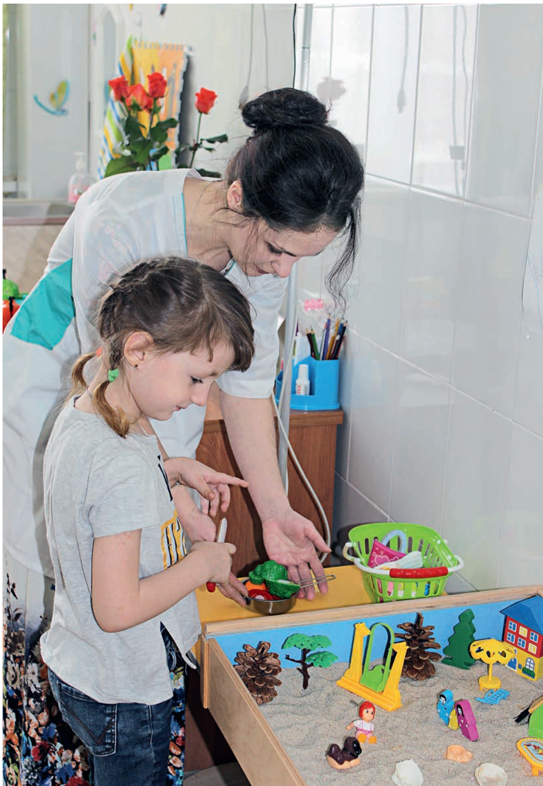
Благодаря программе «Здоровый ребёнок» у нас работает уникальный для региона проект — БОС-терапия.

В Железногорске стартовал новый сезон программы компании «Металлоинвест» «Здоровый ребёнок». В 2018 году одним из её направлений станет интеллектуальное здоровье малышей.