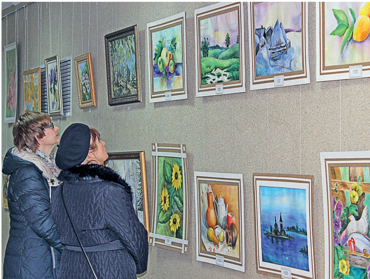
Весь апрель в ДК МГОКа будет проходить выставка самодеятельных художников.

Во Дворце культуры Михайловского ГОКа Железногорска открылась групповая выставка самодеятельных художников. Это первый вернисаж художников-любителей в городе за последние тридцать лет.