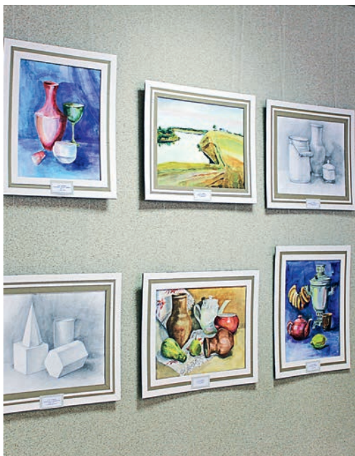
Авторские работы художников-любителей.