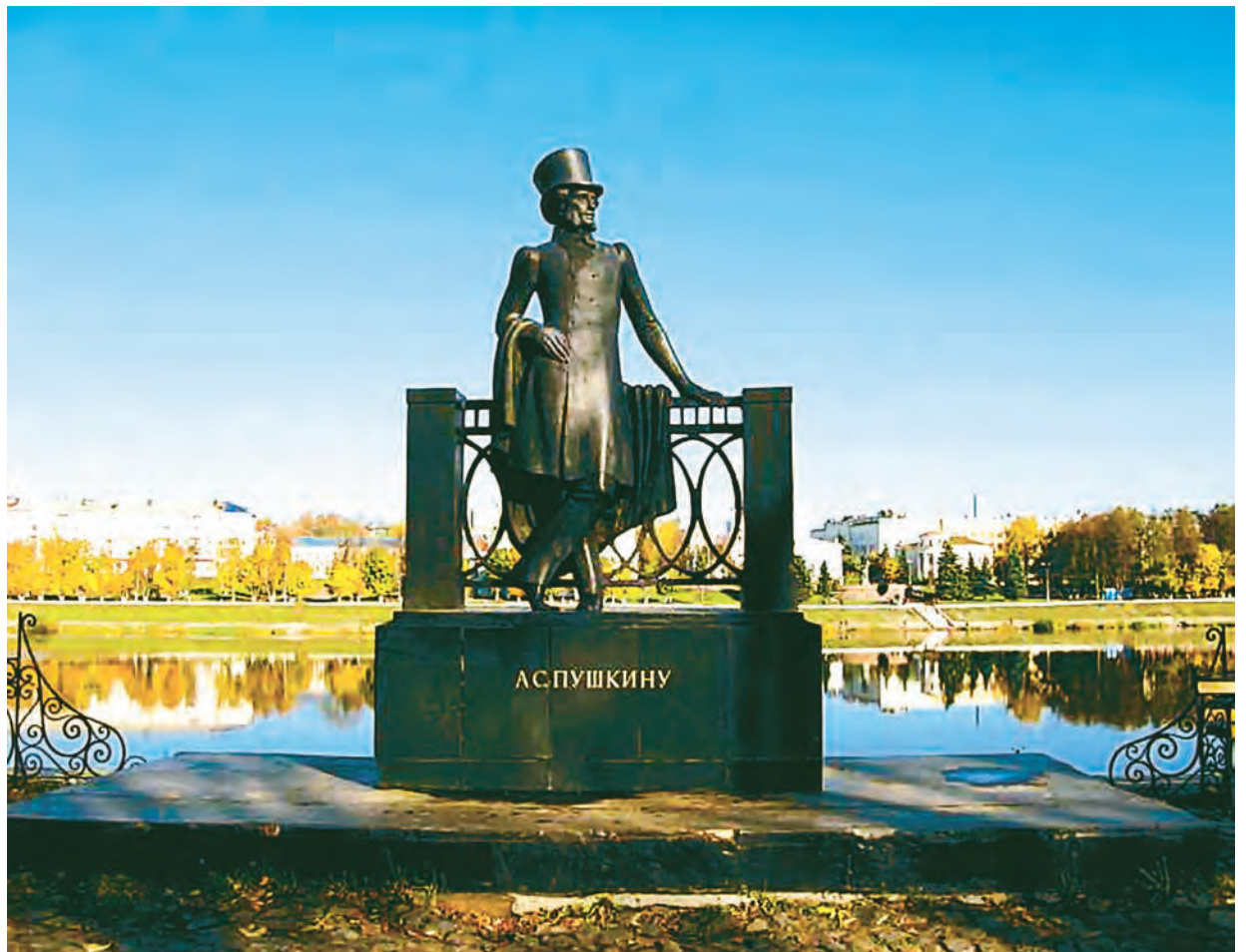
Александр Сергеевич Пушкин в самом живописном уголке Твери – главном городском парке. Поэт, как и всегда, задумчив и прекрасен