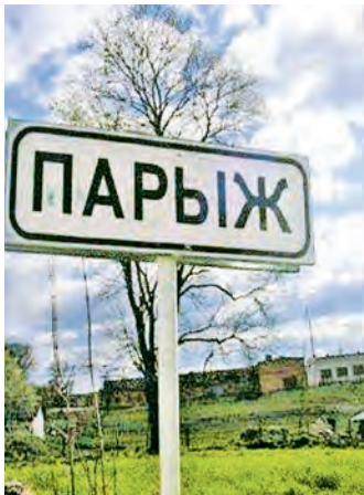
Свози свою девушку во Францию!