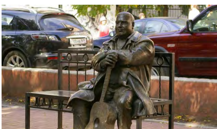
Памятник королю российского шансона Михаилу Кругу – бывшему жителю Твери