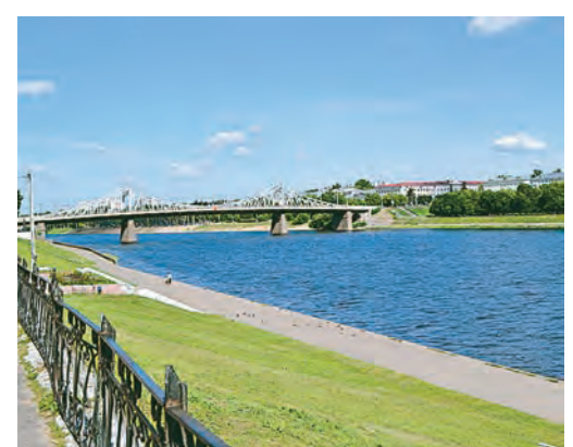
Широка и величественна Волга-матушка. И мостов над ней в Твери видимо-невидимо!