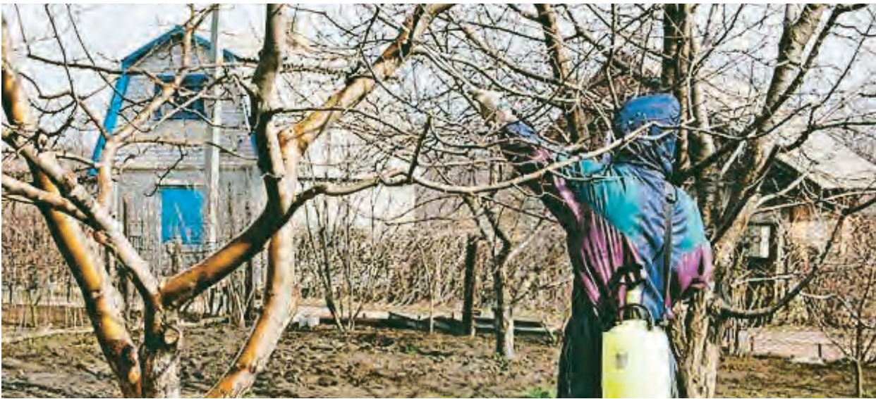
Опрыскивание сада осенью – важный прием в технологии защиты деревьев от болезней

сутствия в цветках нектара. Еще в сентябре при продольном разрезе плодовых почек, пораженных бактериозом, хорошо заметен некроз тканей, иногда обширный. Такие почки в первую очередь страдают от морозов. По данным американских исследователей, инфицированность растений бактериями усиливает поврежденность их отрицательной низкой температурой. Внедрившись в межклетники, при отрицательной температуре уже в пределах от -2 до -10°C, бактерии становятся центрами кристаллизации или активаторами кристаллизации воды. Наблюдается эффект «сосудки», то есть, увеличение кристаллов льда за счет извлечения воды из цитоплазмы. Образовавшиеся кристаллы своими острыми краями вызывают гибель клеток, тканей и даже всего растения. В результате наблюдается резкое снижение морозостойкости, что и приводит к массовой гибели плодовых почек, нередко и надземной части растений. При продолжительной теплой и влажной погоде осенью сильно