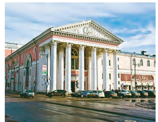
Тверской драматический театр – одно из красивейших зданий города, а рядом – филармония