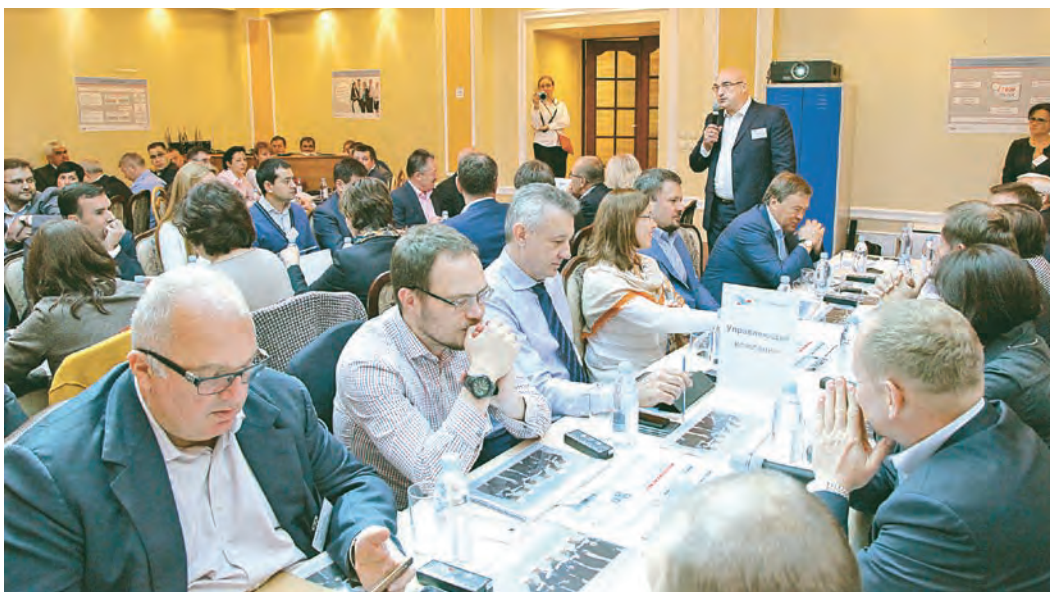
В стратегической сессии приняли участие представители всех предприятий Компании

Как добиться на предприятии карьерного роста? Что нужно для того, чтобы зарабатывать больше и получать поощрение за выдвижение новых идей? Справедливо оценивает меня руководство? Эти и другие вопросы, как показал опрос, волнуют многих работников компании. Первое социологическое исследование Металлоинвест инициировал в 2013 году. В нём приняли участие управляющая компания, ОЭМК, Лебединский и Михайловский горно-обогатительные комбинаты. В этот раз к ним присоединились Уральская Сталь и УралМетКом. С помощью анкетирования, которое проводилось при поддержке крупнейшей международной консалтинговой компании «Hay Group», получены объективные данные о состоянии рабочей атмосферы, уровне доверия сотрудников к руководителям, о том, какие проблемы, связанные с трудовой деятельностью, являются для персонала наиболее острыми, какую роль работники отводят себе в общей деятельности предприятия, как характеризуют взаимоотношения