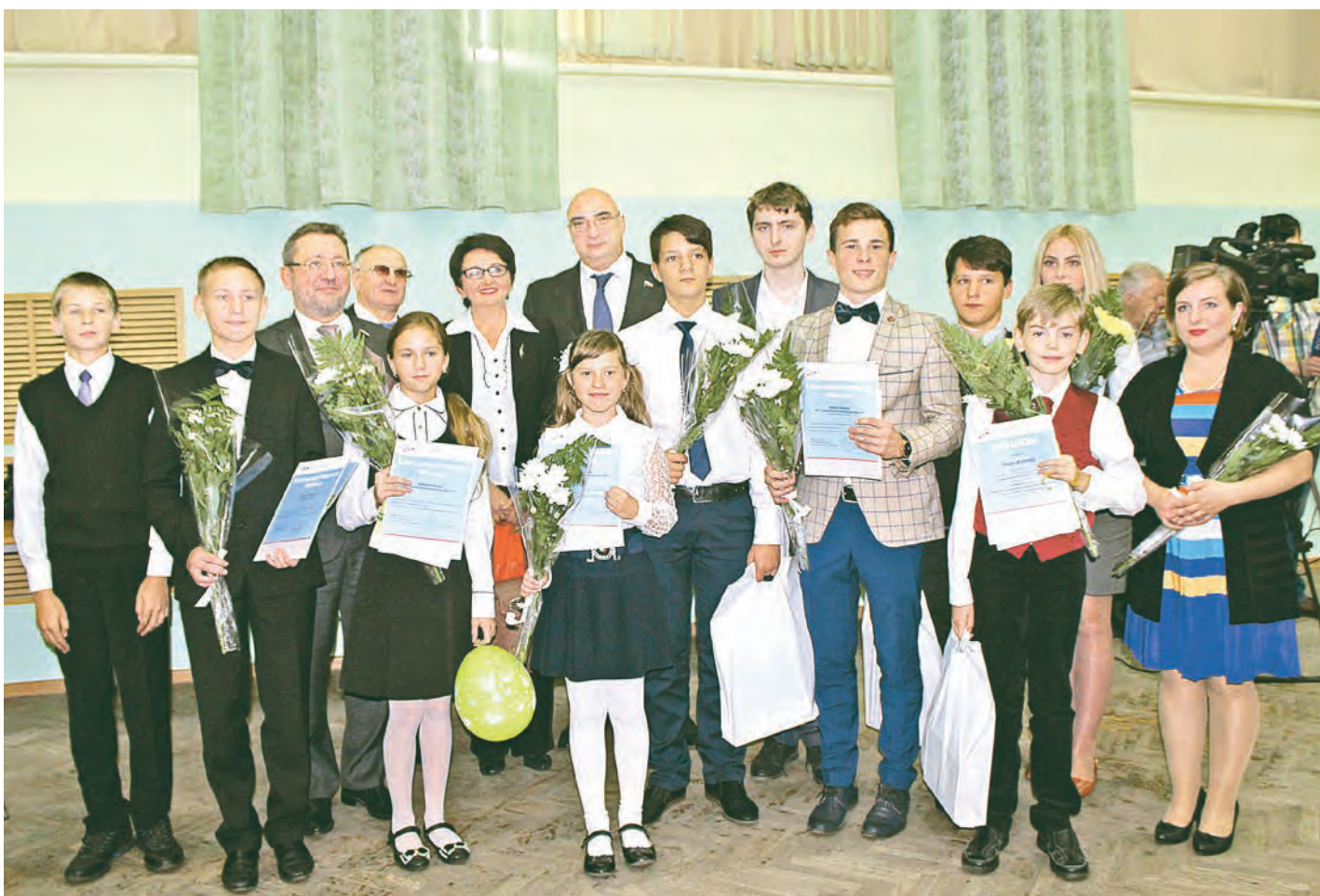
Прилежность и стремление двигаться вперед всегда поддерживает Металлоинвест

На Михайловском ГОКе состоялось торжественное вручение премий молодым учителям и талантливым учащимся.