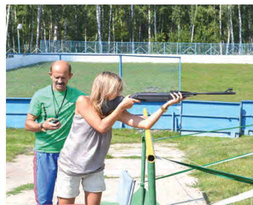
Кто сказал, что женщины не умеют стрелять? Умеют, и еще как!