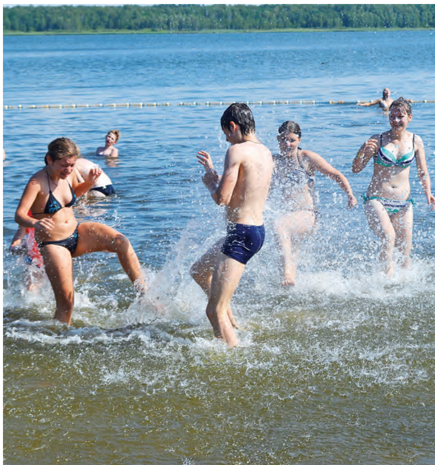
И все-таки, купание - это здорово! Жаль, что погожие деньки были так редко!

Отправив ребенка-третьеклассника в санаторий «Горняцкий» в июле, я была уверена – основным удовольствием заезда станет купание, а значит, он точно не соскучится. Но, увы, с погодой не повезло. Что же там можно делать три недели? В таких сомнениях в один из выходных я отправилась навестить сына... и попала на выборы.