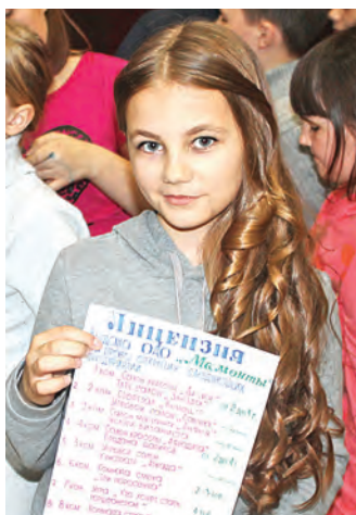
Главное в бизнесе - получить лицензию

очередь, выплачивают в виде зарплаты за поручения настоящие и шуточные. Задания типа «подари цветок врачу», «станцуй», «узнай, какого цвета глаза у библиотечкаря» вызывают неизменный восторг ребятни и помогают заработать определенное количество «горнячков». Теперь нужно обязательно потратить свои «горнячки» и заработать деньги других отрядов, и ребята отправляются по созданным салонам, лотерейным пунктам и игровым комнатам. Ну, и в финале – аукцион желаний. Организаторы предлагают купить на заработанные «горнячки» желания, которые будут обязательно выполнены в какой-то из дней: «не ходить на зарядку», «на озеро вместо сна», «на 20 минут продлить дискотеку», «фильм вместо сончасы». Большой аукцион пе-