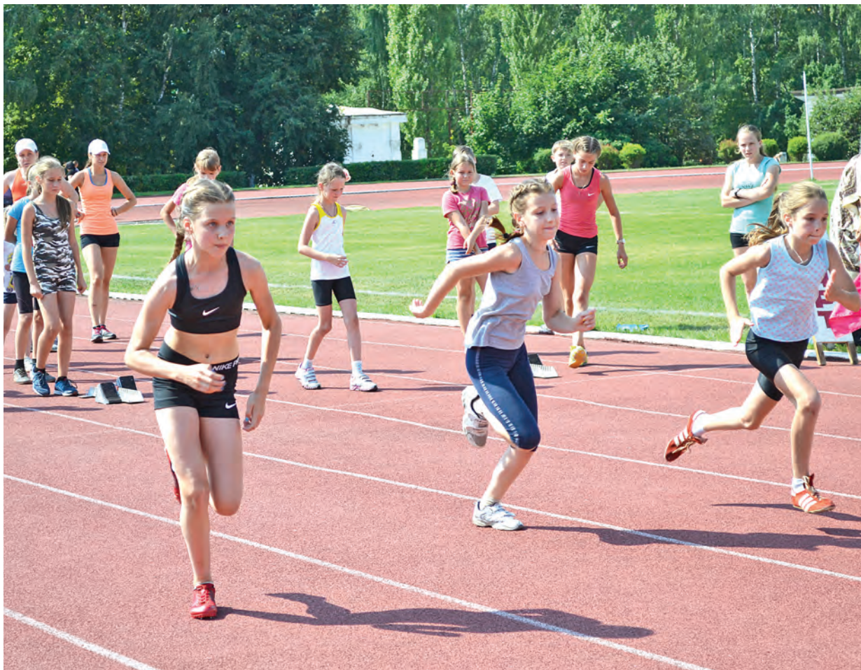
Первыми на беговые дорожки вышли самые юные легкоатлеты. Болельщики – родители, тренеры и друзья были в восторге от их скорости и выносливости