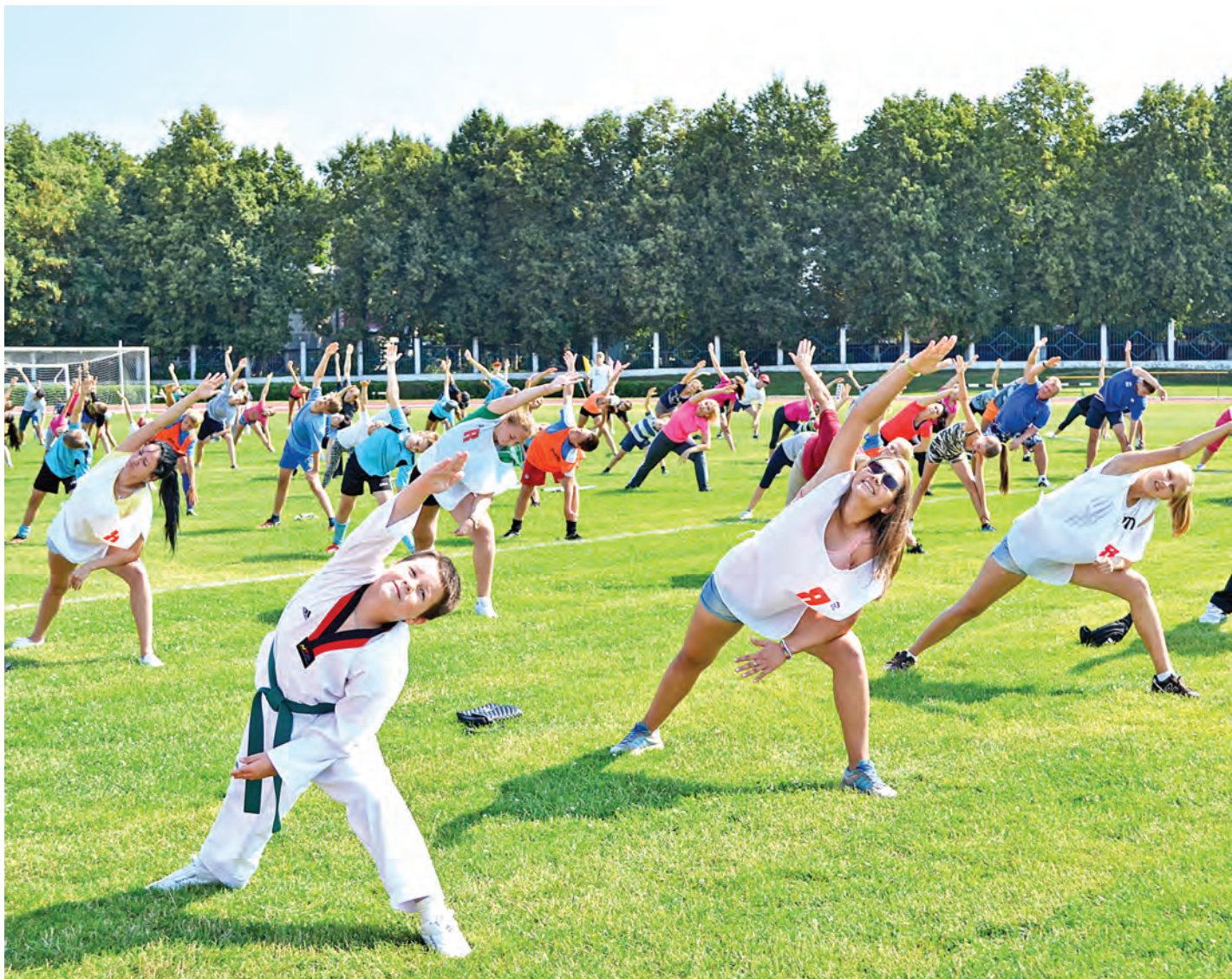
Физкультура - это полезно и очень весело!

В День физкультурника на стадионе «Горняк» прошла общегородская зарядка, в которой приняли участие несколько сотен железнодорожников.