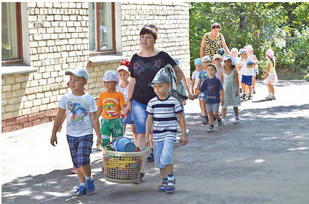
В сентябре и воспитанников детских садов ждут учебные занятия

В эти дни и недели идет поочередная проверка готовности городских учреждений образования к новому учебному году.