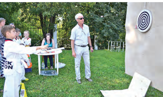
И взрослые, и дети попробовали свои силы в дартсе. Оказалось, что меткость от возраста не зависит