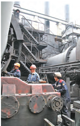
Ремонтники работают споро

А работники ЦМР укрепили фундамент сушильного барабана №4 - провели армирование, установили опалубку и залили в основание для агрегата 29 кубометров бетона. Причем завершили эту работу раньше намеченного срока. - Отставания от графика нет и на других направлениях. Такой темп дает уверенность, что все запланированные