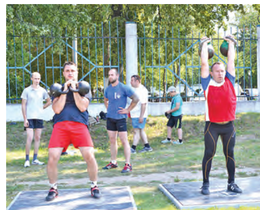
Силачи-гиревики провели открытую тренировку на свежем воздухе