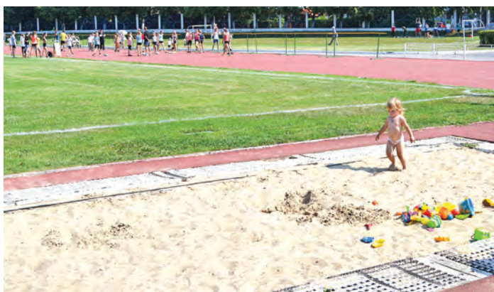
На стадионе «Горняк» каждый нашел себе занятие по интересам и способностям. Даже самые маленькие