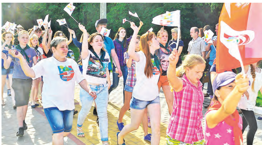
В праздничном шествии - столько эмоций!