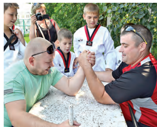
Армрестлинг – спорт для настоящих мужчин – сильных и выносливых