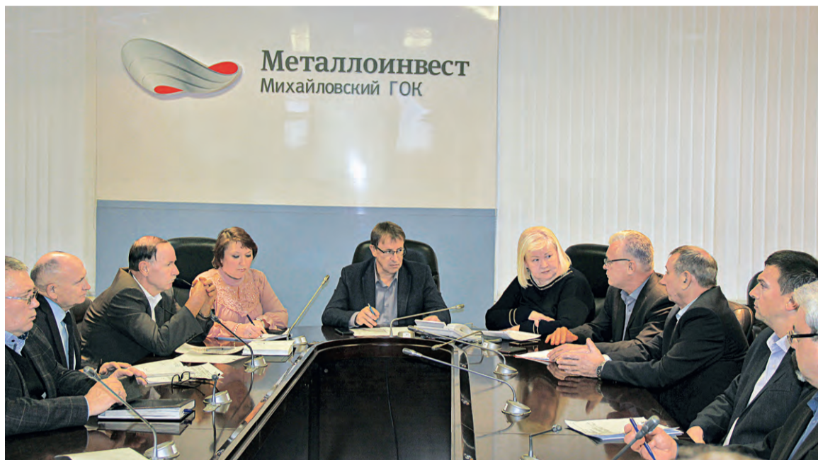
▲ Комиссия рассмотрела вопросы по организации и проведению кампании по заключению коллективного договора

На этой неделе в управлении комбината состоялось первое заседание комиссии для ведения переговоров по заключению коллективного договора на 2020–2022 годы. Был рассмотрен порядок обсуждения в цехах и подписания этого документа.