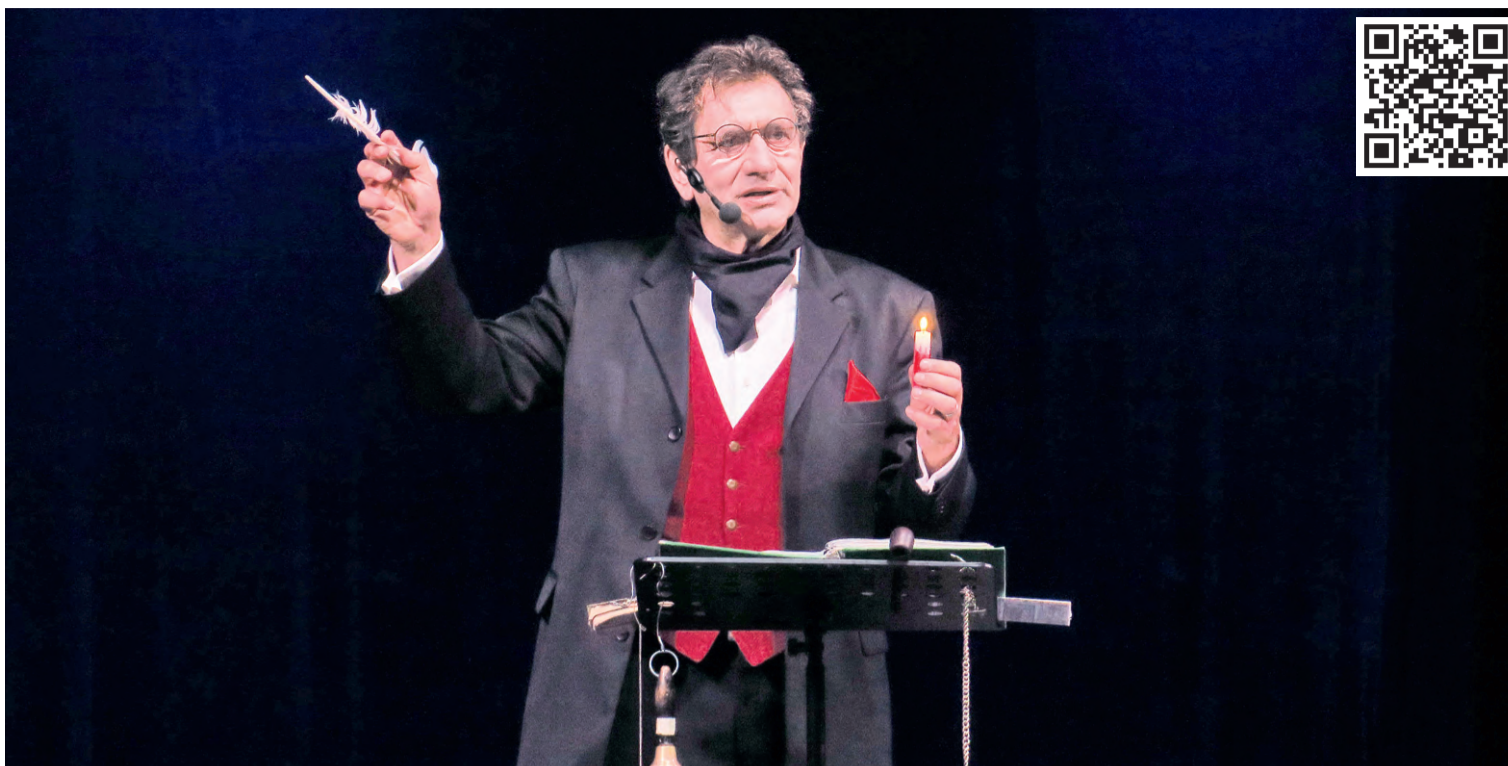
▲ Народный артист РФ Евгений Князев великолепно передал атмосферу того времени и характер персонажей