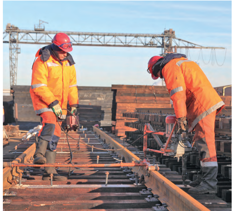
▲ Своевременное обновление железнодорожных путей и стрелочных переводов обеспечит безопасность движения поездов зимой

Важно, чтобы весь этот производственный процесс работал без перебоев. Что-