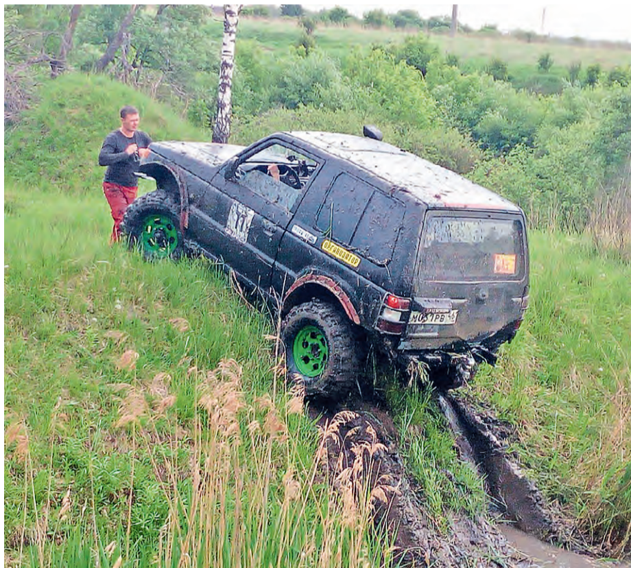
◀ Главное для джиперов — подготовить машину к гонкам, чтобы она могла пройти все испытания

хаил Ильин и его товарищи провели ещё и Кубок ГИБДД, в котором обычно участвуют сотрудники инспекции — чаще всего в роли штурманов вместе со спортсменами.