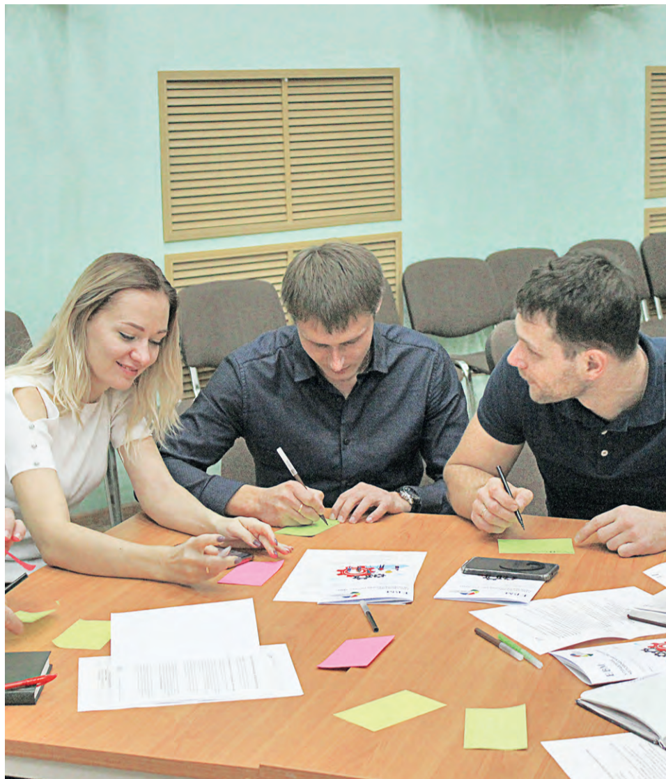
▲ В процессе обучающего занятия авторы каждого проекта подготовили краткие выступления о своей работе и рассказали о проведённых и запланированных мероприятиях, выделили свои успехи и обсудили возникающие вопросы

проектов, участники обучающего форума узнали много нового и полезного. Они смогли сравнить проделанную за несколько месяцев работу, обозначить главное в будущих мероприятиях.