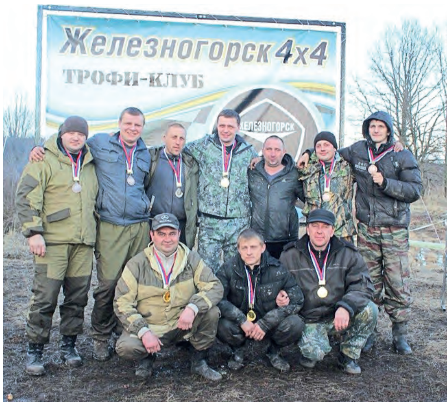
◀ На трофи-рейды джиперы выезжают большой дружной командой

Как утверждают участники гонок, ежегодный железногорский трофи-рейд по своему уровню занимает третье по значимости место в России. Ежегодно «Трофи 46» проводит отборочные этапы «Кубка регионов». Одна-две гонки обязательно проходят в Железногорске. В этом году Ми-