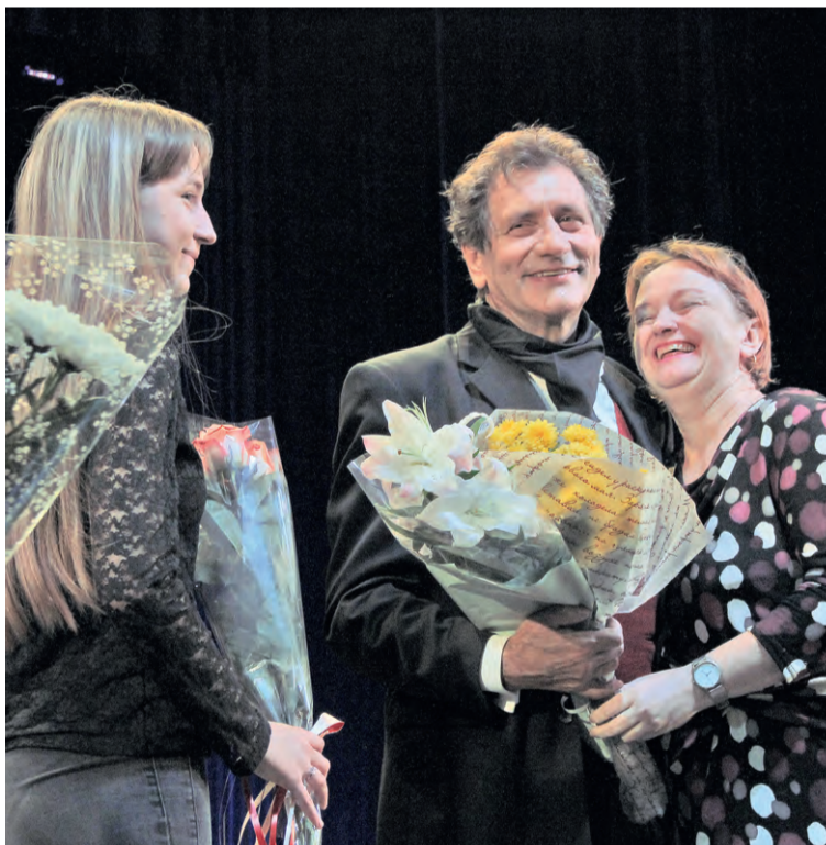
▲ После спектакля благодарные железногорские зрители ещё долго не отпускали актёра

В моноспектакле всё зависит от мастерства актёра. Он остаётся один на один с залом и овладевает его вниманием, завораживая слушателей полной драматизма историей игрока Германа, постигшего мистическую тайну. Актёрская энергетика, тембр голоса, интонации погружают публику в великолепный пушкинский текст.