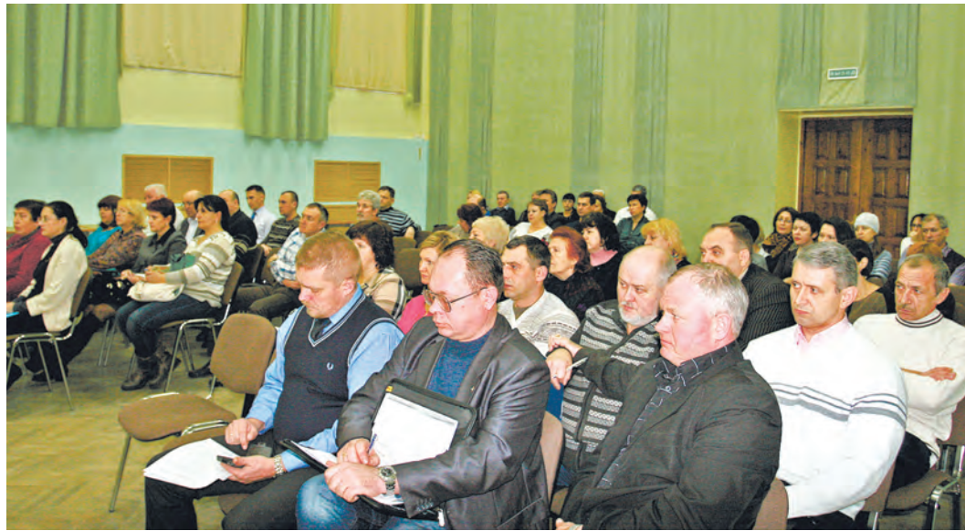
Социальные вопросы всегда в приоритете Компании и его предприятия