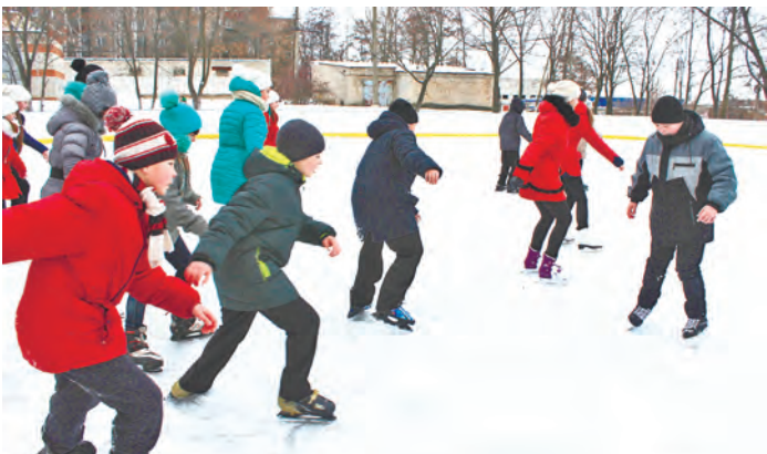
Берем разгон, и вперед за тренером! Ребята очень старались выполнять все движения правильно и четко