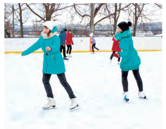
Девочки очень радовались возможности научиться красивым элементам фигурного катания