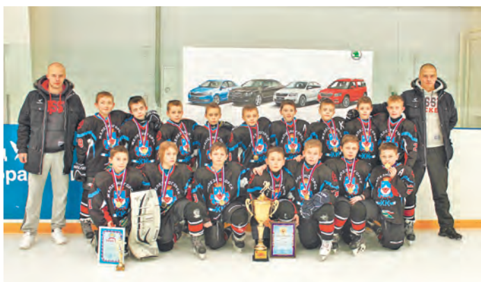
Команда юных железногорских хоккеистов - победителей

ХК «Железногорск» - победители! 6 -7 февраля на ледовой арене «Айсберг» г. Шебекино Белгородской области проходил