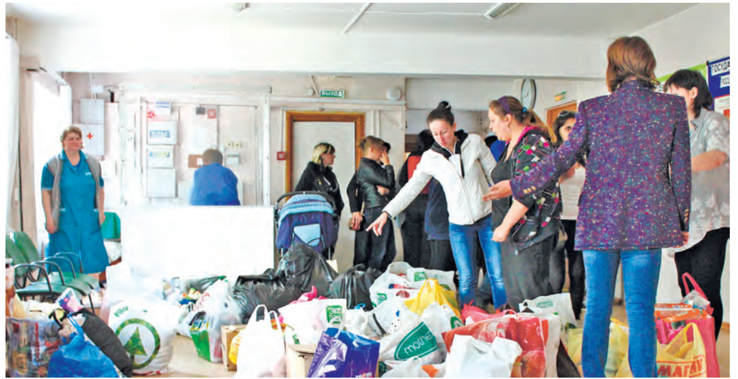
Беженцам с Украины часто не хватает самого необходимого

Уважаемые работники Михайловского ГОКа! На Юго-Востоке Украины долгие месяцы не прекращались боевые действия, шли страшные артобстрелы населенных пунктов, в результате которых гибли мирные люди. Большое число мирных жителей Донбасса и Луганщины, спасая себя и детей, бежали и продолжают прибывать в Россию, в Курскую область, в наш город Железнодорожск. Проблема беженцев остается. Прибывшие из зоны войны семьи, одинокие старики и дети нуждаются в нашей активной поддержке и помощи. Этим людям порой не хватает самого необходимого: питания, одежды, медикаментов. Не у каждого из них есть надежная крыша над головой и работа. Горняки Михайловского ГОКа всегда были готовы помочь людям, попавшим в беду и трудные жизненные ситуации. Тому было немало примеров. Именно коллектив комбината оказал самую значительную помощь беженцам с Украины. Так, в прошлом году в фонд «Железнодорожск – любимый город» наш коллектив перечислил для беженцев 1 млн 300 тысяч рублей.