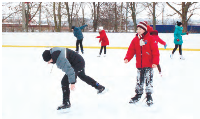
Не у всех сложные элементы получались с первого раза, но несмотря на это, ребята были рады стараться