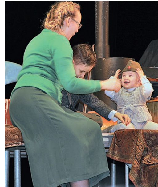
Для многих актёров этот выход на сцену стал первым.