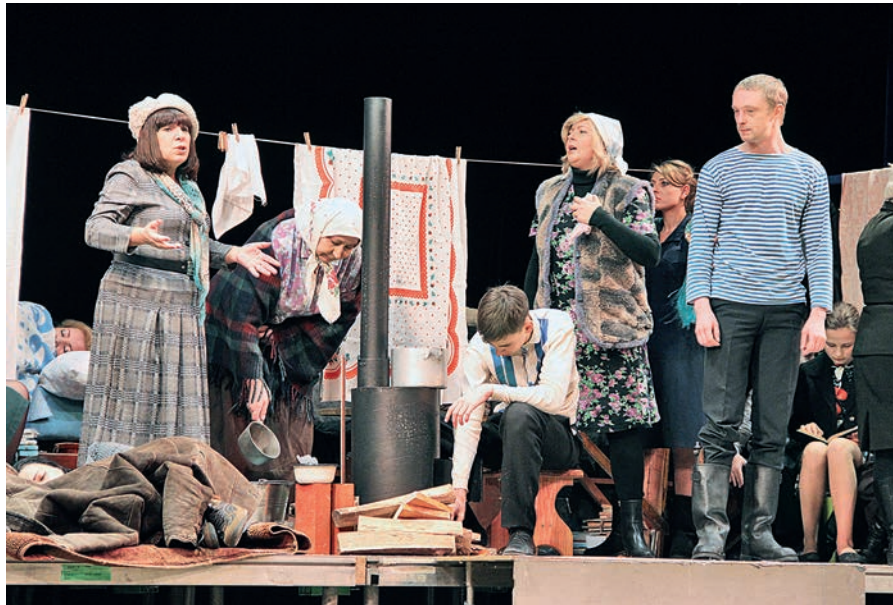
Этот вагон — своего рода маленький мир со своими правилами, распорядком дня.