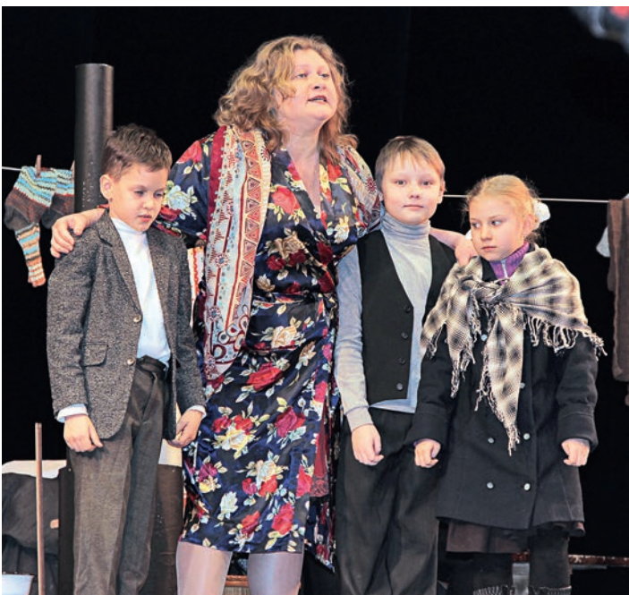
Общее горе роднит, и соседи по вагону проникаются участием друг к другу.