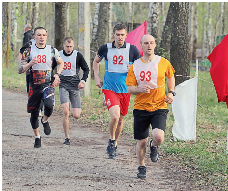
Окончание. Начало на стр.4

В ПАО «Михайловский ГОК» организацию питания осуществляет Общество с ограниченной ответственностью «Цех питания» — дочернее предприятие комбината. Во всех подразделениях комбината организовано корпоративное питание работников от завтрака до ужина. Учитывая территориально удалённое расположение подразделений комбината и ДО, обеспечение горячим питанием рабочих и служащих комбината и дочерних организаций организовано в различных форматах. Во всех крупных структурных подразделениях функционируют столовые с полным циклом производства, в настоящее время таких столовых 13. 4 столовые — раздаточные, которые обеспечивают питанием малочисленные коллективы на удалённых участках. Для обеспечения горячим питанием шахтёров, занятых в дренажной шахте, организована доставка питания в индивидуальных термосах. Три мобильных передвижные столовые: две на базе автомобилей «УРАЛ» и одна на базе автобуса ПАЗ обеспечивают питанием работников занятых на работах в карьере. В целом ежедневно горячее питание получают до 4000 человек, это более 70% работающих в смену.