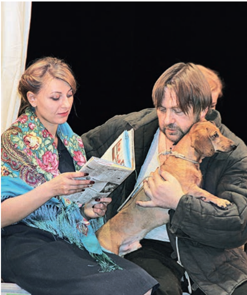
Роли удались всем актёрам.

Во Дворце культуры состоялась премьера пьесы «Эшелон» Михаила Рощина. Роли исполняли участники и руководители творческих коллективов и объединений ОДКиТ.