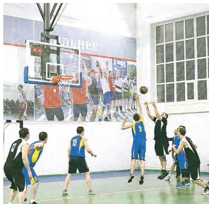
Жаркий момент на игровой площадке

С 14 по 22 ноября баскетболисты первой группы цехов отчаянно сражались за победу. А в финале турнир столкнул лучших игроков комбината. Баскетбол для большинства из них не просто хобби - с самого детства наши спортсмены связаны с этим видом спорта, некоторым довелось быть участниками высшей лиги. Соревнование получилось весьма зрелищным и импульсивным. Невероятные по накалу страстей