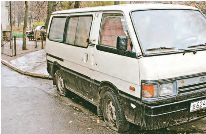
Вот такими «ветеранами» обрастают наши дворы

Бесхозные машины заполоняют придомовые участки и бесплатные стоянки Железнодорожников.