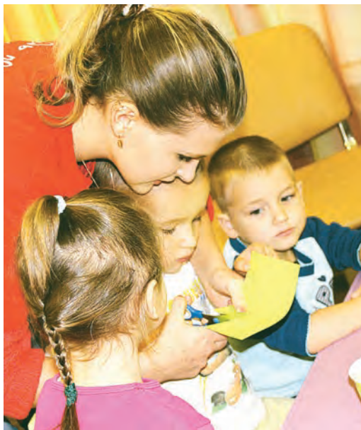
Творим открытки вместе

Активисты Школы полезного действия Металлоинвеста напомнили воспитанникам Центра социальной помощи семье и детям, что Новый год совсем близко.