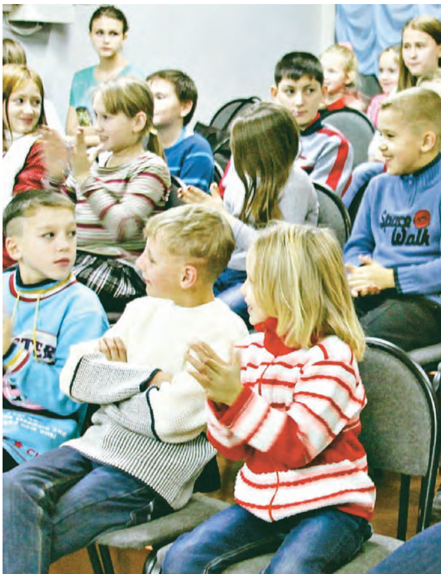
Горячие аплодисменты артистам от маленьких друзей

Н е в первый раз участники Школы полезного действия организуют для воспитанников железнодорожного приюта сказочные представления. Каждая такая встреча – волшебный праздник, наполненный теплом, добротой и детским смехом. На этот раз активисты совместно с кукольным театром «Буратино» решили показать ребятам детский спектакль, а также провести мастер-классы изготовления праздничных открыток.