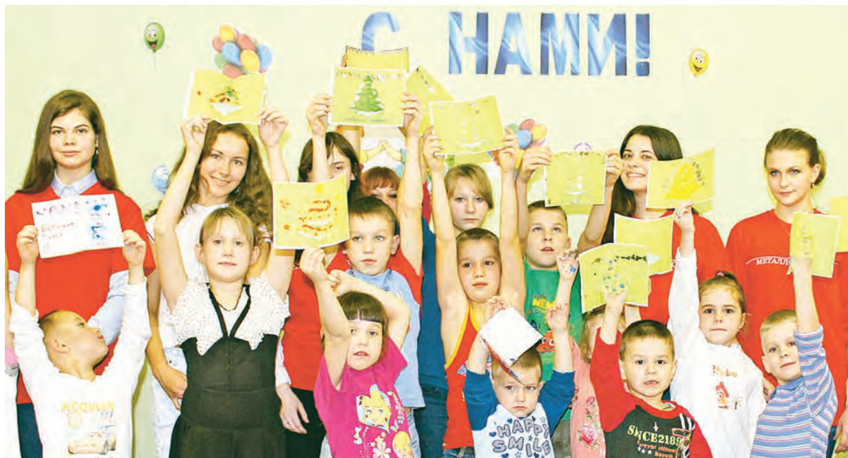
Вот какие замечательные открытки получились у нас!