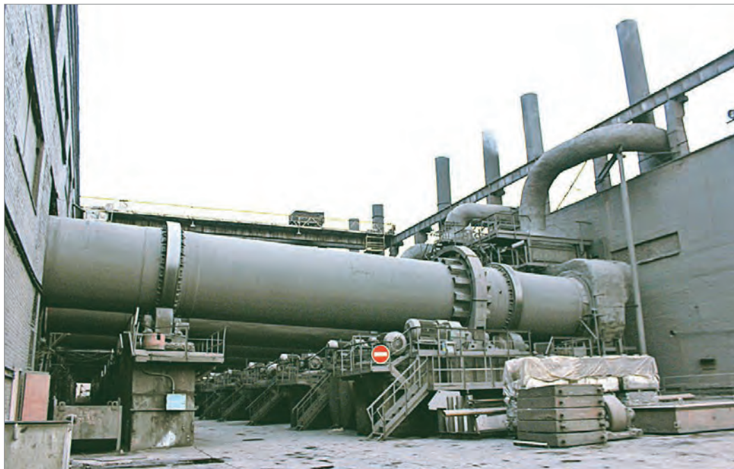
На участке сушки работа идет полным ходом

Столь успешному сезону сушки способствовал большой ремонтный период с апреля по сентябрь, во время которого капитально обновили 5 и 7 печи, а также 4 и 6 сушильные барабаны. На конвейерах №14 и №53 заменили конвейерные ленты. Остальное оборудование было хорошенько ревизовано.