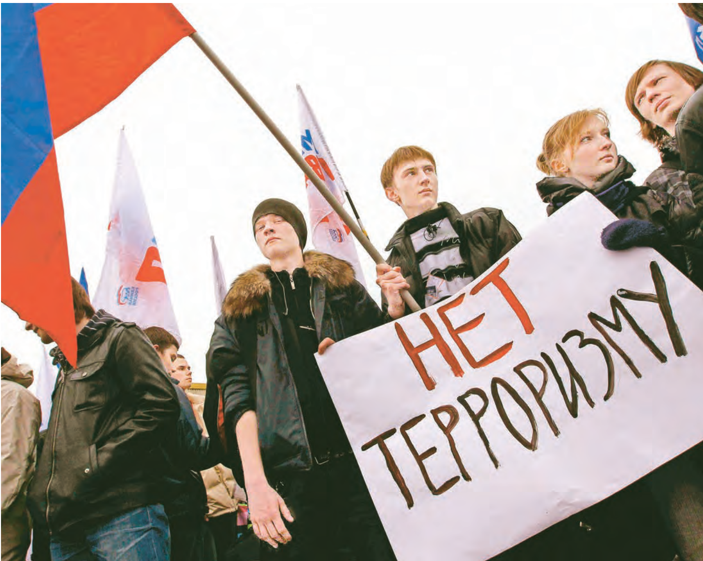
Задачу общей безопасности можно решить только совместными усилиями

В России серьезно усилены меры безопасности на всех видах транспорта, а также в общественных местах и при проведении массовых мероприятий.