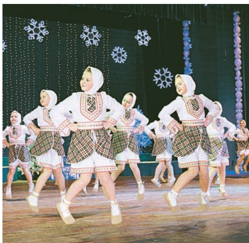
Какой же праздник без задорного танца!