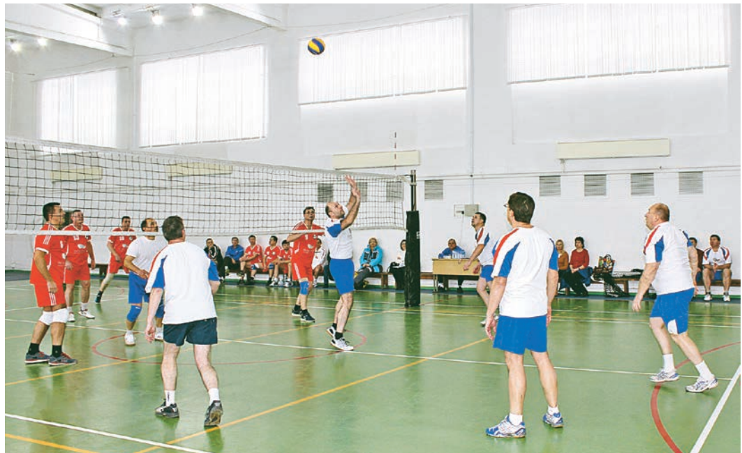
Волейболисты показали не только увлекательную игру, но и умение работать в команде

4 ЯНВАРЯ В СПОРТИВНОМ ЗАЛЕ СК «МАГНИТ» СОСТОЯЛСЯ ТРАДИЦИОННЫЙ ТОВАРИЩЕСКИЙ ВОЛЕЙБОЛЬНЫЙ МАТЧ МЕЖДУ СБОРНЫМИ КОМАНДАМИ МИХАЙЛОВСКОГО И ЛЕБЕДИНСКОГО ГОКОВ.