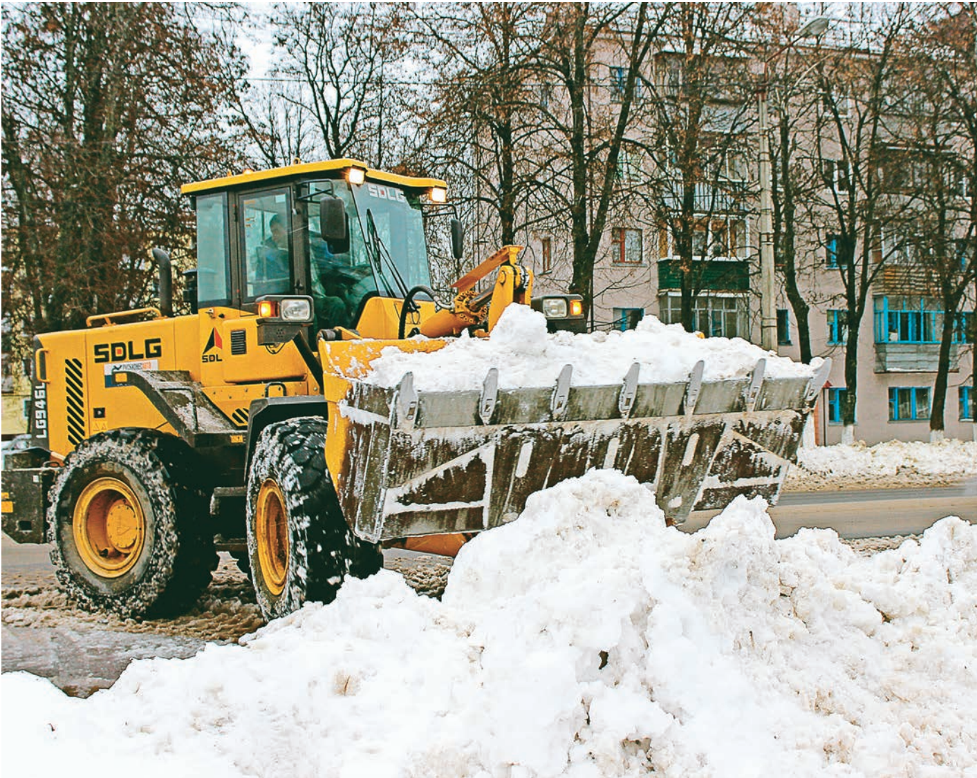
Одна из мер борьбы с заносами - вывозка снега за пределы города

...временами ледяной, с промозглым ветром, накрыли большинство регионов страны. Как справляются с непогодой Курская область и Железногорск?