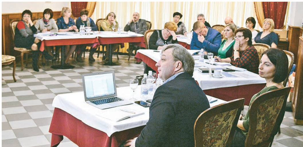
Участники совещания обсудили вопросы сохранения здоровья работников предприятий

в Губкине в конце прошлого года. Полтора года назад на всех комбинатах, входящих в состав Компании, была создана единая медицинская служба под эгидой управления по охране здоровья. Сегодня её специалисты уже работают как отлаженный механизм. Такое объединение дало положительные результаты, которые были представлены руководителями медицинских подразделений и корпоративных учреждений Компании в отчётах-презентациях.