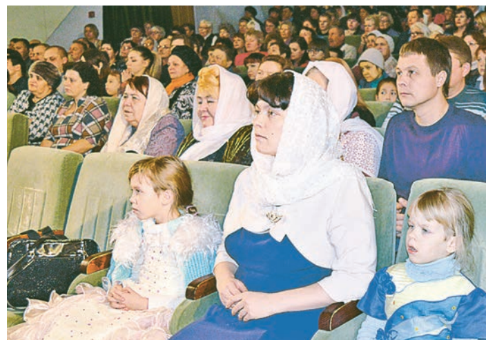
На праздничный концерт пришли и взрослые, и дети