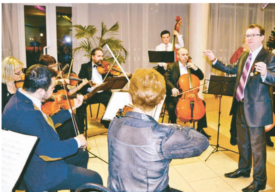
Уже в фойе игра оркестра настраивала на праздничный лад