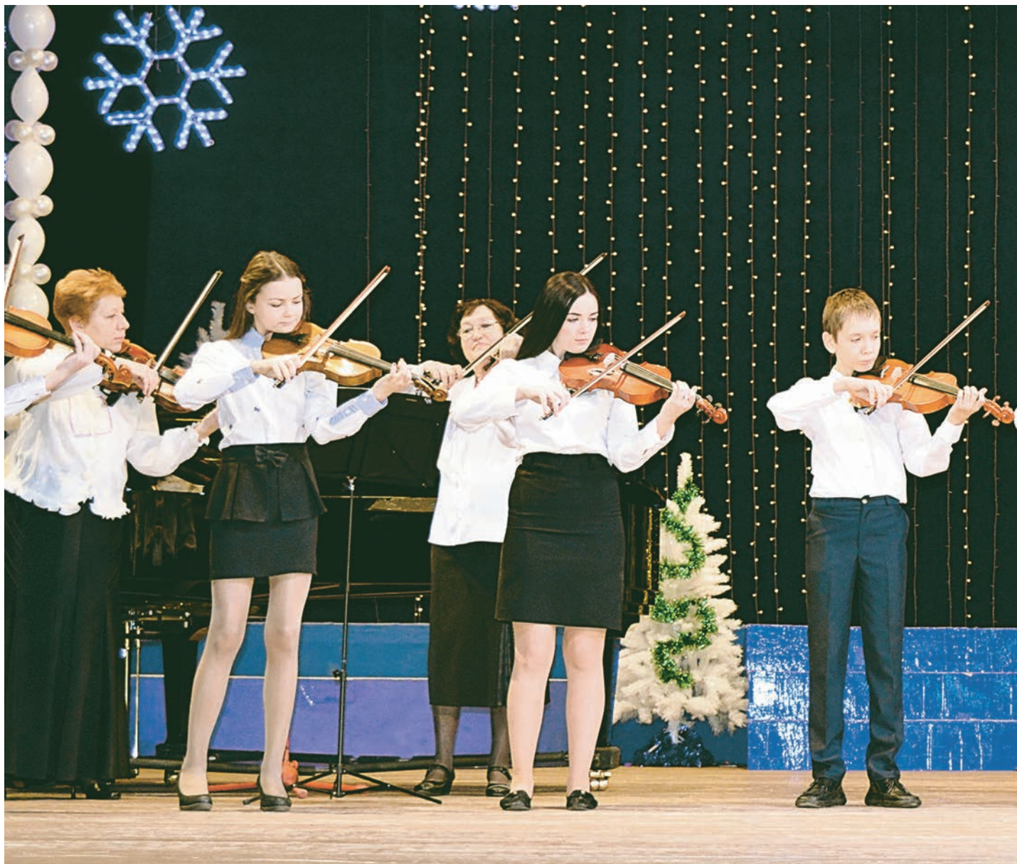
Юные скрипачи вызвали бурю оваций