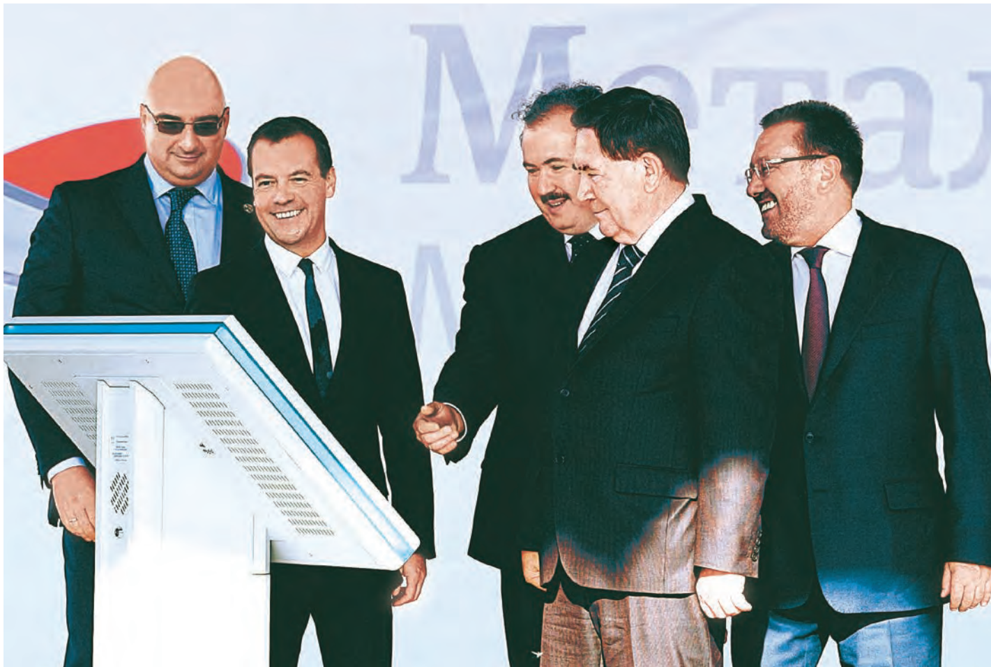
Пуск обжиговой машины №3 дан!

Сегодня, 25 сентября на Михайловском горно-обогательном комбинате состоялся торжественный пуск в эксплуатацию комплекса обжиговой машины № 3 – ключевого инвестпроекта компании «Металлоинвест» в Курском регионе. Почетный гость - премьер-министр РФ Дмитрий Медведев.