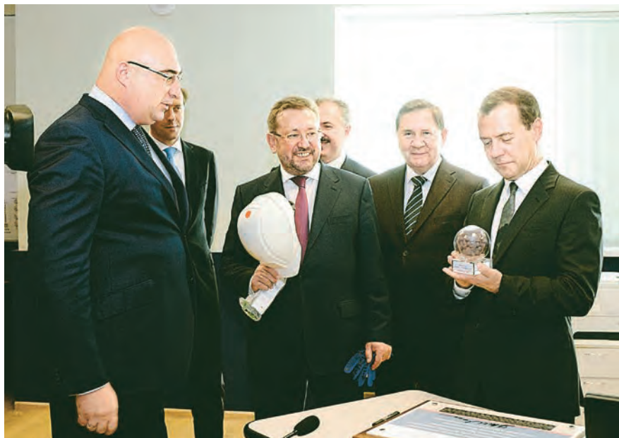
Первые окатыши ОМ-3 – в подарок председателю Правительства РФ

Юлия Ханина