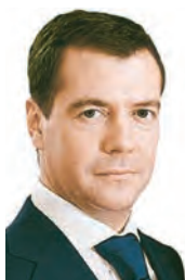
Д.А. Медведев премьер-министр РФ:

Сердечно поздравляю всех с пуском нового производственного комплекса, всех благодарю за работу. В ней, помимо такого гиганта, как МГОК, принимали участие ведущие наши машиностроительные компании, научные предприятия. Результат впечатляет. Первая машина с такими технологическими характеристиками в России, она позволяет существенно увеличить производство железорудной продукции, которая востребована нашими заводами, идет на экспорт и является основой благополучия региона, в значительной степени всей нашей страны. Ее запуск позволит улучшить лидирующие позиции комбината. Здесь использована уникальная российская технология. Это говорит о том, что мы можем создавать свои современные продукты, собственную высокотехнологичную продукцию. А значит, у нас есть возможности рассчитывать на свои силы, заниматься тем, что сегодня принято называть импортозамещением и что нам действительно нужно, нужно на будущее. Новый комплекс – пример успешного инвестиционного проекта, когда деньги вкладываются в производство, приносят значительный экономический эффект, стабильно пополняется бюджет. Это очень важно и для нашей страны и для Курской области.