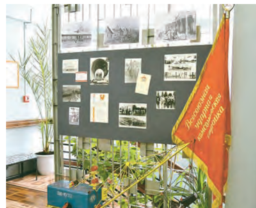
Ударно работали, были веселыми и дружелюбными - и построили замечательный город