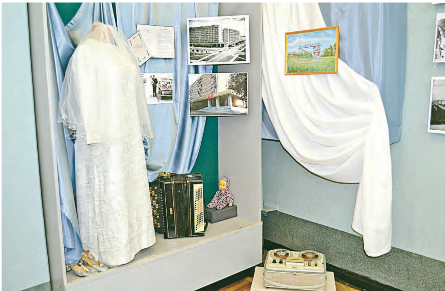
На выставке было множество экспонатов, которые заинтересовали посетителей