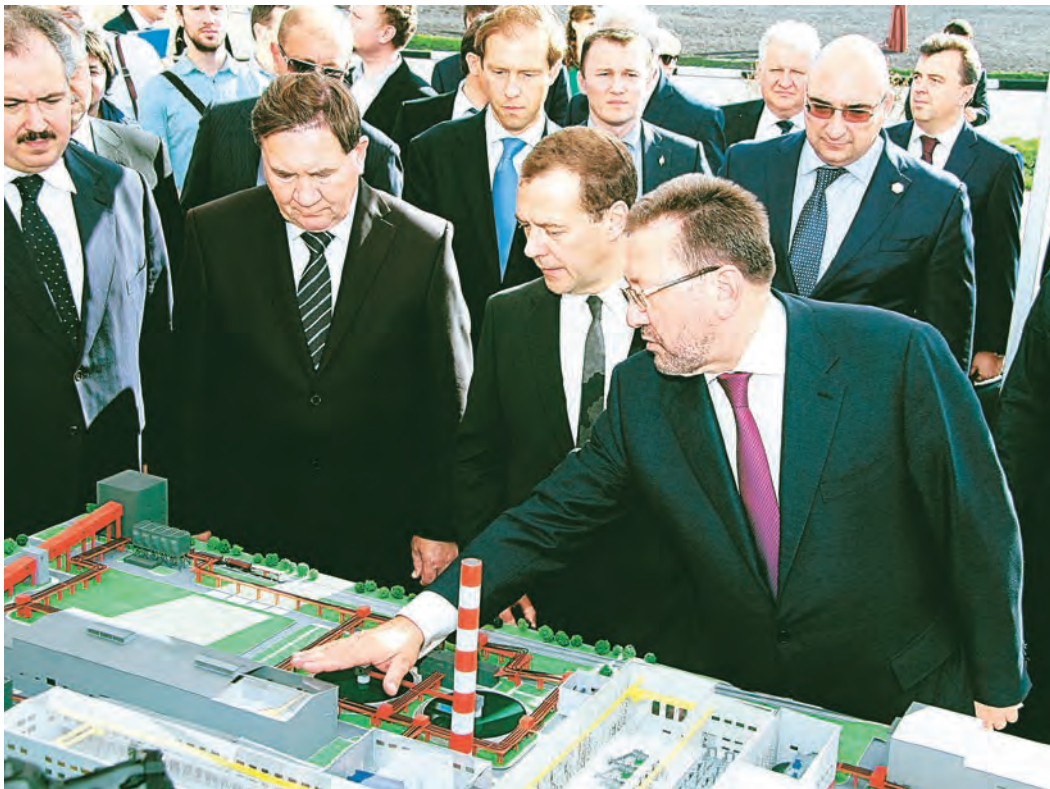
Премьер-министр ознакомился с макетом комплекса ОМ-3

Строительство обжиговой машины №3 – важный этап в реализации стратегии развития Компании. Запуск комплекса укрепляет позиции Металлоинвеста как крупнейшего эффективного международного производителя продукции с высокой добавленной стоимостью. Важно отметить, что строительство реализовано в партнерстве с отечественными машиностроителями. Проектирование, производство, поставку и монтаж основного оборудования, пусконаладочные работы осуществляли более 600 российских организаций.