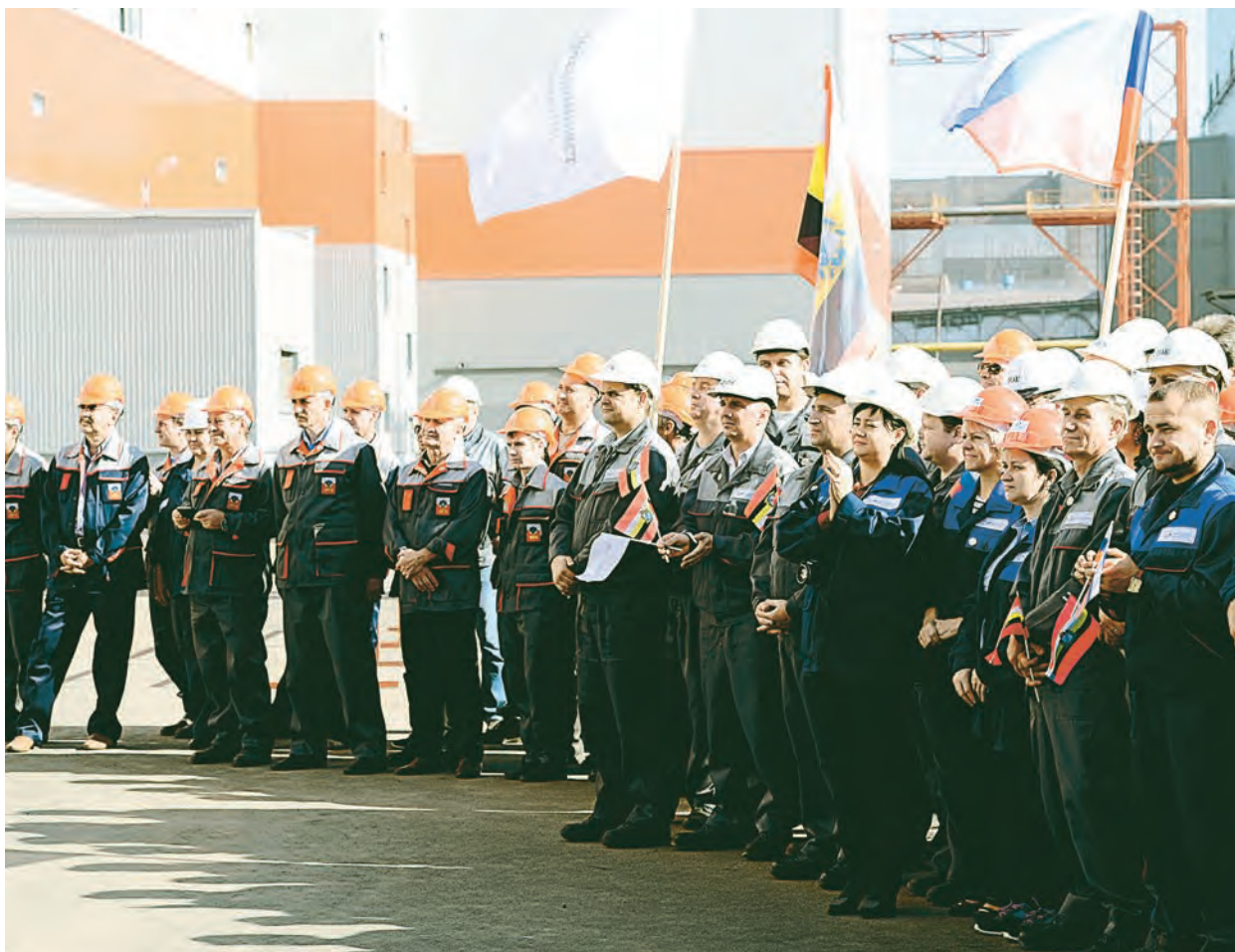
Пуск обжиговой машины – большое событие для коллектива