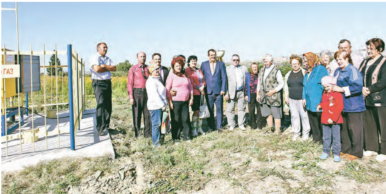
Торжественный момент газификации и фото на память

На прошлой неделе в торжественной обстановке деревню Остапово подключили к общей системе газоснабжения.