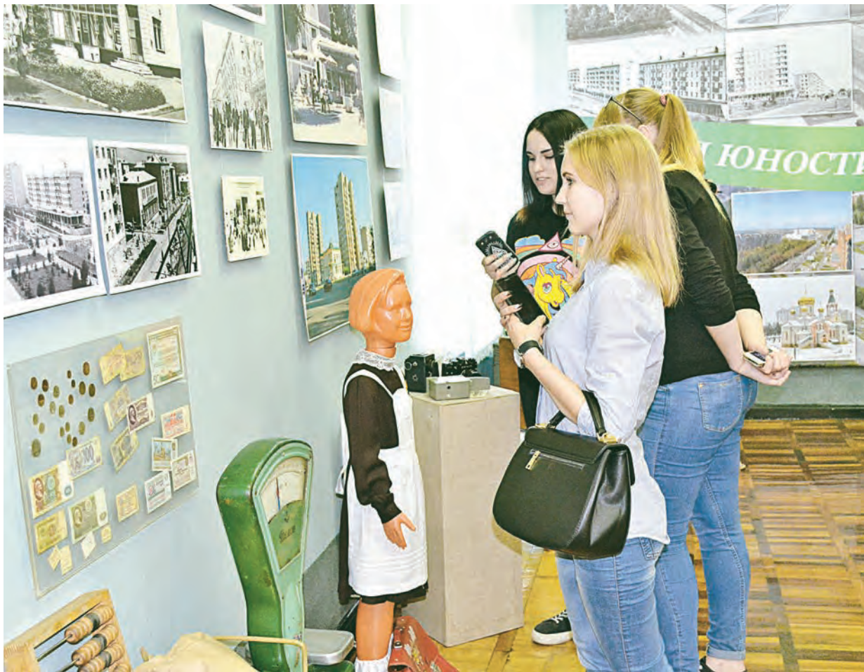
Ребята с большим интересом рассматривали старые фотографии Железнодорожного и удивлялись тому, как сильно изменился со временем их родной город