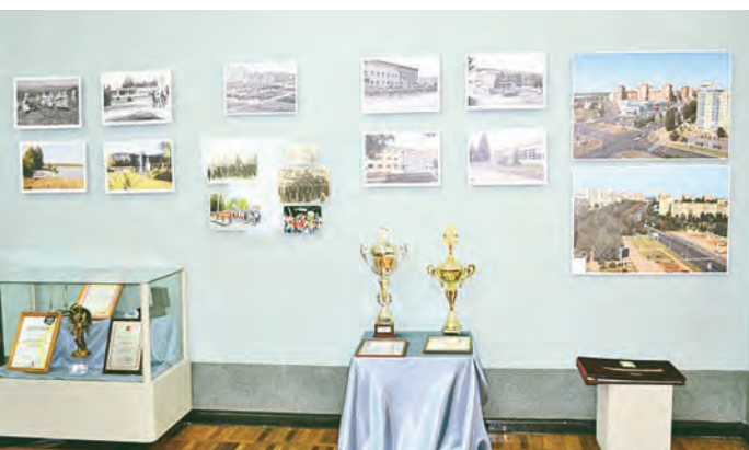
Железнодорожный современный - с красивыми домами, ухоженными улицами и множеством наград в разных сферах жизни