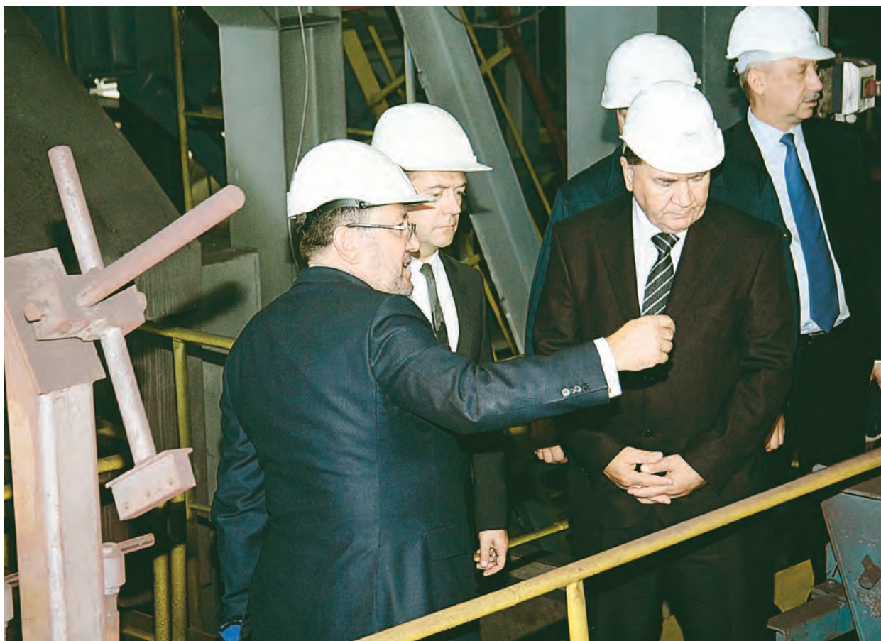
Дмитрий Медведев побывал на участке обжига

Лучшие инженеры и конструкторы, строители и управленцы делали все для того, чтобы создать целый промышленный городок под названием ОМ-3 и приблизить это радостное событие. Нам действительно есть чем гордиться: сегодня обширная площадка ОМ-3 – это красавица среди промышленных объектов комбината. Современный, мощный, очень благоустроенный фабричный комплекс. И ему по силам реализация новых больших производственных задач в рамках стратегической программы Компании «Металлоинвест».