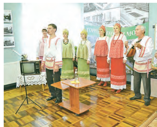
Перед посетителями выставки выступил народный ансамбль «Радуйся»