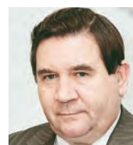
А.Н. Михайлов губернатор Курской области: