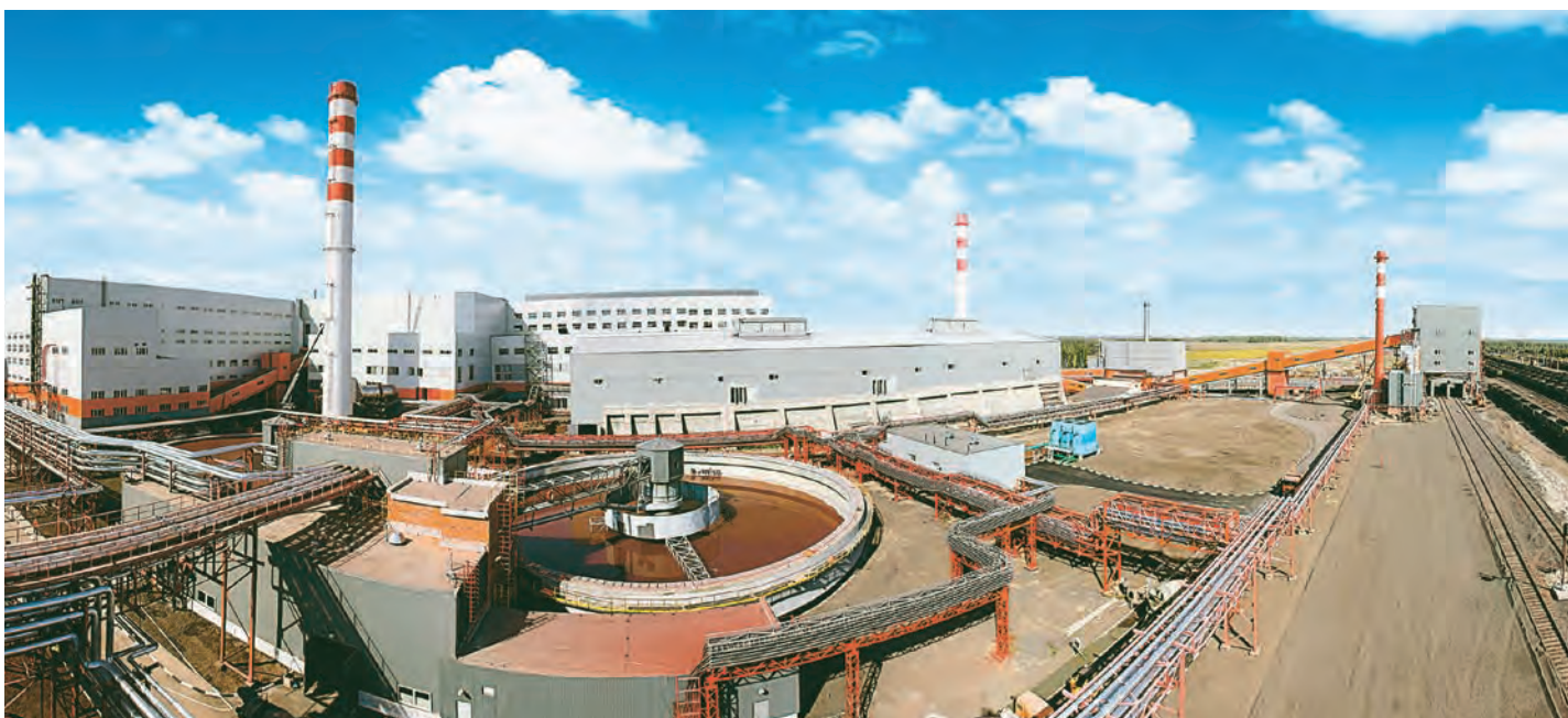
Новый промышленный объект – воплощение мощи и красоты

Новая обжиговая машина №3 на Михайловском ГОКе уже попала в Летопись национальных достижений альманаха «Время России». Задача этого всероссийского проекта – популяризация национальных трудовых достижений, важнейших индустриальных, инфраструктурных и социальных проектов, лучших представителей трудового общества на уровне России и субъектов Федерации. Приятно, что издание не обошло вниманием и достижения курского края. В материале под заголовком «Новые мощности Михайловского ГОКа» рассказывается о вводе в Железнодорожском главном привода обжиговой машины №3. Авторы отдельно подчеркивают, что ОМ-3 – первая из построенных в России за последние десятилетия мощностей по выпуску железорудных окатышей.