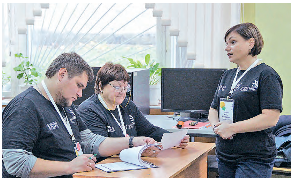
Жюри обсуждает предварительные результаты.