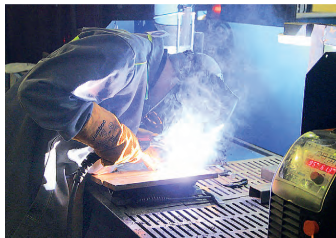
Сварочный шов должен быть ровным и прочным.