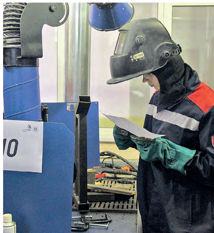
Один из участников изучает задания чемпионата.