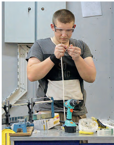
Во время выполнения конкурсного задания.