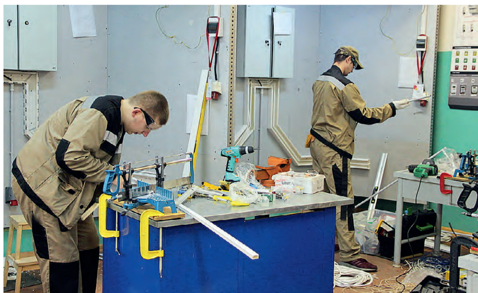
Студенты-железнодорожники до миллиметра высчитывают длину кабель-каналов.