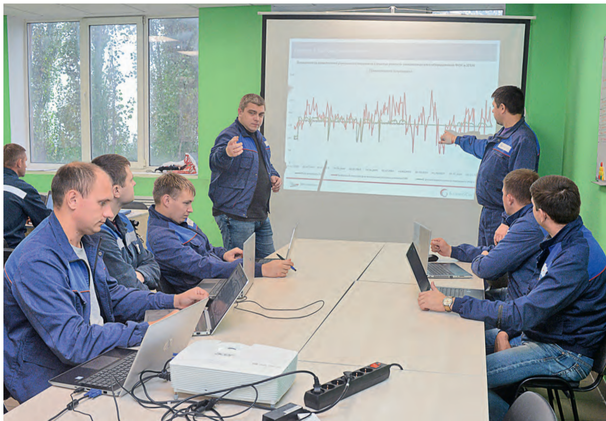
В штабах навигаторов Бизнес-Системы идёт непрерывная работа по внедрению улучшений на предприятии.

Лебединский ГОК стал пилотной площадкой внедрения Бизнес-Системы Металлоинвеста, полученный опыт будет распространяться на другие предприятия компании. Движущей силой этого проекта стали навигаторы Бизнес-Системы — об их роли, ответственности, задачах и возможностях сегодняшний рассказ.