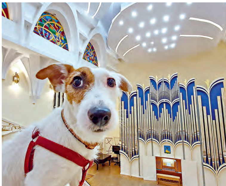
▲ Джек-рассел-терьер Вольт нередко участвует в концертных программах своего хозяина

— Сам я весь в музыке и вообще не слежу за грантами. Деньги — последнее, о чём я думаю. Иногда даже забываю забрать гонорар после концерта. Мне главное — поиграть, собрать людей. Так и с «Белгородским звоном»: с меня — идея и во-