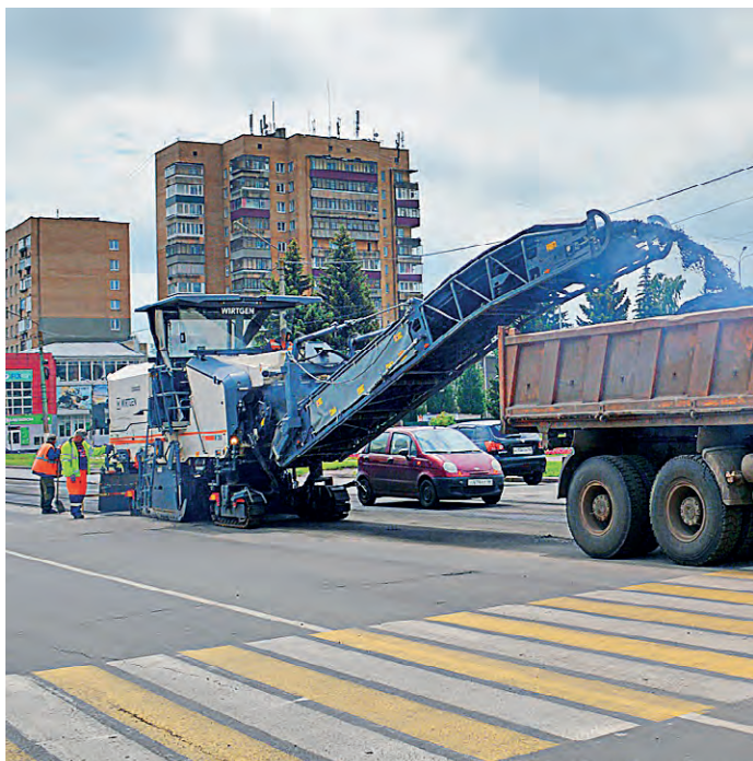
▲ Ремонт дорог — одна из главных задач железнодорожской администрации

Колесо в рабочем состоянии, его ждёт ремонт.