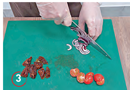
▲ Лук нарезаем тонкими полукольцами