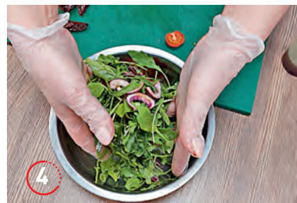
▲ Отправляем всё в миску, туда же — рукколу. Перемешиваем