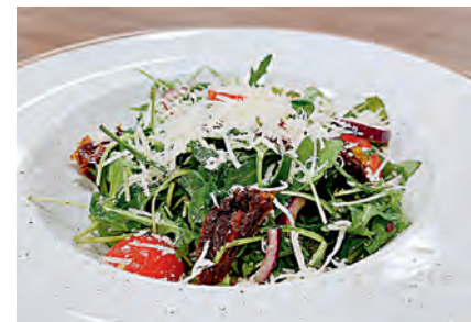
▲ Получаем лёгкое и полезное блюдо. Наслаждаемся!