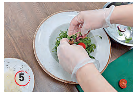
▲ Посыпаем натёртым пармезаном, заправляем соусом