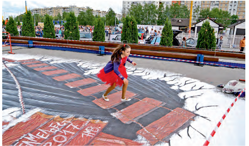
▲ Раньше фестиваль «БелМелФест» проходил исключительно в Белгороде. Теперь он приедет и в Губкин

14 проектов стали победителями грантового конкурса «АРТ-ОКНО»