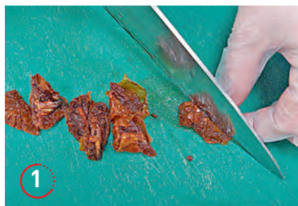
▲ Вяленые помидоры режем пополам