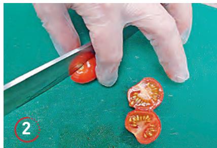
▲ Точно так же поступаем с черри