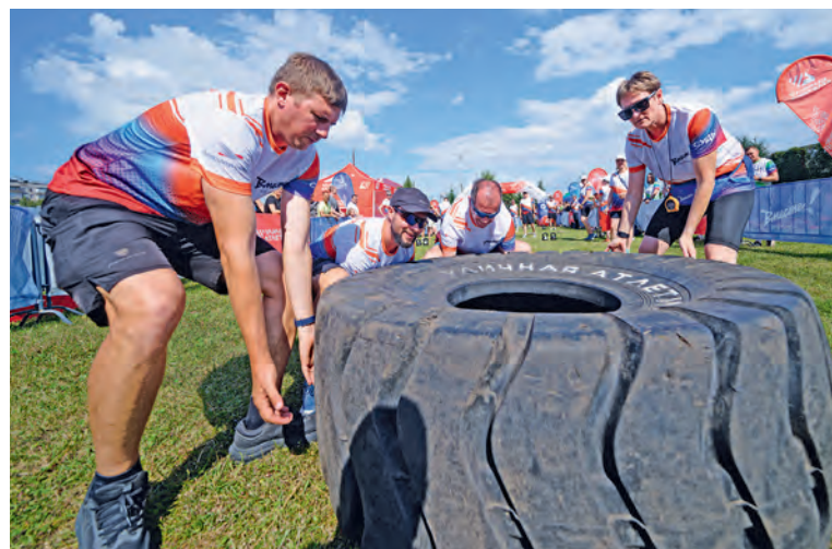
▲ Кантовка покрышки — один из самых сложных и зрелищных видов уличной атлетики

26 участников из Фатежа, Курска и Железногорска соревновались в армрестлинге в физкультурно-