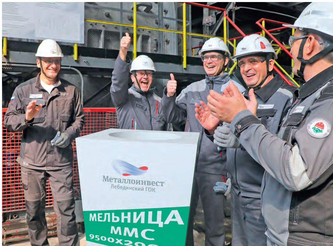
▲ Торжественный запуск руководители компании, комбината и подрядных организаций приурочили ко Дню металлурга. Нажатие кнопки — и мельница в работе!

Ещё одно преимущество — компактное расположение всех узлов и возможность установить агрегат на существующие фундаменты без дополнительных строительно-монтажных работ. Установку начали в апреле, а завершили в июле.