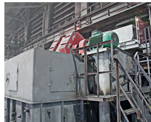
▲ Производительность новых каскадов — выше на 200 тонн в час