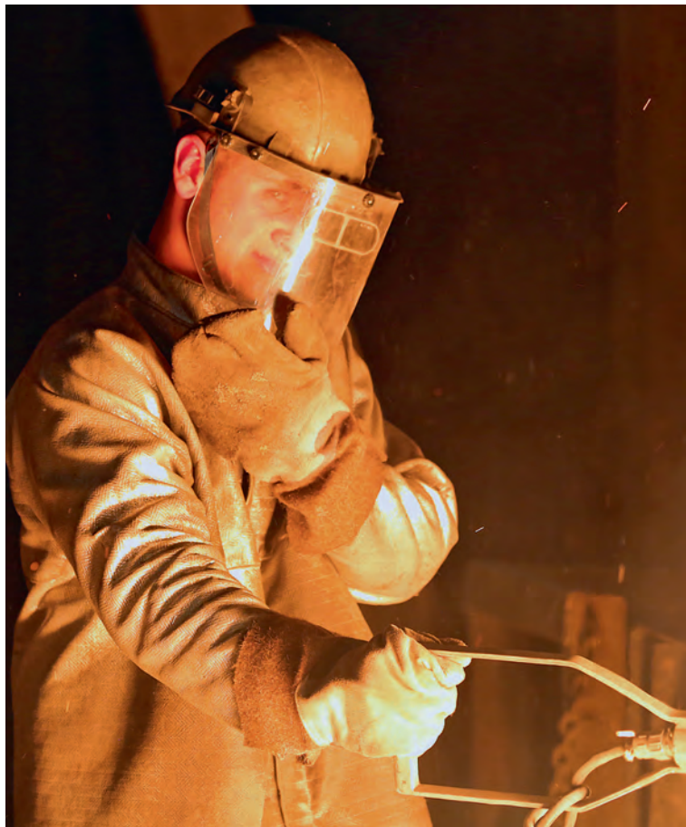
▲ Где бы вы ни работали — у печи или под открытым небом — важно не забывать заботиться о своей коже

Открывшись солнцу, мы платим очень большую цену. Сегодня рак кожи занимает первое мес-