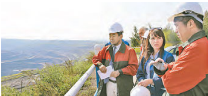
Японские гости подробно расспрашивали о Михайловском ГОКе

5 сентября на Михайловский ГОК с деловым визитом прибыла иностранная делегация компании «Nippon Steel & Sumikin Bussan Corporation».