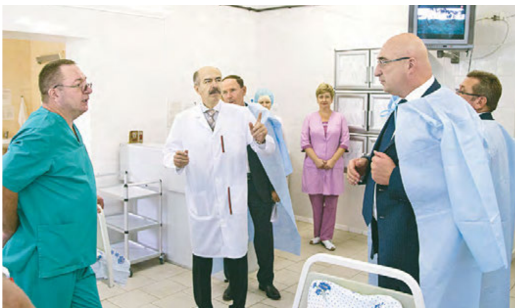
Гости смогли увидеть своими глазами работу современного оборудования