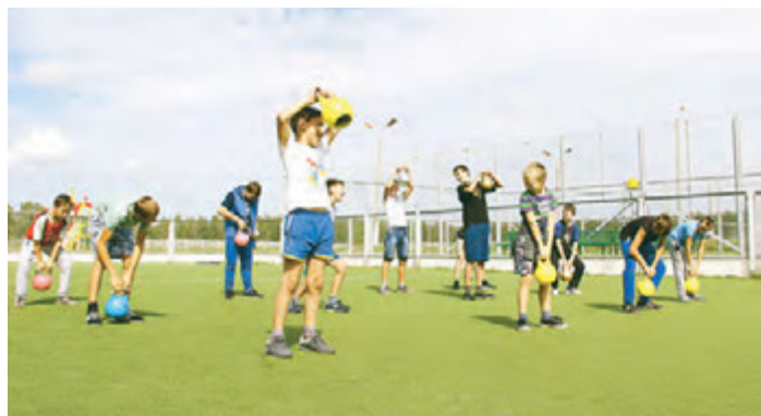
«Добрая сила» - проект, который сделает вас здоровыми и сильными