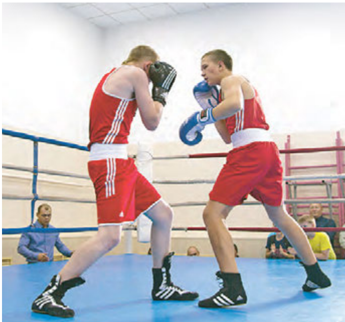
Тренироваться в таком зале - одно удовольствие