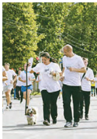
...и четвероногие друзья семьи