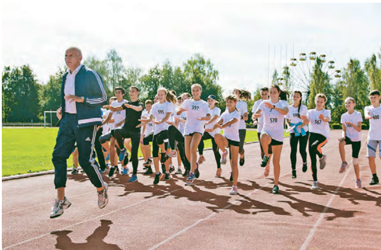
Легенда советской легкой атлетики Игорь Тер-Ованесян готовит к старту юных железнгорцев