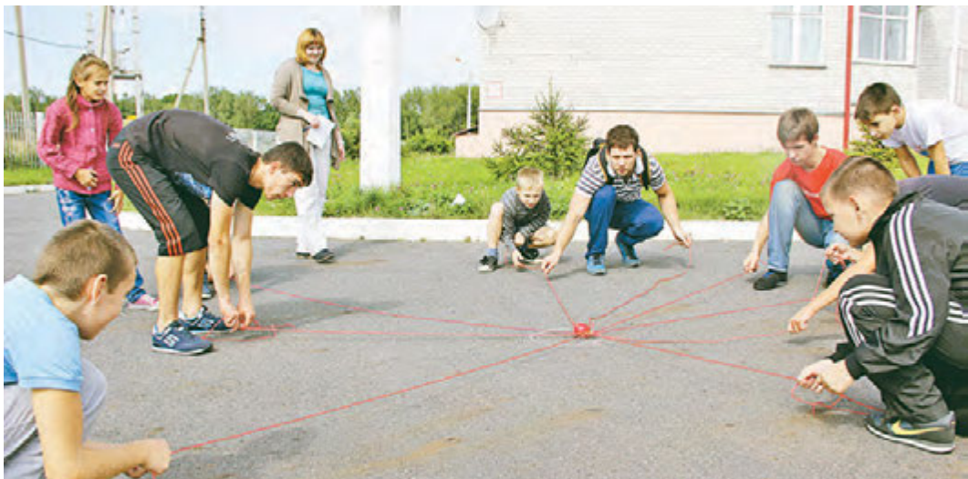
Цель проекта «Поделись мечтой» - социальная адаптация детей, попавших в сложную жизненную ситуацию

Утро субботы, несмотря на обещанный дождь, выдалось довольно тёплым. Возле Центра детского творчества собирается народ. - Канат и мелки взяли? - Взяли! - А яблоко не забыли? - Не забыли. - Ну-с, можно ехать! Видно, эти ребята затеяли что-то грандиозное. «Что-то» - это захватывающий квест с увлекательными испытаниями. ...И вот, мы подъезжаем к Новоандросово. Активисты начинают оформлять точки, где скоро будут проходить веселые испытания. «Невесомость», «Падение метеорита», «Млечный путь» - такие названия носят станции