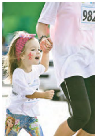
Самые маленькие бегуны...