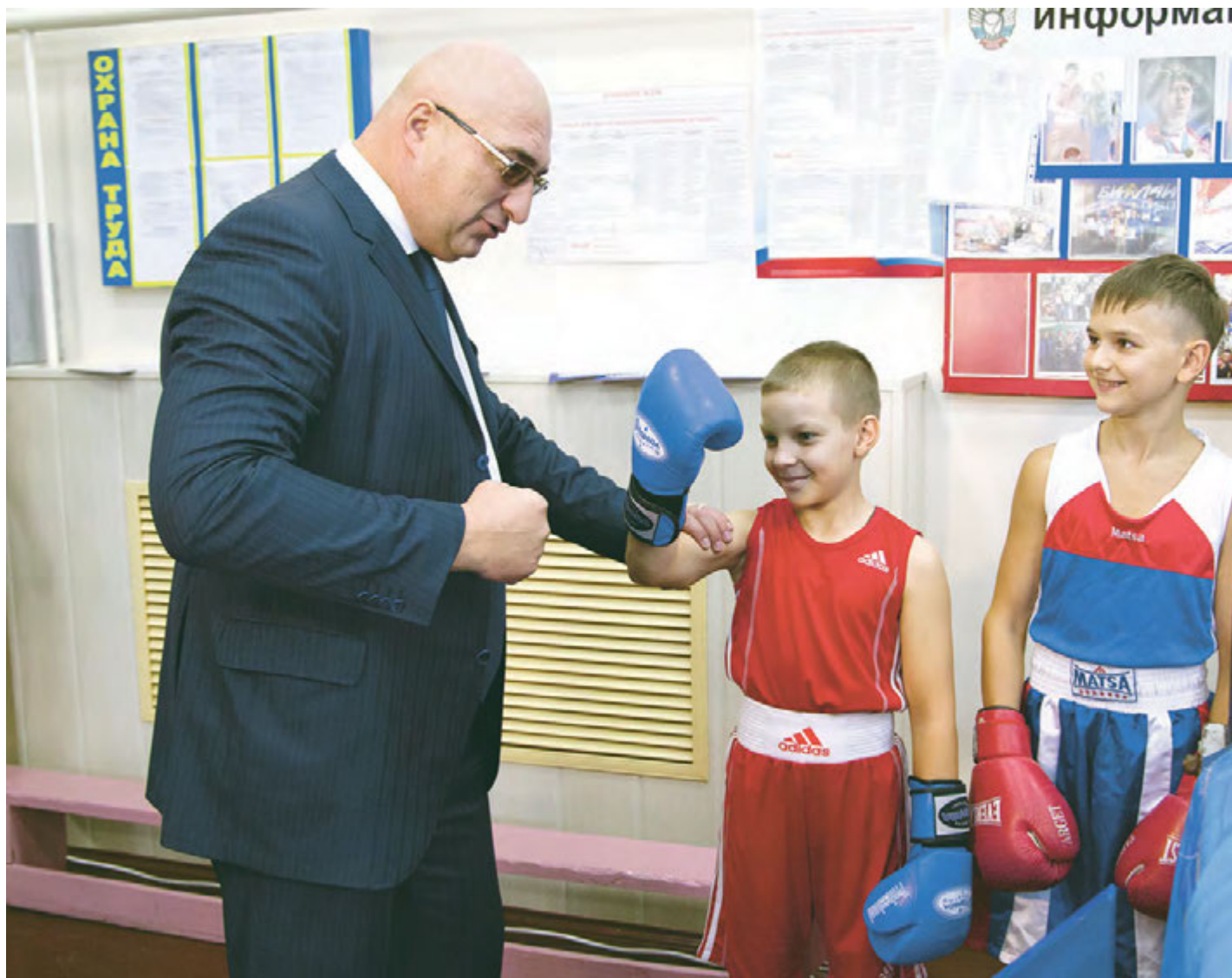
Каждый мальчишка мечтает быть сильным

После капитальной реконструкции на средства компании «Металлоинвест» в Железнодорожном открылся зал бокса СДЮСШОР Единоборств.