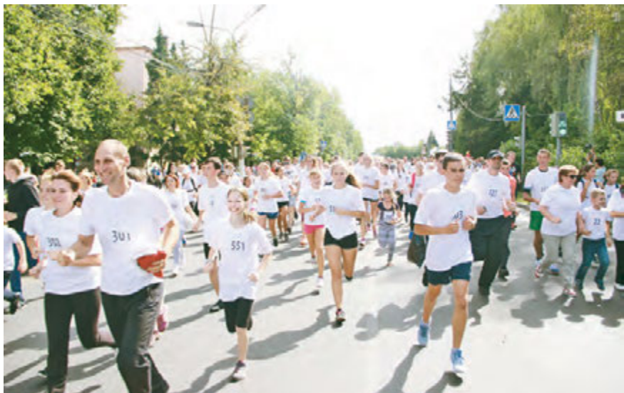
Дружная команда железнгорцев - на празднике спорта и хорошего настроения