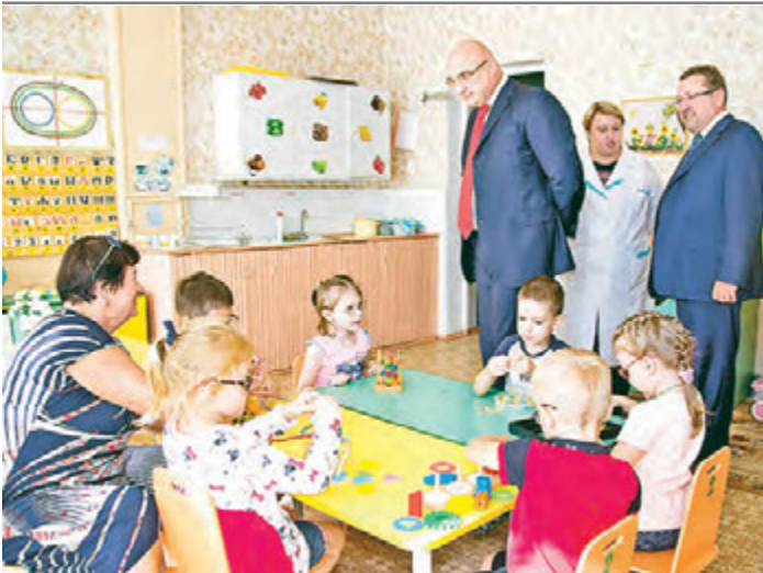
Работа с мелкими предметами - важная часть коррекции зрения у детей.

неоднократный рекордсмен мира в прыжках в длину, двукратный бронзовый призёр Олимпийских игр Игорь Тер-Ованесян. Повезло юным железнодорожским атлетам: не каждый день тебя готовит к старту настоящая легенда спорта! (Окончание на 16-й стр.)