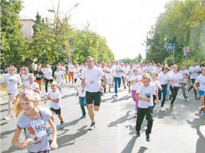
По центральной улице пробежало 1,5 тысячи горожан

массовый спортивный праздник. В 10.00 к стойке регистрации приходится протискиваться сквозь ряды желающих принять участие в забеге. Казалось бы, откуда взялось столько народу ясным и солнечным утром воскресного дня? В выходной день, в самый разгар сбора урожая на приусадебных участках? И это при том, что около 700 участников зарегистрировались предварительно, через социальные сети или в эфире информационного партнера праздника – радио «Железо ФМ». Как выяснилось, количество сторонников физкультуры и здорового образа жизни в нашем городе гораздо больше, чем ожидали организаторы. По словам главы города Виктора Солнцева, открывавшего