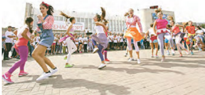
Праздник спорта завершился зажигательными танцами ансамбля «Фреш»

Дмитрий Голоцуков