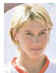
Екатерина Волкова Чемпионка мира '07, Олимпийская «бронза» '08