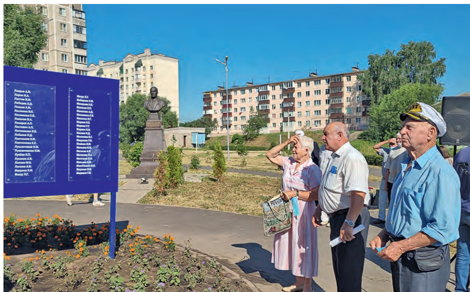
▲ Фамилии 276 горняков-первопроходцев увековечены на памятной доске