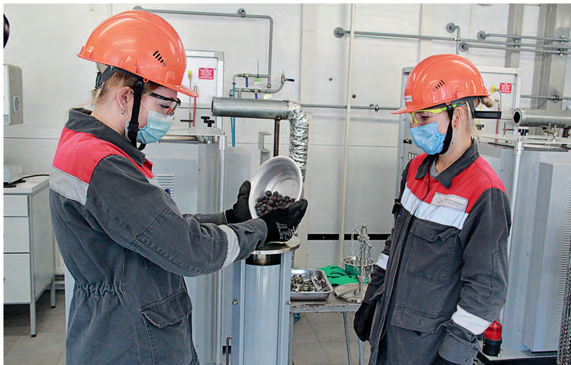
▲ Для исследований лабораторию оснастили современной высокоточной аппаратурой

на процесс получения окатышей с необходимыми нашему потребителю металлургическими свойствами.