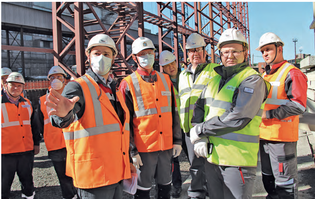
▲ Руководители Металлоинвеста и Михайловского ГОКа ознакомили губернатора Курской области Романа Старовойта с ходом строительных работ на новом производственном объекте комбината

Запуск корпуса дообогащения концентрата запланирован на 2022 год. Этот промышленный объект имеет стратегическое значение для Металлоинвеста и всей горнорудной отрасли страны. Новая технология позволит комбинату повысить содержание железа в концентрате до 70 %, а диоксида кремния снизить до 2,6 %.