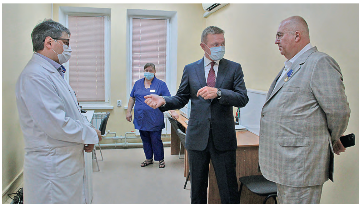
▲ Благодаря Металлоинвесту в Железнодорожском созданы условия для своевременной качественной диагностики и лечения онкологических заболеваний.

После капремонта, выполненного из средств Металлоинвеста в рамках трёхстороннего соглашения о партнёрстве с муниципальными и региональными властями, в Центре амбулаторной онкологической помощи стало ощутимо комфортнее.