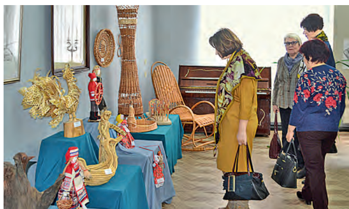
Работы мастеров и мастериц из Железногорска привлекли к себе особенно много внимания.