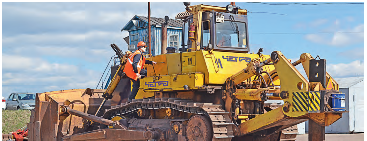
Ремонт бульдозера - одно из заданий конкурса.