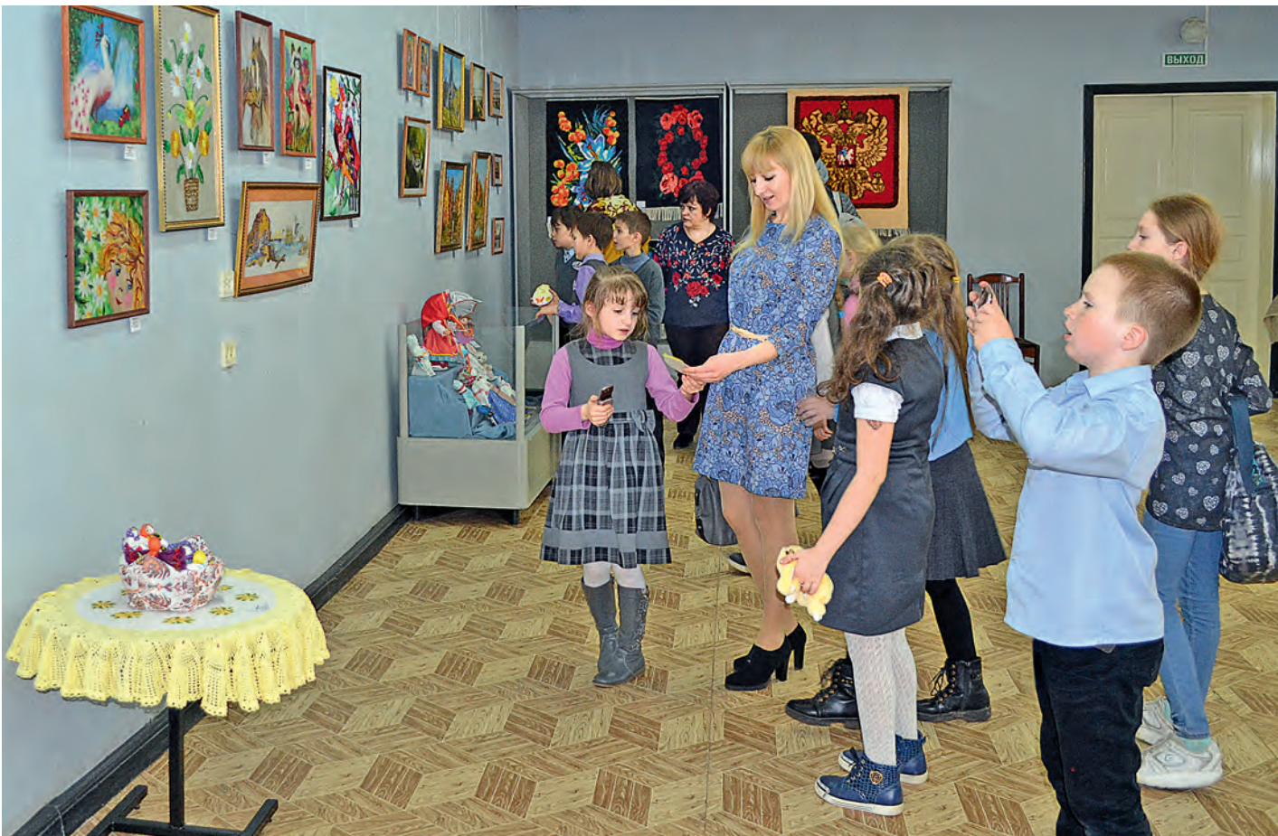
Больше всего экспонаты «Истоков - 2017» понравились детям.

В железнодорожном краеведческом музее открылась зональная выставка декоративно-прикладного творчества «Истоки – 2017», в экспозиции которой собраны шедевры ручной работы со всей Курской области.