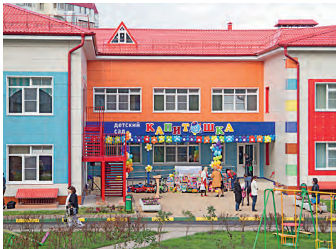
В 2016 году в рамках Соглашения о социально-экономическом партнёрстве в Железнодорожском районе открыт новый детский сад.

Программа социального партнёрства расширяется с каждым годом, и в 2017 г. совместная работа участников Соглашения продолжится по всем основным направлениям. Новыми шагами станут строительство школы в 13 микрорайоне, реконструкция городского парка и стадиона «Горняк», устройство системы водоотведения воскресной школы Всесвятского храма, ремонт автомобильных дорог. Кроме того, будут выделены средства на обновление материальной базы профессиональных колледжей, детских садов Железнодорожского района. Особое место займёт программа поддержки городских больниц. Актуальными для нашего региона социальные корпоративные программы компании «Сделаем вместе!», «Женское здоровье», «Здоровый ребёнок», «Наши чемпионы», «Наша смена» будут развиваться и дальше. Стороны отметили, что программа 2016 года выполнена в полном объёме. На выполнение мероприятий в рамках Программы социального партнёрства, с учётом вклада всех сторон, направлено около 1,1 млрд рублей. Из них 700 млн — вклад компании. Результаты трёхстороннего сотрудничества впечатляют — социальная сфера Железнодорожского района