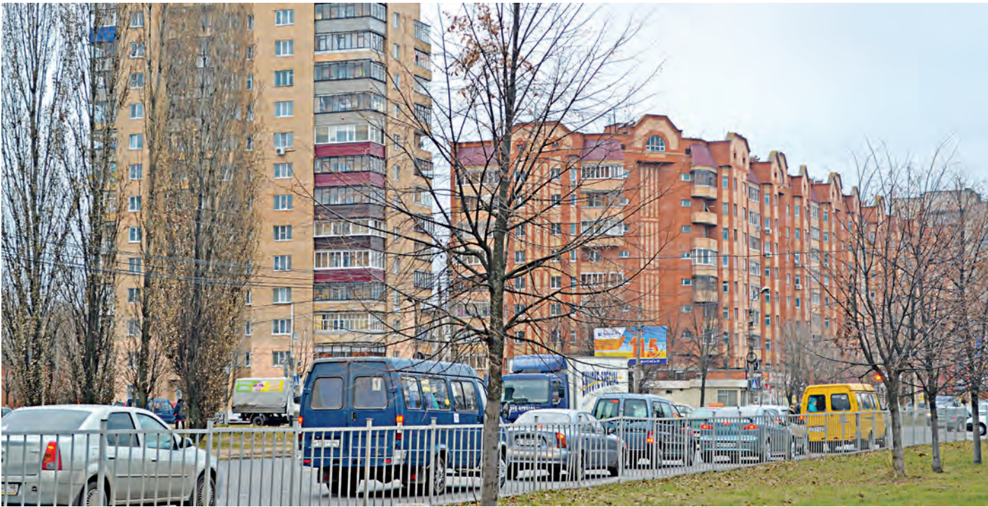
В этом году благоустройству Железногорска будет уделено особое внимание.