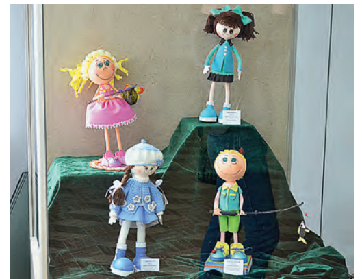
Интерьерные куклы - авторские произведения из Поньровского района.