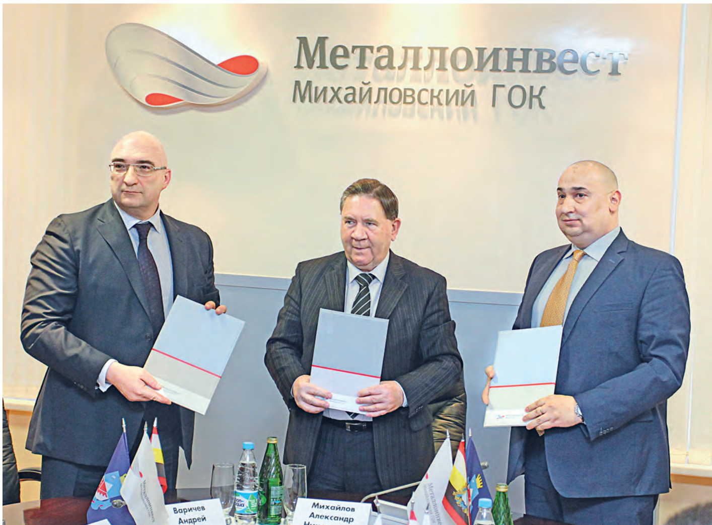
Трёхстороннее Соглашение о социально-экономическом партнёрстве - мощный фундамент для развития Железногорска и Курской области.

Компания «Металлоинвест» подписала Программу социально-экономического партнёрства на 2017 год с администрациями Курской области и города Железногорска.