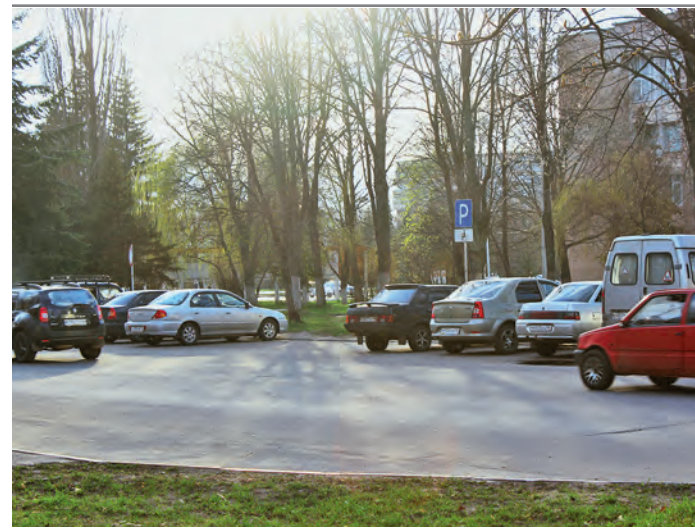
Парковку возле городской администрации освободят для жителей города.

Редакцию газеты «Курская руда» обратились жители домов № 31/1, 31/2 по улице Гагарина. Они жаловались на то, что при известном дефиците парковочных мест в нашем городе значительная часть парковки на улице Гагарина (со стороны администрации города) отдаётся под стоянку такси, а въезд