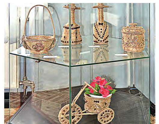
Изделия из джута - нежные, красивые, очень интересные.