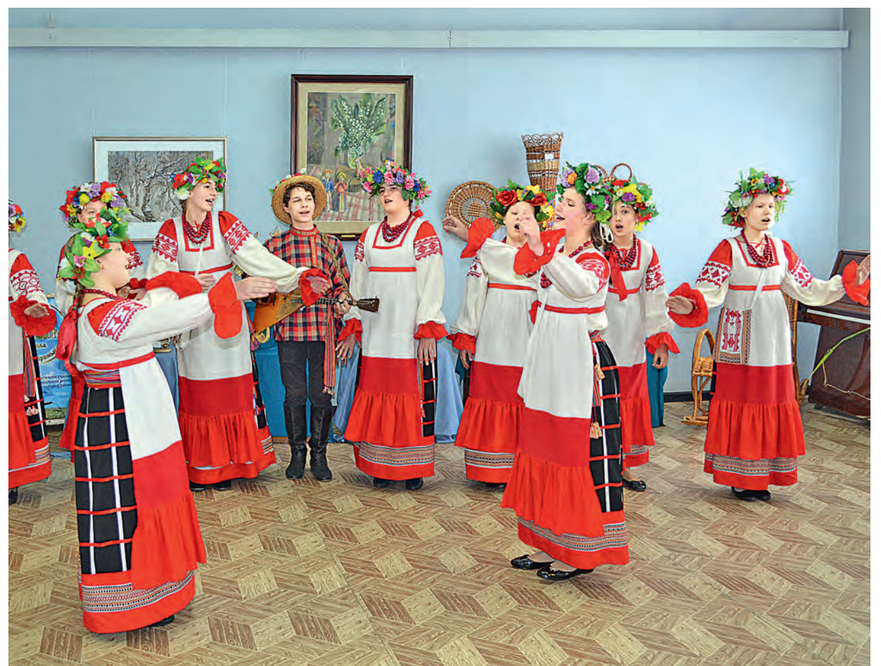
Одной из жемчужин открытия выставки стало выступление детского фольклорного ансамбля «Лапоточки», ребята которого исполнили для посетителей музея весёлые народные песни.