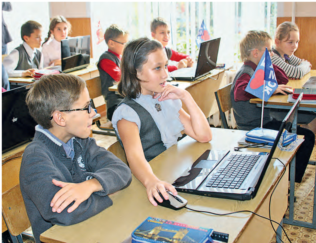
Железнодорожцы завоевали 36 призовых мест на региональном этапе всероссийской олимпиады школьников.

— Сумма областной субвенции на приобретение учебников в этом году составила более 9,5