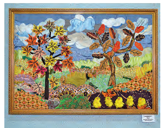
Лоскутный пейзаж, выполненный мастерицей Фатежского района.

В ней приняли участие мастера из нашего города, а также районов Курской области: Фатежского, Золотухинского, Железногорского, Дмитриевского, Поньровского, Хомутовского.