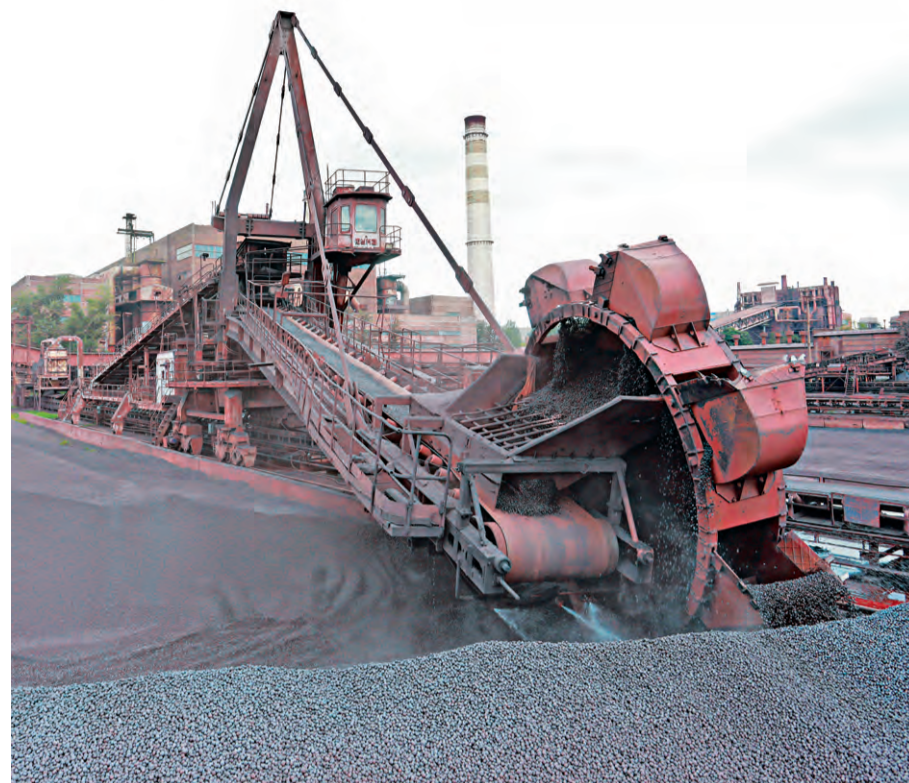
▲ Чтобы заменить такое колесо, ремонтники должны действовать слаженно и профессионально

— Электроаппаратура и схема управления машины морально устарели, — пояснил главный энергетик центра ТОиР