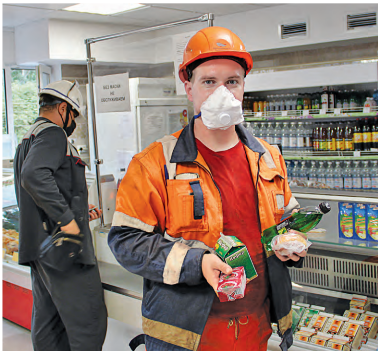
▲ В буфете можно полноценно позавтракать, заказать полуфабрикаты или получить спецпитание