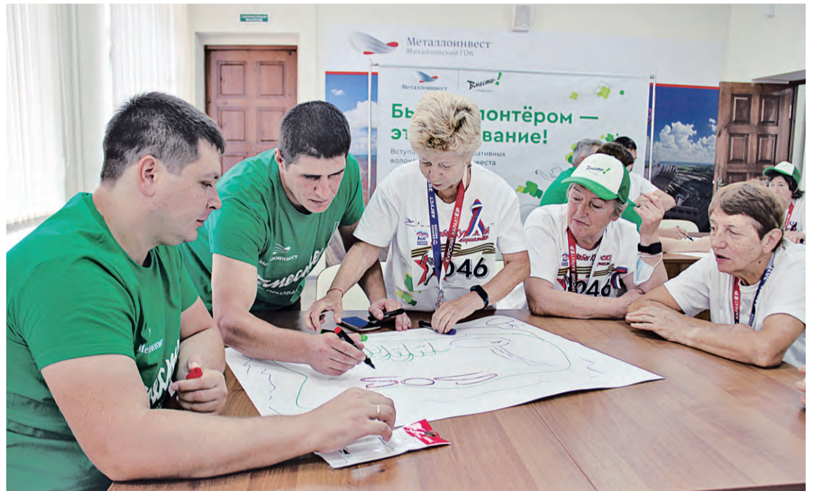
▲ Корпоративные и «серебряные» волонтеры Металлоинвеста пытаются «выжить» на необитаемом острове

— Позитивные эмоции очень важны для успешной реализа-