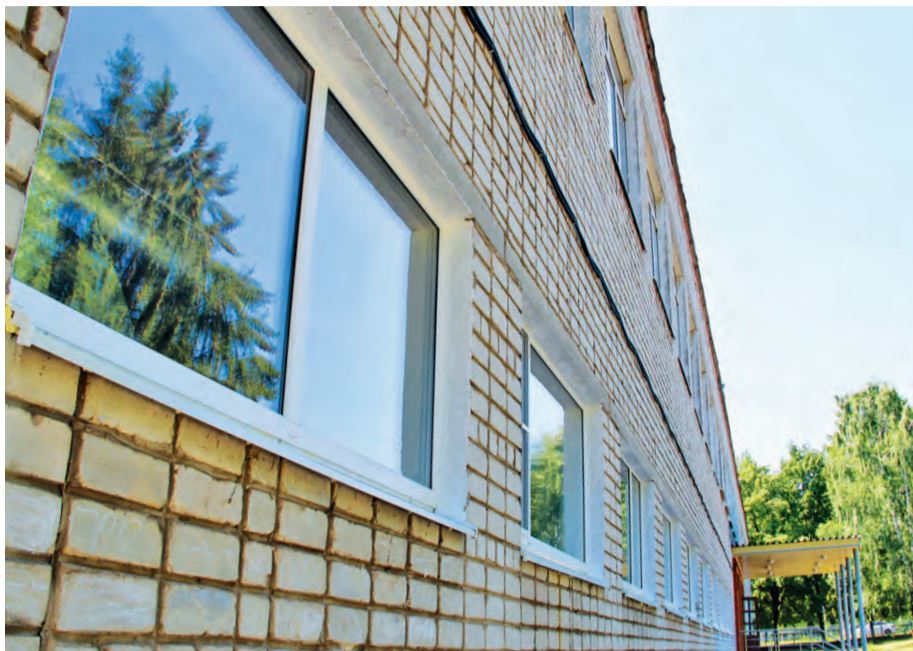
▲ Новые окна в школе №8 лучше сохраняют тепло в помещении, делают его комфортнее

Новый учебный год железногорские школы встречают во всеоружии: их отремонтировали и оснастили современным учебным оборудованием.