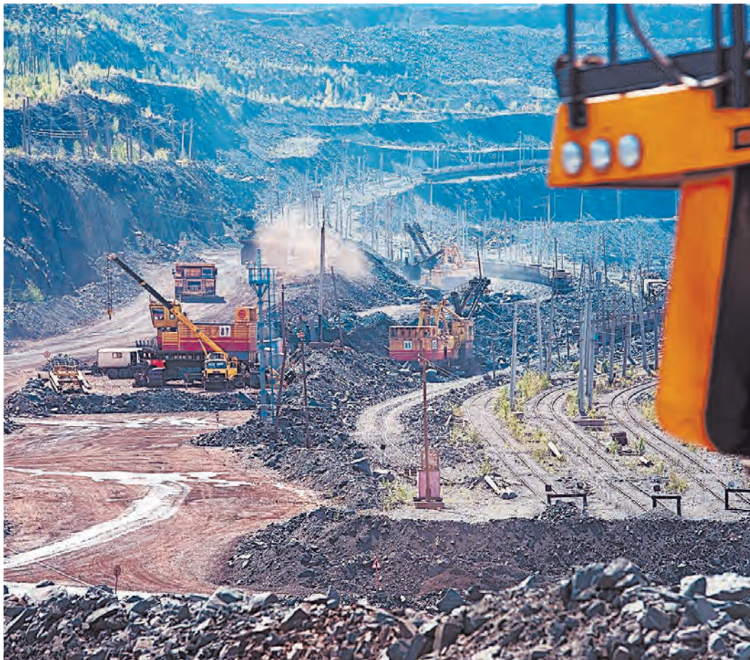
В карьере МГОКа кипит работа

На дробильно-обогательном комплексе за прошедшие шесть месяцев мы завершили цикл экспериментальных работ по обогащению окисленных железистых кварцитов. Что касается 14-й секции ДОК, где проводился эксперимент, то далее в этом году она будет работать в своем обычном технологическом цикле. Соответственно, нагрузка на передел дробления и обогащения неокисленных кварцитов увеличивается, по сравнению с первым полугодием. На перевозках придется потрудиться и автомобилистам с железнодорожниками.