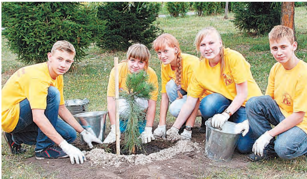
Активисты ШПД проводят акции по благоустройству родного города

? Эта неделя была ознаменована прекрасным праздником – Днем семьи, любви и верности. Мы спросили у горожан – в чем, по их мнению, секрет дружной, любящей семьи.