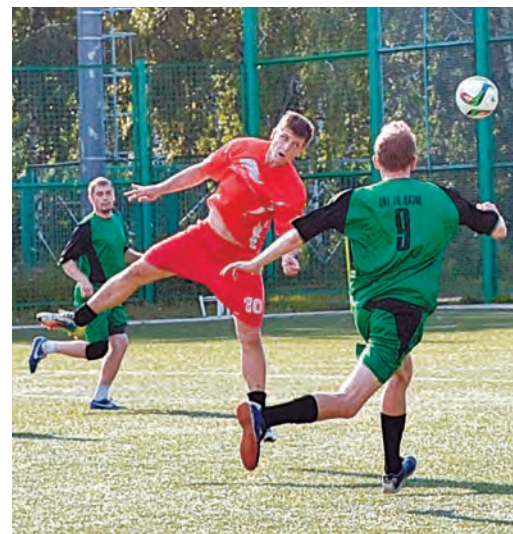
В начале игры ЦИТ-ЭЦ держались достойными соперниками РУ

Солнце светило так ярко, что буквально ослепляло всех. Но даже оно не смогло помешать интересной игре