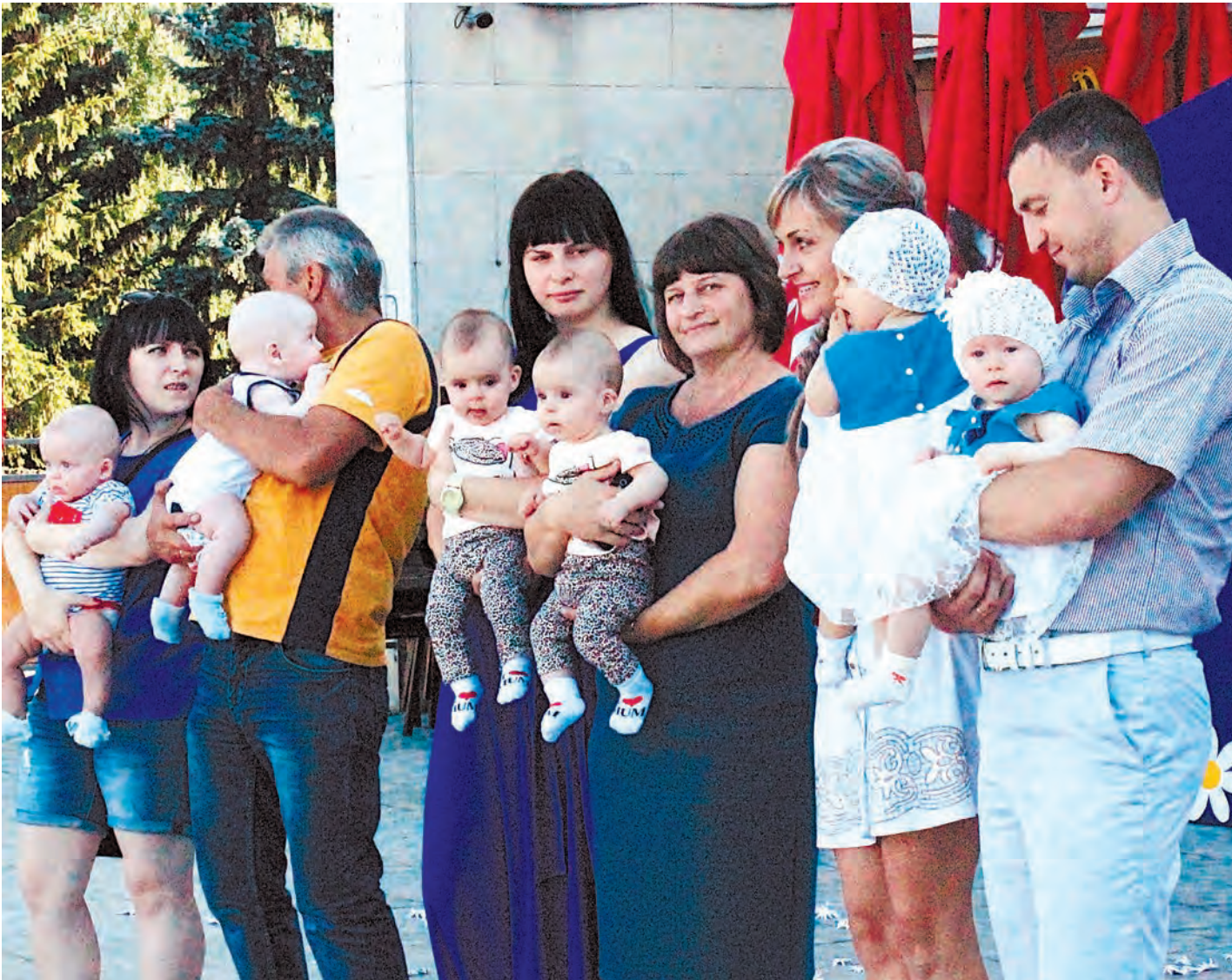
Счастливые семьи с двойняшками получали поздравления и подарки от администрации города

8 июля Железногорск, наряду со всей страной, отметил День семьи, любви и верности - на главной площади поздравили образцовые семьи города.