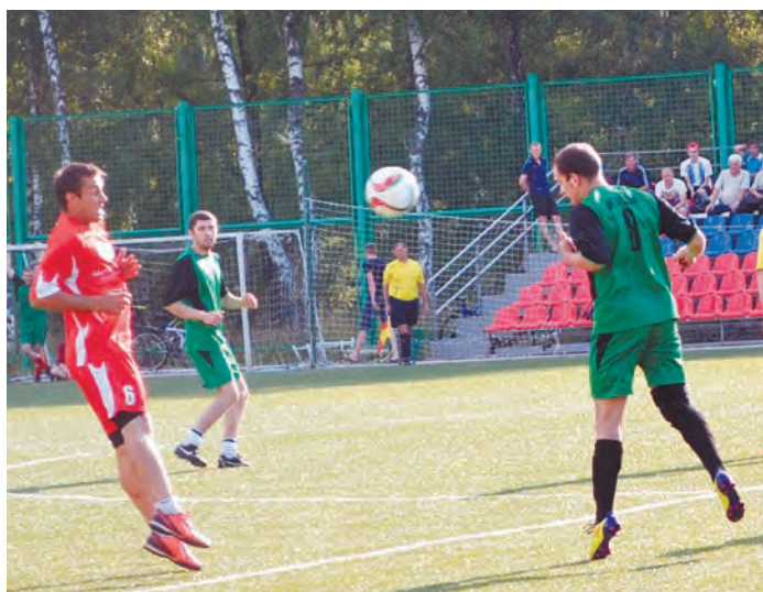
В первом тайме мяч то и дело перелетал с одной половины поля на другую

третье место по результатам всей спартакиады. Бывает, что молодая, слабая, на первый взгляд, команда, буквально вырывает из рук победу у сильных и опытных. Уверен, в этом году мы тоже увидим много интересного.