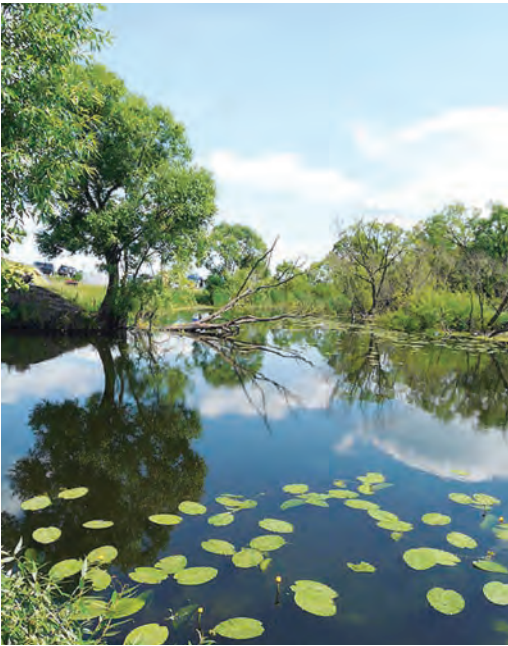
Река Сейм, Курская область

Замеры выполнены Центром санитарно-промышленного контроля ЦТЛ ОАО «Михайловский ГОК» (аттестат аккредитации № РОСС RU.0001.513916).