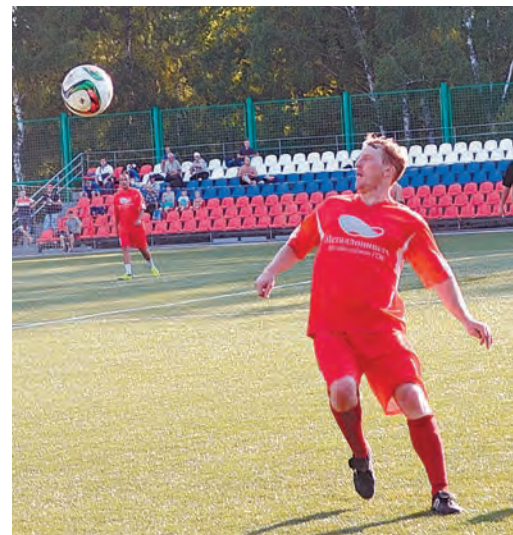
Команда горняков – один из фаворитов чемпионата