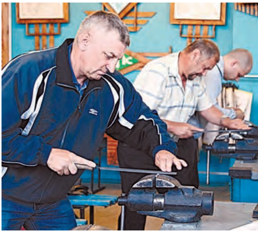
Все участники делали натяжной винт ножовки по металлу

За окном жарко, в мастерской Железнодорожного политехнического колледжа, профильного учебного заведения Михайловского ГОКа – тоже, поэтому, чтобы не терять время и силы, решено было сразу приступить