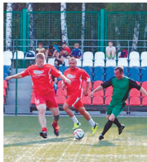
В этот раз победу одержали футболисты РУ