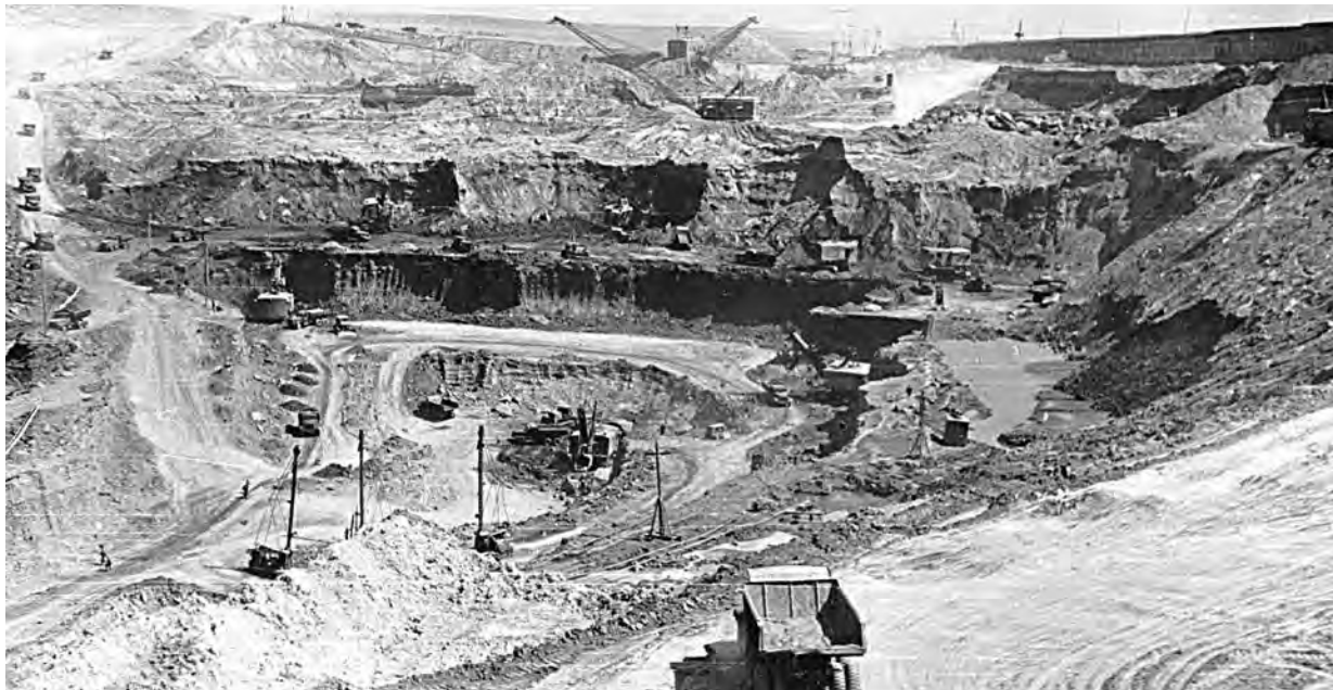
Бежит вереница машин, грохочут, вертят стрелами горные экскаваторы... Этот ударный темп строительства карьера на Михайловском месторождении задали первопроходцы - большие труженики и патриоты