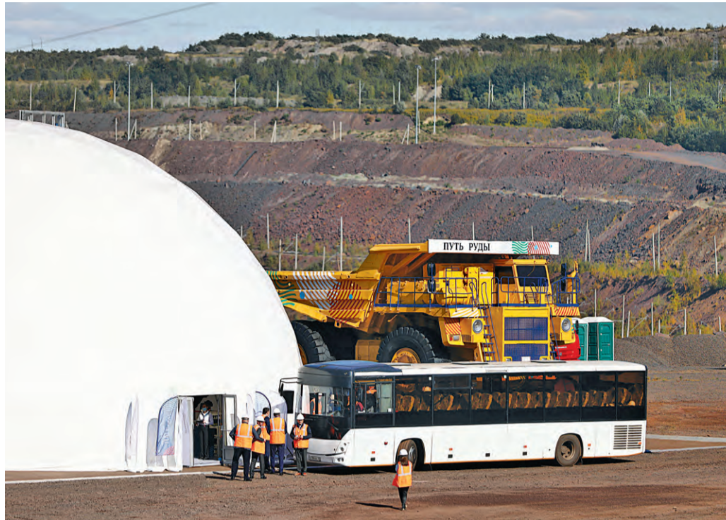
▲ В этом году Михайловский ГОК готов принять первых туристов

На Михайловском ГОКе стартовал проект по промышленному туризму. Какие подразделения комбината участвовали в его реализации?