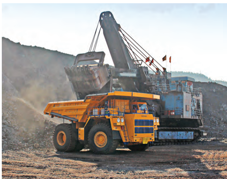
▲ Новая машина работает в паре с самыми производительными экскаваторами

Если, к примеру, Кострома — это сыр, Гжель — роспись по керамике, то белорусский город Жодино — это БелАЗы. Большегрузные самосвалы составляют костяк технического парка автотракторного управления Михайловского ГОКа. Но 240-тонник выделяется своими габаритами даже на фоне своих менее грузоподъёмных «земляков»: почти семь метров в высоту, чуть более шести — в ширину и девять — в длину. По сути, он выглядит как вместительный жилой дом на огромных колёсах. А под капотом у него — две с половиной тысячи лошадиных сил. Машину отличают не толь-