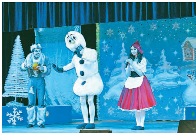
Снеговик тоже присоединился к поискам музыкальной палочки