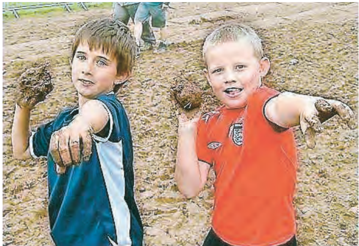
Давай в снежки! Новый год же!..

26 ДЕКАБРЯ 16.00 Открытое Зимнее первенство города Железногорска по плаванию «Новогодние старты» по итогам года.