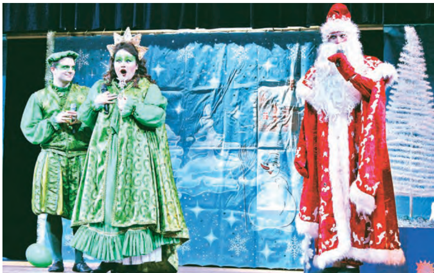
Как и положено, Дед Мороз смог убедить Жабу вернуть музыкальную палочку

Для ребят из детских домов Курской области Новый год наступил немного раньше календарного. Благотворительный фонд «Искусство, наука и спорт» организовал для них настоящий новогодний праздник.