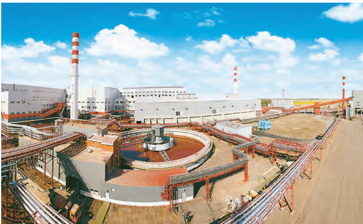
Пуск нового высокотехнологичного комплекса обжиговой машины №3 – ключевое событие года

На Уральской Стали в конце 2017 года планируется сооружение комплекса роликовой термической печи и роликовой закалочной машины в ЛПЦ-1. Что позволит сохранить позиции компании на рынке термообработанного ме-