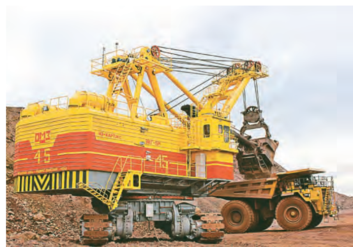
Новый 15-кубовый экскаватор в работе

сравнению с прошлым годом около 1 млрд руб. и превысил 6 млрд рублей. Мы завершили взятые обязательства по строительству и капитальному ремонту социально важных объектов в городах присутствия. В их числе – Ледовый дворец, городская больница № 1, школа № 15, детский сад №16 в Новотроицке. Дорожное строительство – в Старом Осколе. Только на внешние социальные программы, способствующие устойчивому развитию регионов присутствия компании, Металлоинвест выделил в 2015 году более 3,7 млрд руб. Мы поддерживаем талантливых школьников, учителей, врачей, работников культуры и спорта. Реализуем целый ряд корпоративных благотворительных программ, в числе которых «Наша смена», «Наши чемпионы», «Здоровый ребенок», «Школа полезного действия», «Женское здоровье», «Наши городские инициативы». Мы оказываем адресную