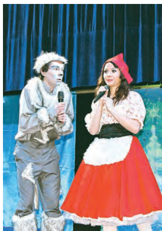
Как нам спасти праздник?