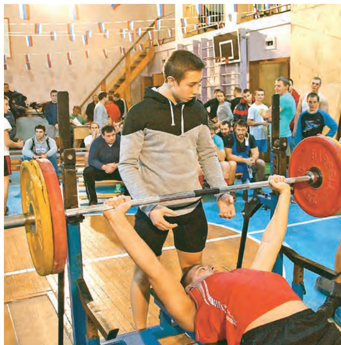
В тяжелой атлетике так важна поддержка друга!