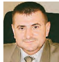
Александр Воронин председатель городской Думы:

Считаю, что надо оставить право на компенсации в прежнем размере. В стране поддерживают повышение рождаемости, вот продлили выплату материнского капитала. Но одновременно почему-то собираются урезать льготные «чернобыльские» выплаты.