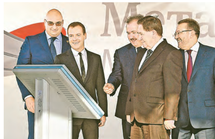
В запуске ОМ-3 принял участие премьер-министр РФ Дмитрий Медведев

В ноябре 2015 года в рамках III Российского промышленно-экологического форума «РосПром-Эко-2015» предприятие ОАО «Михайловский ГОК» награждено дипломом и медалью в номинации «Лучшее экологически ответственное предприятие Курской области в 2015 году». Запущенная на «Уральской стали» коксовая батарея №6, оснащена системой беспылевой выдачи кокса с улавливанием и очисткой пылегазовых выбросов. Этот проект по снижению нагрузки на окружающую среду завоевал первое место в XII Отраслевом конкурсе «Предприятие горно-металлургического