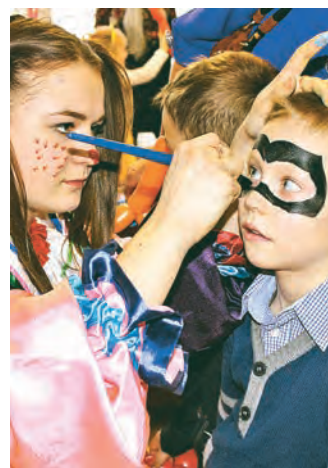
Аквагрим не терпит суеты