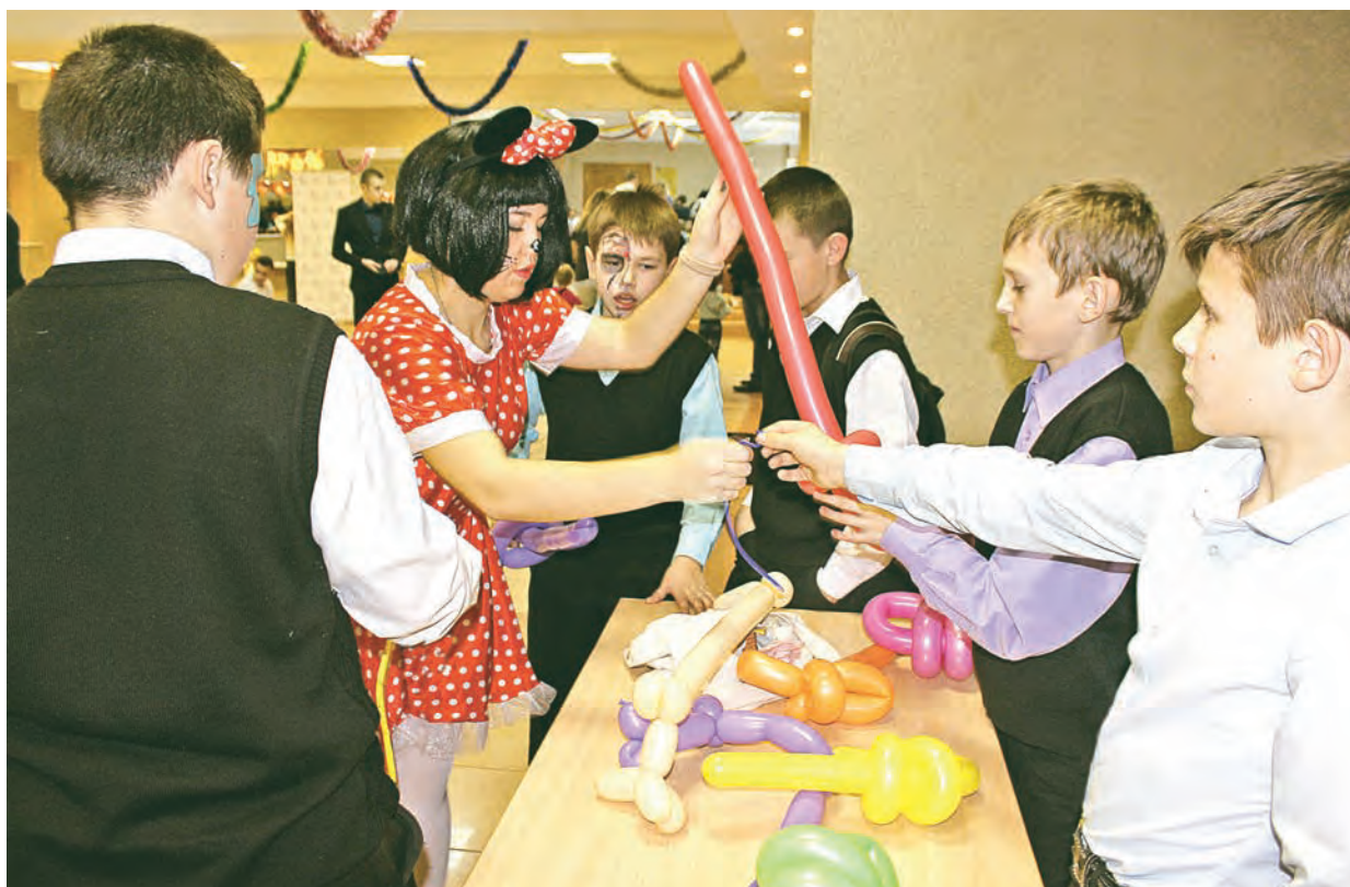
Обычные воздушные шары могут превращаться в забавных зверушек