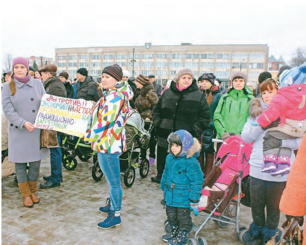
На митинг пришли молодые семьи с детьми

А 16 декабря по инициативе депутатского корпуса от Железнодорожска региональный парламент единогласно принял постановление об обращении к председателю Совета Федерации Валентине Матвиенко, председателю Государственной Думы Сергею Нарышкину