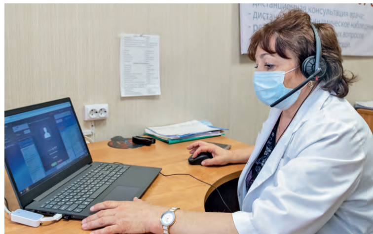
▲ В новогодние праздники специалисты Ситуационного центра МГОКа работали каждый день, отвечали на вопросы пациентов, оказывали им помощь и психологическую поддержку

— С 1-го по 10-е января 2021 года наши специалисты совершили 791 звонок пациентам, находящимся на амбулаторном лечении, — рассказывает главный