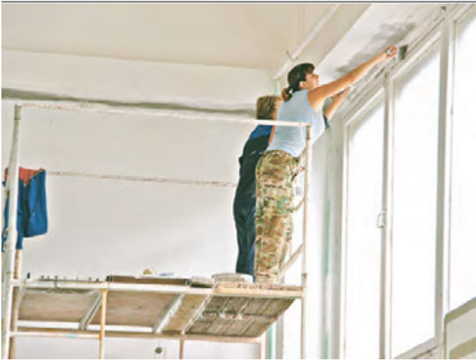
В школе №10 ремонтные работы подходят к концу