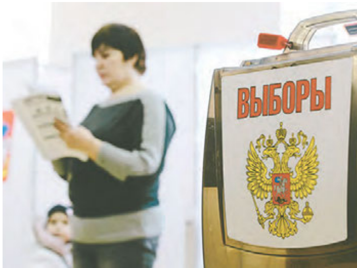
Выборы в Государственную Думу - уже через месяц