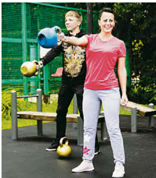
В гиревом спорте пробовали себя даже девушки