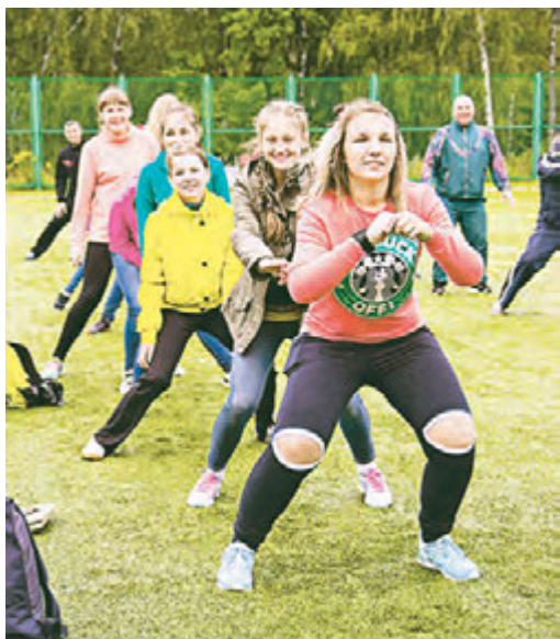
Упражнения на все группы мышц!

13 августа на стадионе «Горняк» состоялась общегородская зарядка, а также спортивные состязания и мастер-классы в честь Дня физкультурника.