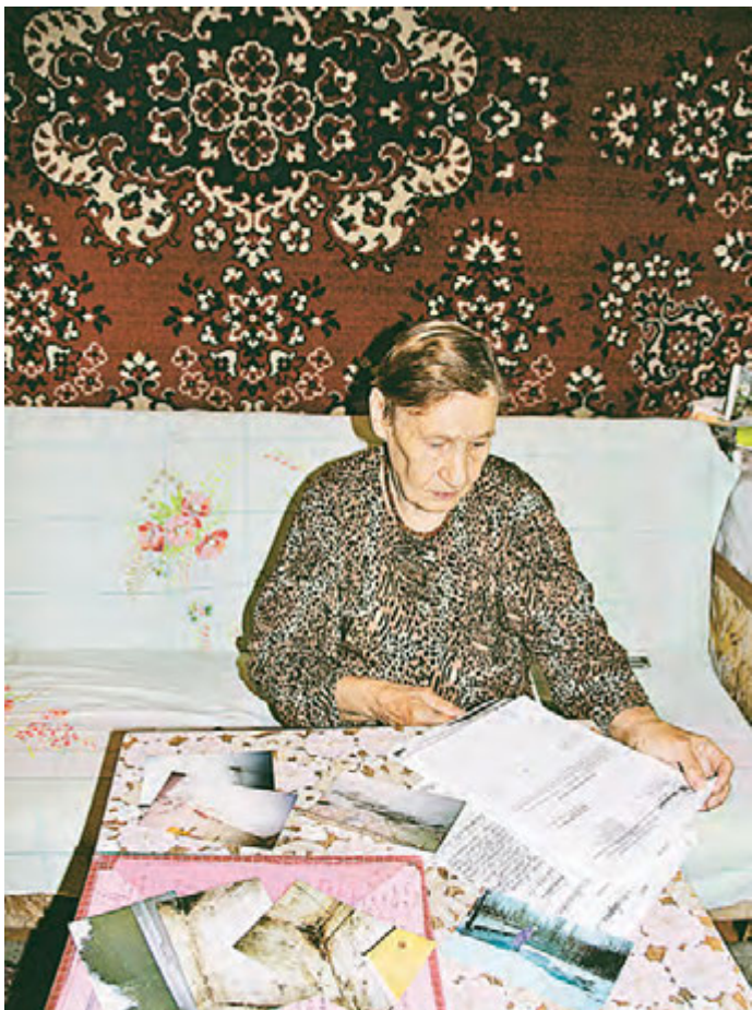
Актами и документами хоть сырые углы заклеивай... А ремонта все нет

И вот уже по второму кругу жильцы обращаются в УК. В 2010 году в доме произвели ещё один ремонт кровли... А спустя 5 лет - ещё один. Казалось бы, после третьего по