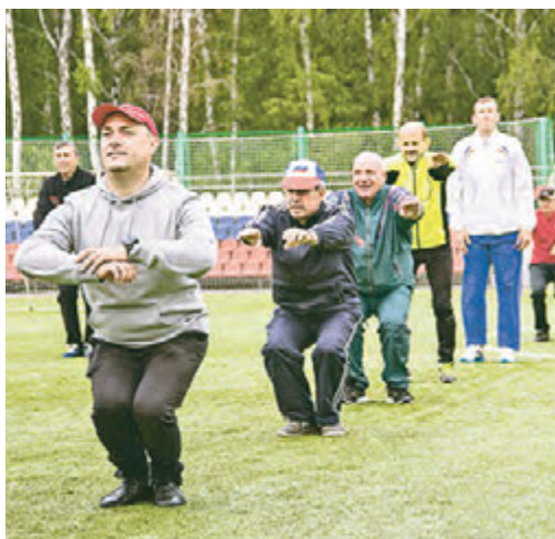
Движение - это жизнь!