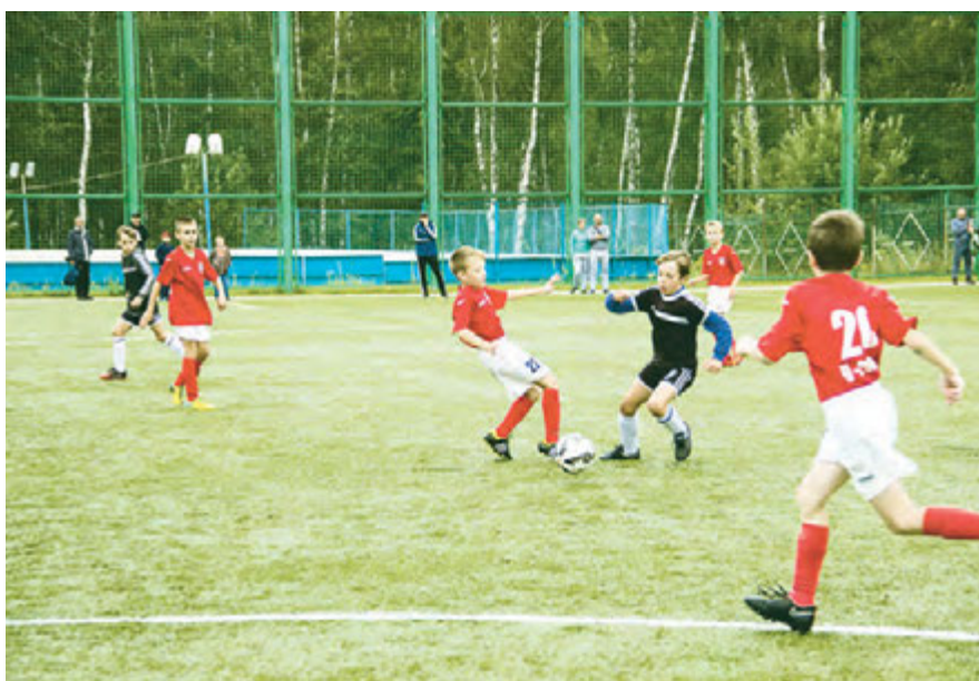
Юные железнгорцы очень любят футбол