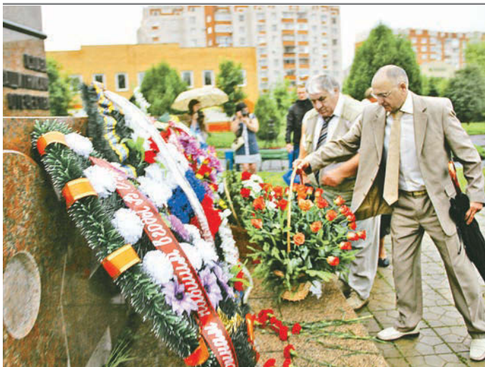
В митингах приняли участие и представители Михайловского ГОКа

Миллионы свечей и миллиарды красных гвоздик у мемориалов, мириады минут молчания... Всё это говорит о том, что мы – помним. Помним, как 75 лет назад, 22 июня на нашу страну напала фашистская Германия. Помним, сколько народа выкосила и какие неисчислимые