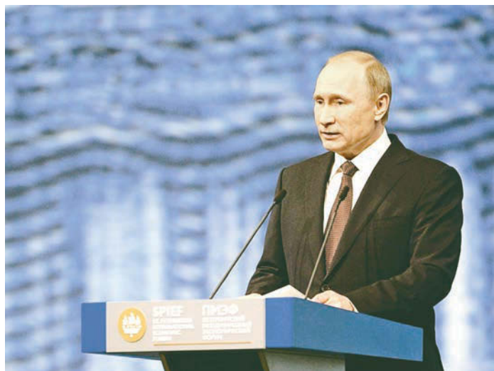
Владимир Путин объявил о проекте «Большая Евразия»

Россия смогла решить наиболее острые проблемы в экономике, рассчитывает на рост в ближайшей перспективе, также заявил Владимир Путин. – Мы сохранили резервы, существенно сократился отток капитала – по сравнению с первым кварталом 2015 года в