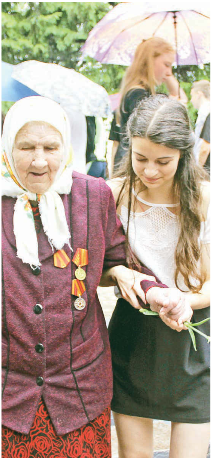
С чувством глубокой благодарности молодёжь помогала ветеранам

Этот день забыть невозможно. Этот день нужно помнить всегда... 75 лет назад началась самая кровопролитная война в истории нашей Родины. Она длилась 1418 дней, и только по официальным данным унесла почти 27 миллионов жизней.