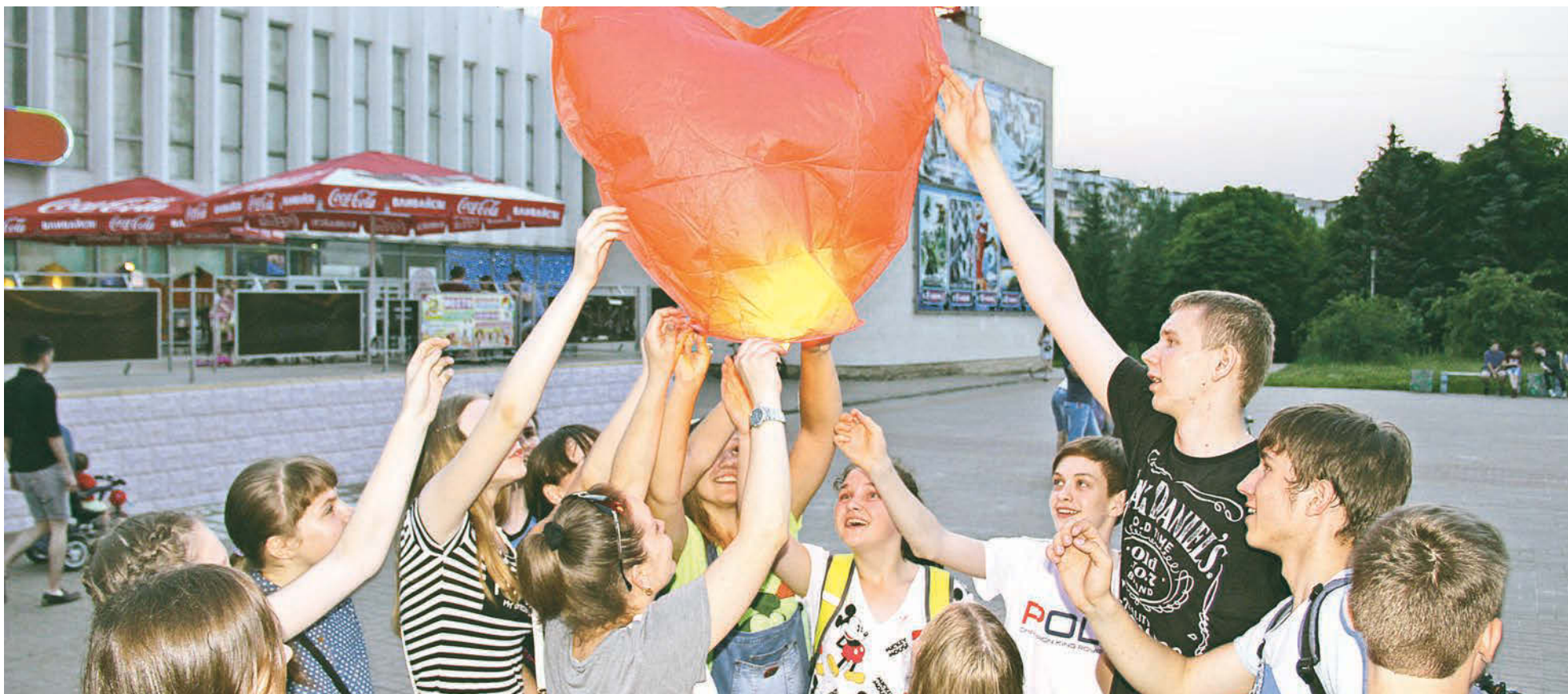
Отпуская в небо огненные фонарики, юные волейболисты загадывали лишь одно - чтобы на Земле всегда был мир и спокойствие