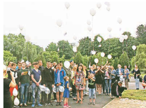
Молодёжь запустила в небо десятки белых шаров