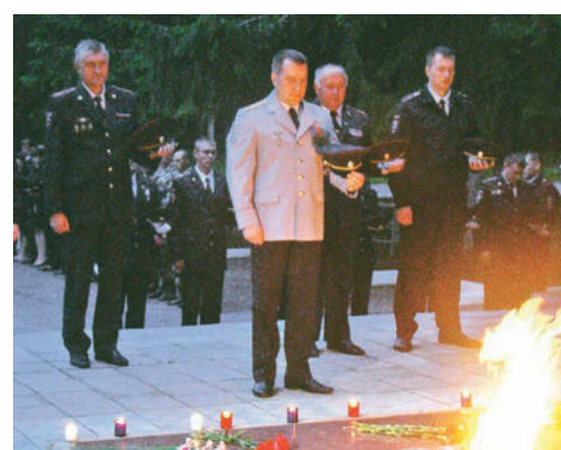
4:00 - полицейские зажгли свечи у Вечного огня