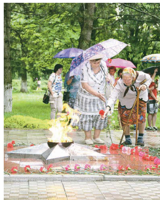
Ветераны возлагают цветы к Вечному огню