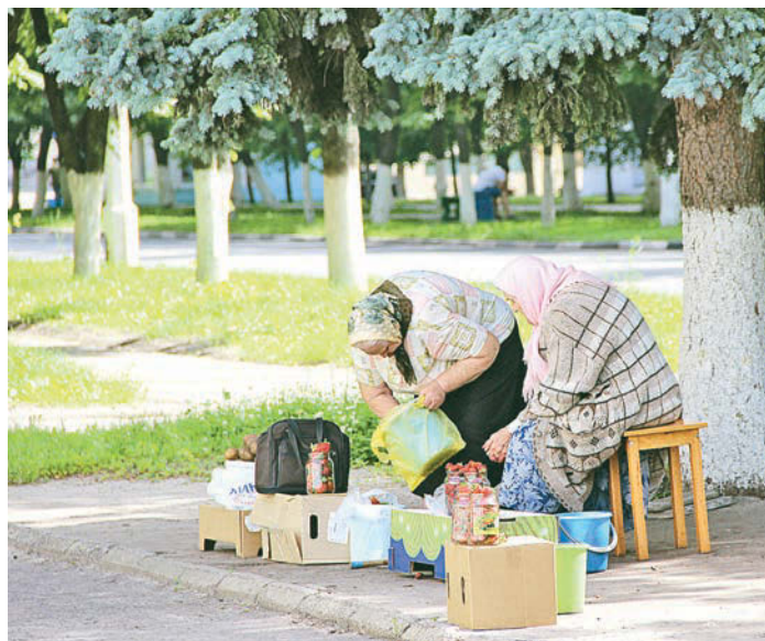
Стихийные точки торговли разворачиваются в течение нескольких минут

некачественными, а то и опасными для здоровья. А кроме клубники, уже повсеместно торгуют и земляникой в стаканчиках, и, что наиболее опасно - грибами, уличная продажа которых в принципе запрещена, поскольку риск пострадать от отравления грибами очень велик. Поэтому рейды продолжатся. Если вы хотите сообщить о месте незаконной торговли, звоните: 4-65-36 или 4-87-06.