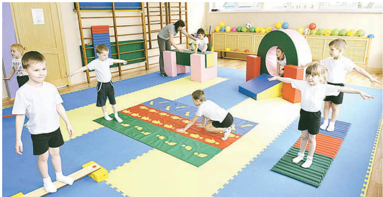
Дошкольники с большим удовольствием занимаются на спортивных комплексах, которые появились в их детских садах благодаря реализации программы «Здоровый ребенок»

В Железногорске подведены итоги работы в рамках программы Металлоинвеста «Здоровый ребёнок» и определены лучшие проекты, направленные на снижение детской заболеваемости. Гранты на реализацию соцпроектов получили 13 учреждений.