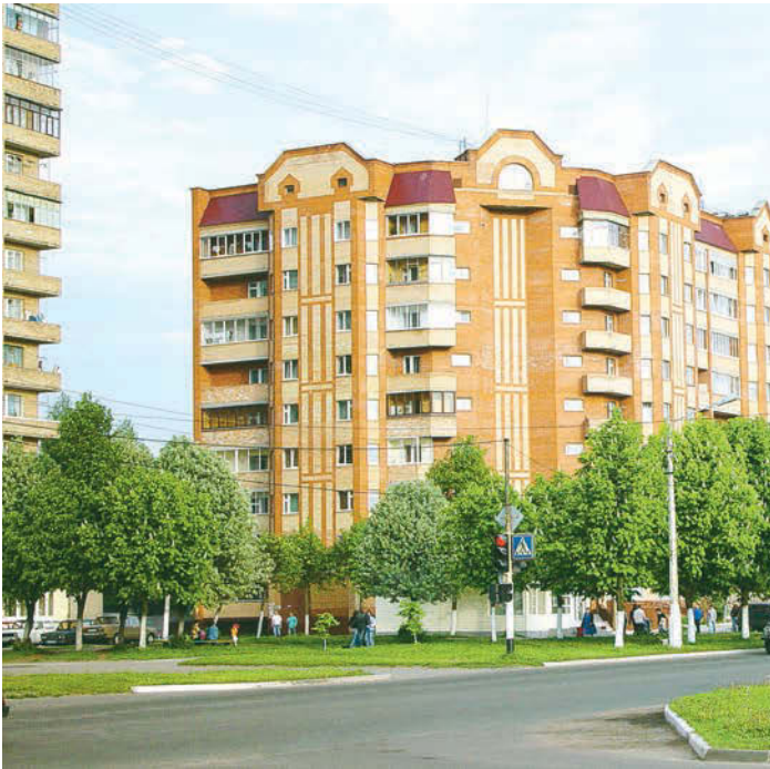
Железнодорожники по праву считаются одним из лучших малых городов

Выплата им будет начисляться с рождения. Порядок назначения и получения ежемесячных выплат за проживание в зоне с льготным социально-экономическим статусом определен Федеральным законом № 383-ФЗ, который вносит изменения в Закон РФ «О социальной защите граждан, подвергшихся воздействию радиации вследствие катастрофы на Чернобыльской АЭС».