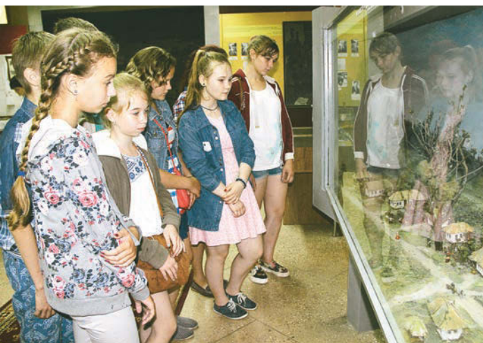
Учащиеся из Орловской области узнали о трагедии Большого дуба