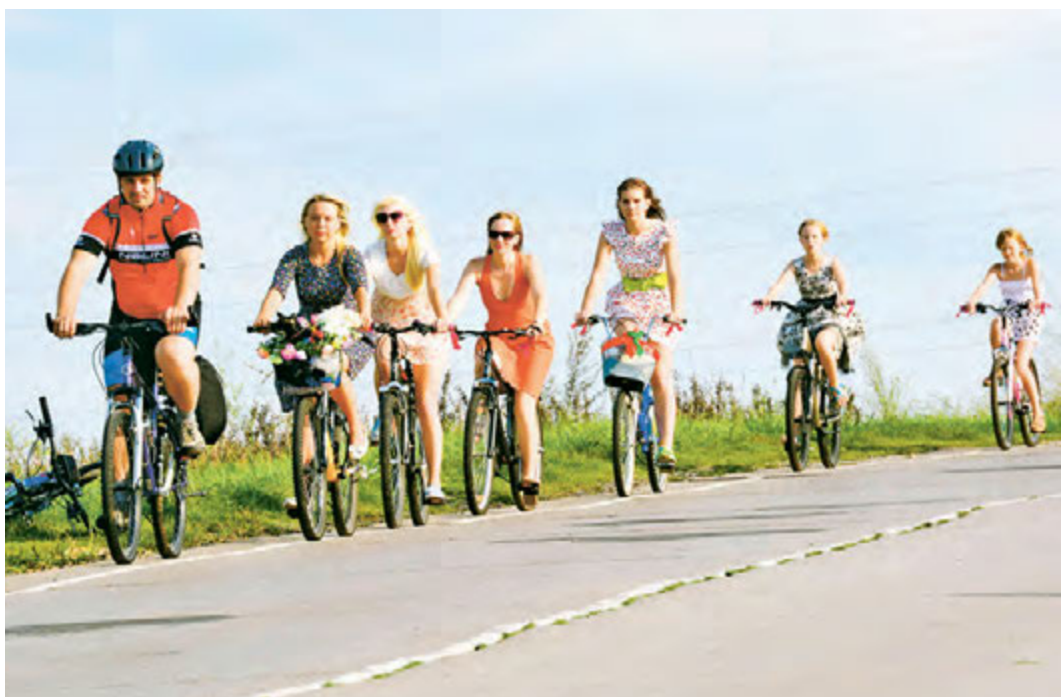
Главное на дороге – правила безопасности во время движения

Евгения Кулишова