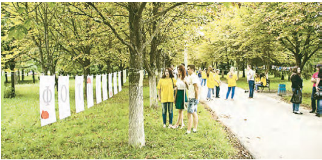
Не важно – любитель ты или профи – участником «Фотосушки» может быть каждый

При этом, главный принцип проекта – никаких жанровых и тематических ограничений. Именно поэтому каждый гость выставки сможет отыскать