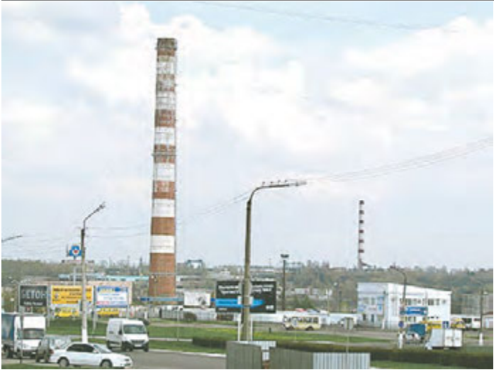
Коммунальщики города готовятся к зиме в штатном режиме

работ при строительстве Волго-Донского канала! Завершился митинг минутой молчания, которой почтили память павших в Курской битве и торжественным возложением алых гвоздик и венков к Вечному огню мемориала. Юлия Ханина фото автора