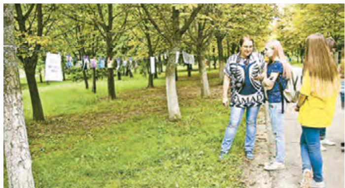
Гости выставки с интересом расспрашивали её авторов об идее снимков