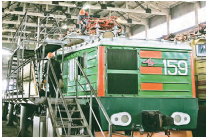
Совсем скоро этот новенький агрегат пополнит парк управления железнодорожного транспорта комбината

Оборудование было приобретено в рамках технического перевооружения и модернизации горно-транспортного комплекса компании. В Металлоинвесте этому уделяют особое внимание, ведь использовать на основных переездах ГТК оборудование с достаточным производственным ресурсом — значит, оставаться конкурентоспособным в условиях экономического кризиса. Монтаж нового локомотива, поступившего на Михайловский ГОК, осуществляло управление ремонтами технологического оборудования совместно с представителями завода-изготовителя. Механики, электрики, сборщики оборудования — монтировала «новичка» опытная бригада специалистов, состоящая из 15 человек. Как отмечают специалисты УЖДТ, новый электровоз выполнен с учетом всех эргономических требований, то есть отличается повышенной безопасностью и комфортностью. Например, кабина оборудования на современной системе кондиционирования и вентиляции, специальными креслами для машиниста и помощника. Не забыты и бытовые удобства — кабина оснащена холодильником и микроволновой