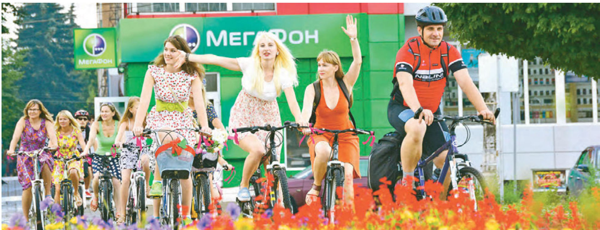
Многие прохожие в этот день обратили внимание на необычную кавалькаду велосипедисток в платьях

В Железнодорожске состоялся первый «Сарафанный велопробег».