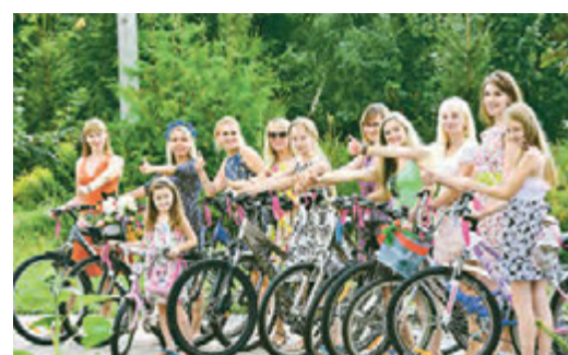
Девушкам велопробег очень понравился