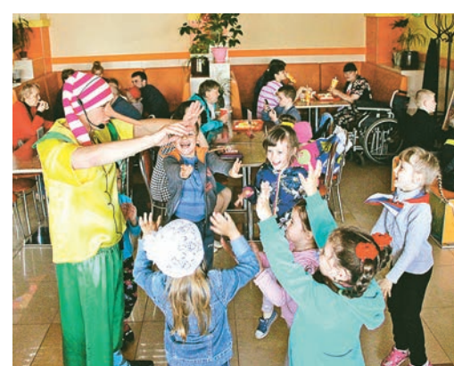
«У него названий много: триколор, трёхцветный стяг... Что же это? - РУССКИЙ ФЛАГ!»