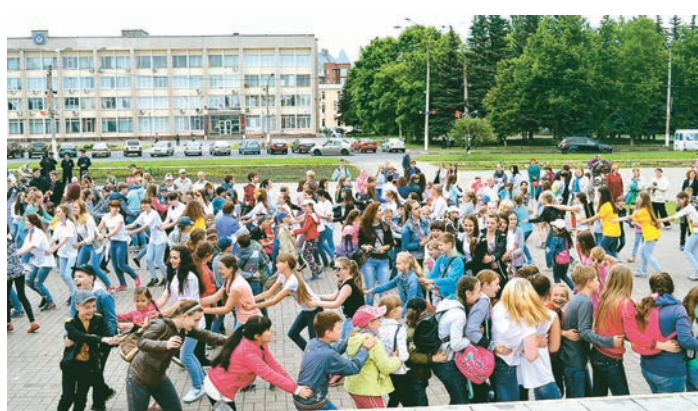
Огромная «змейка», хором напевая патриотические песни, быстро заполонила всю площадь перед киноцентром «Русь»