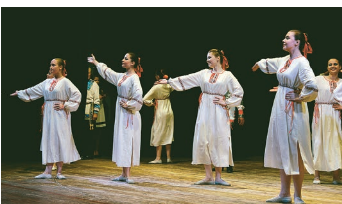
Девушки в традиционных славянских нарядах станцевали красивый русский народный танец