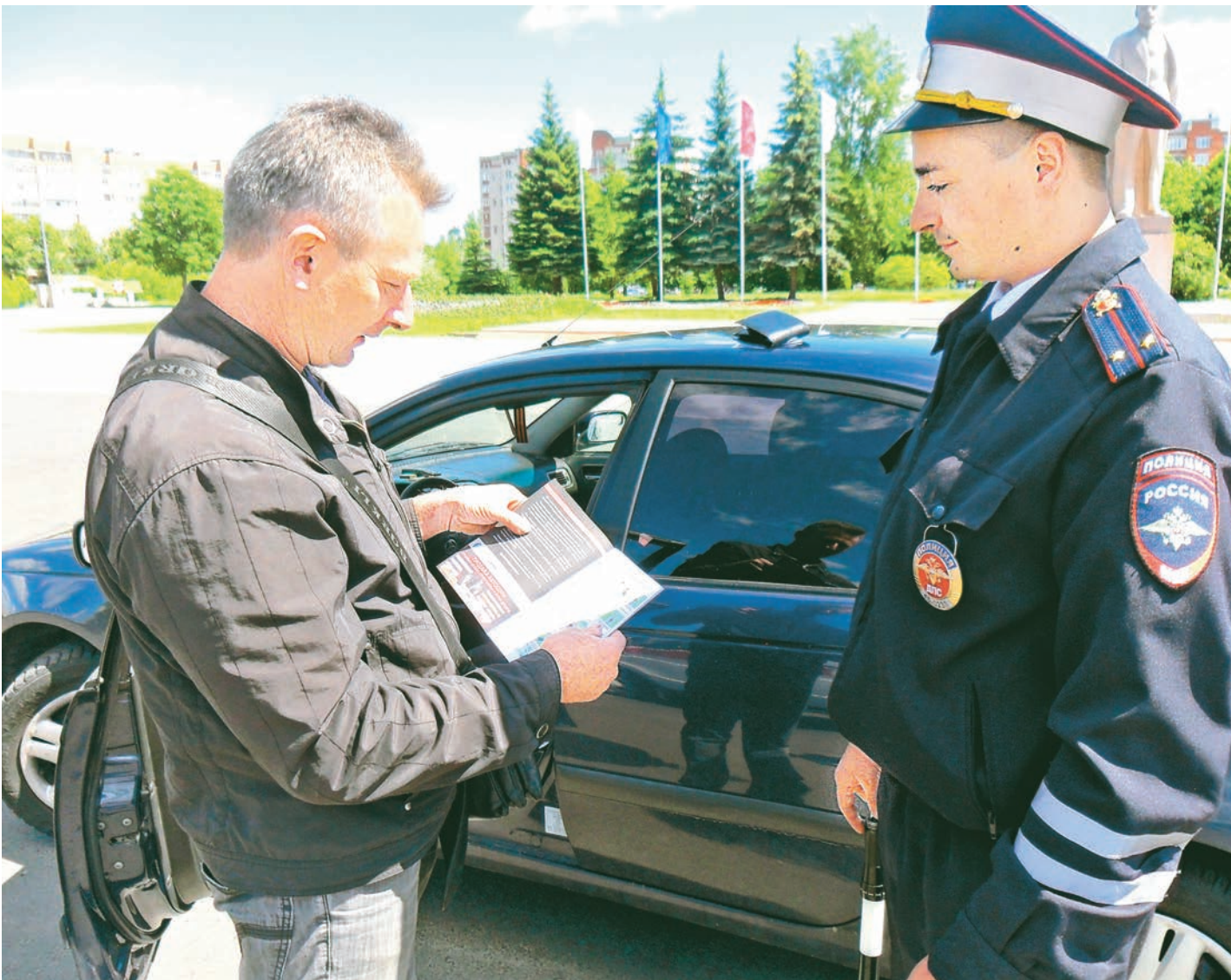
Сотрудники городского ГИБДД раздают водителям буклеты и памятки с выдержками из ПДД, а также изменениями законодательства в этой области

...и думай, где идёшь. Каждый день в Железнодорожнике регистрируется от двух до пяти случаев дорожно-транспортных происшествий. Это - вызов, особенно с наступлением каникул.