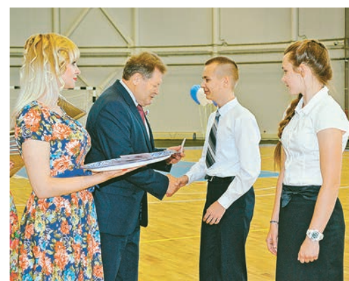
Кроме главного документа, ребятам подарили фотоальбомы и экземпляры Конституции РФ