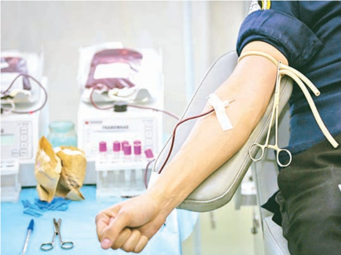
Доноры знают, что их кровь спасает жизни других людей

83 железнодорожника во Всемирный День донора пришли на пункт забора крови, чтобы сдать свою кровь для пациентов больницы. По сравнению с обычными днями, количество желающих поделиться своей кровью для спасения других жизней, превышало в семь-восемь раз. В Железнодорожск на День донора специально приезжала передвижная бригада медиков