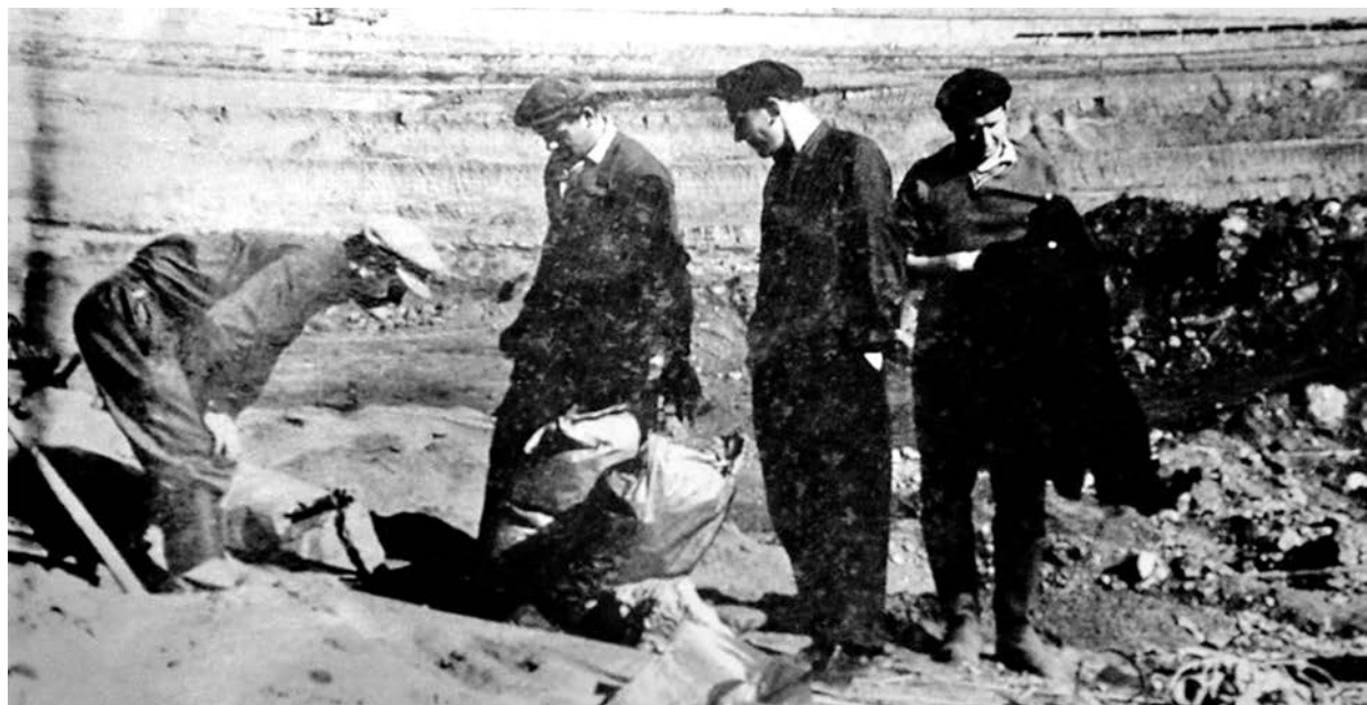
В 60-70-е взрывники работали вручную