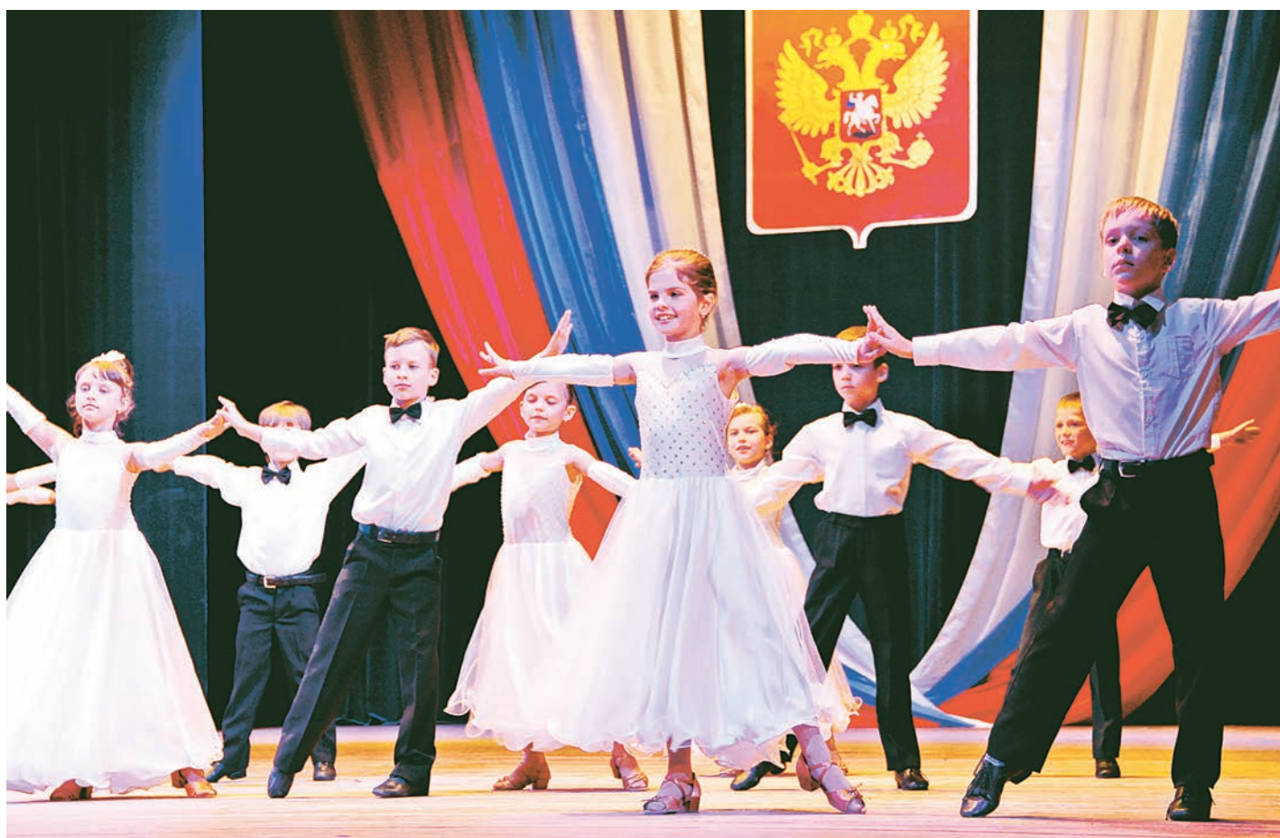
Юные танцоры «Грации» радовали зрителей своим головокружительным вальсом