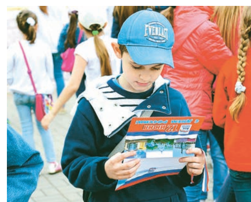
Малыши внимательно читали поздравления на подаренных им открытках