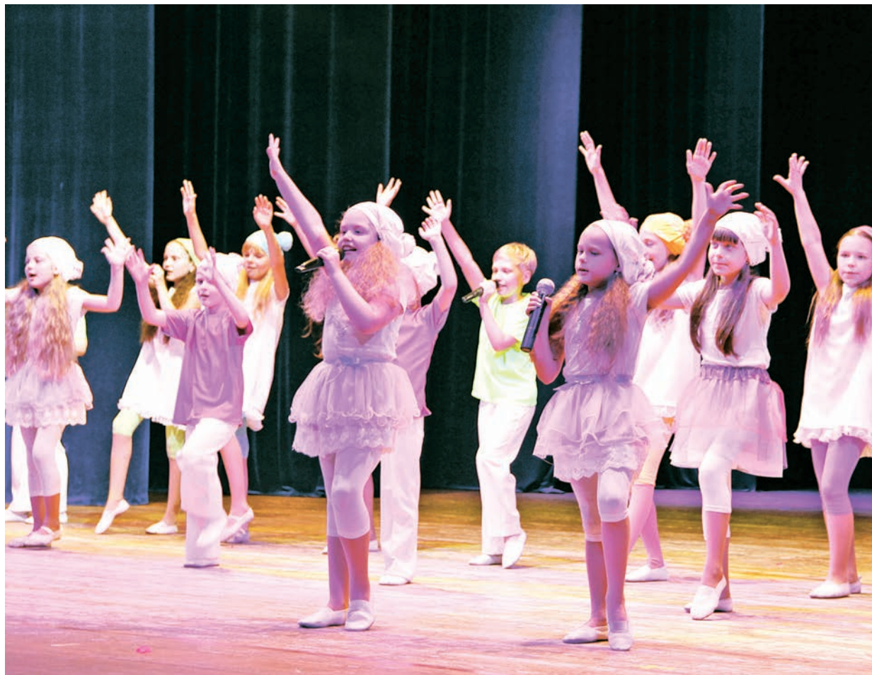
Зрелищное танцевально-хореографическое шоу с лучшими песнями о России - на главной сцене Железнодорожников