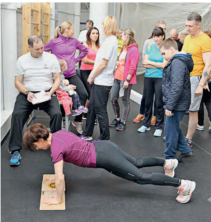
Отжимание: плечи, туловище и ноги должны быть на прямой линии.

Бегаю марафоны 30 лет. Зачем мне нормы ГТО? Чтобы дома не сидеть. Для пенсионера нормы облегченные. Чем старше, тем легче сдавать. Конечно, здесь сегодня самые спортивные люди города, и многие пенсионеры вполне могли бы сдавать по молодежным нормам.