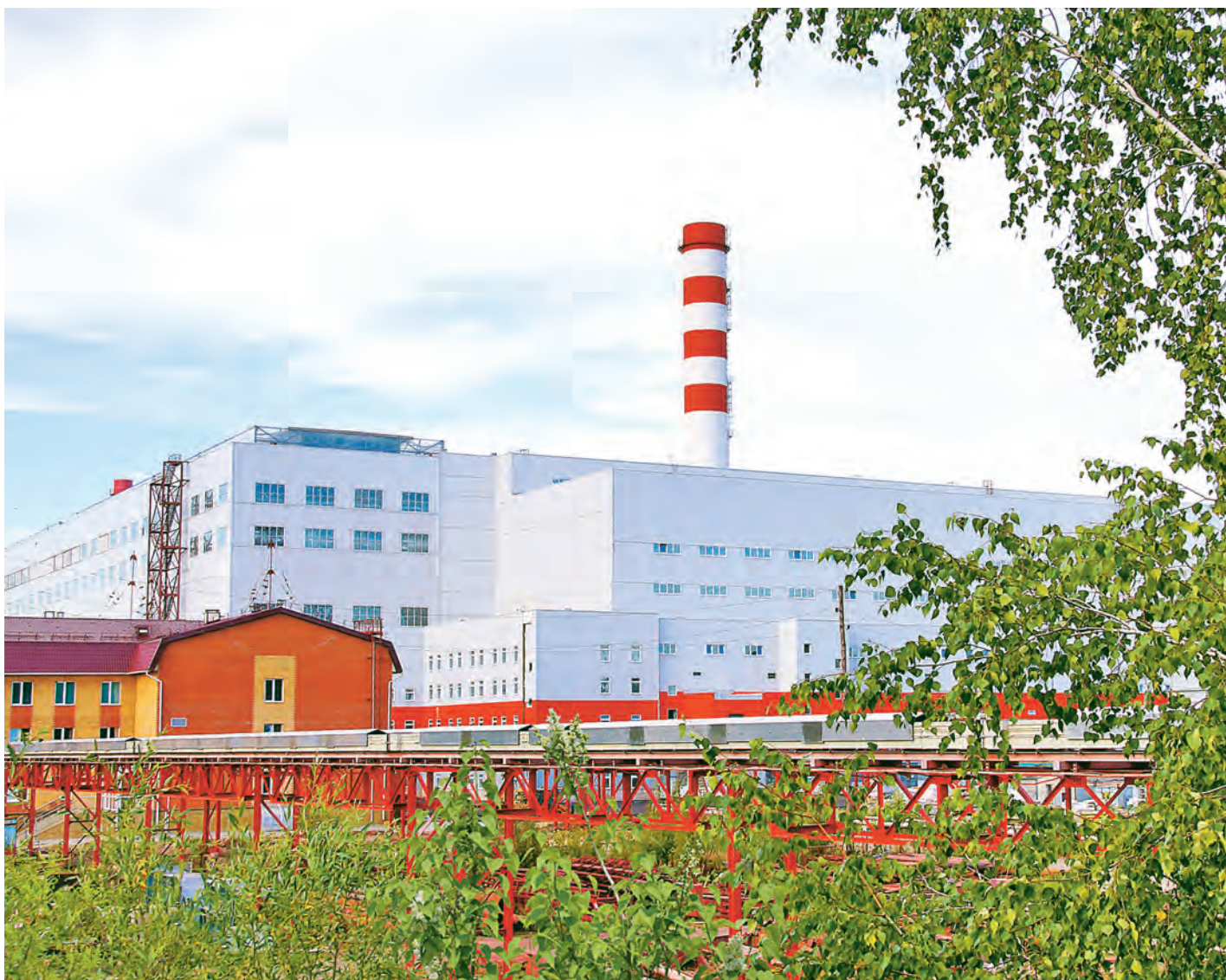
Современные технологии обжиговой машины № 3 обеспечивают минимальное воздействие на атмосферу.

Общественная организация «Зеленый патруль» составила «Экологический рейтинг субъектов РФ» и назвала регионы с лучшей и худшей экологической обстановкой в стране.