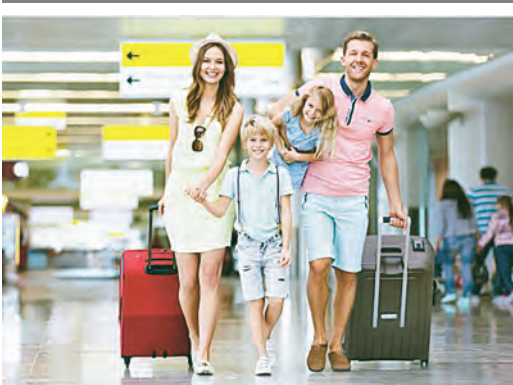
Курская область привлекает соотечественников.