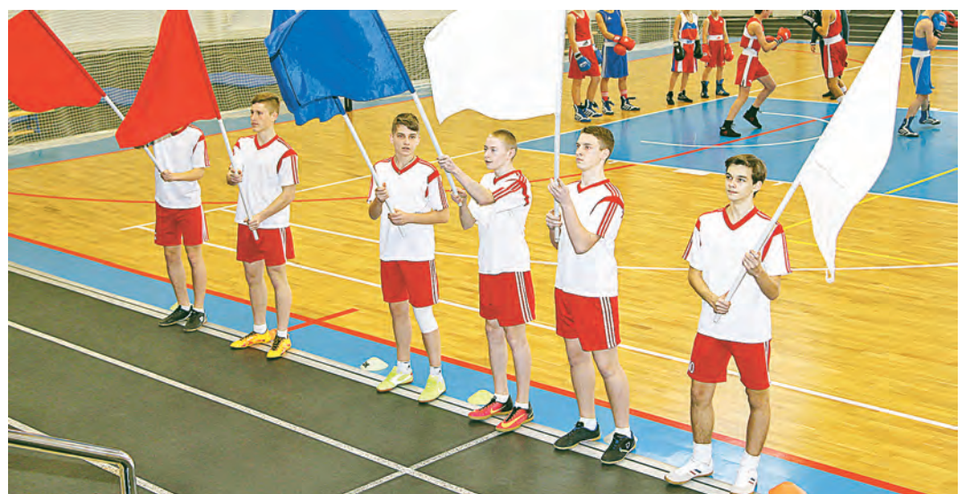
Фестиваль ГТО - праздник спорта и здорового образа жизни!