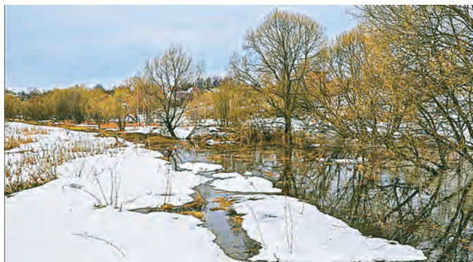
Курская область готова к весеннему половодью.

Цех хвостового хозяйства провел основательную подготовку к паводку, одновременно выполнив все организационно-технические мероприятия. Основной упор, естественно, делали на объекты и сооружения, задействованные в пропуске талых вод. Специально созданная паводковая комиссия заранее проверила готовность всех гидротехнических сооружений к весеннему половодью. Работников проинструктировали, провели тренировки непосредственно на производственных объектах. Для предотвращения и оперативного устранения аварийных ситуаций