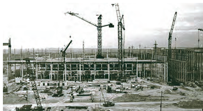
Уже скоро в построенном цехе начнется монтаж оборудования.