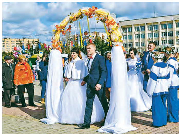
Работники ЗАГСа организуют праздники совместно с КЦ «АРТ».

городе умерло на шестьдесят человек меньше, чем в позапрошлом году. - Снизилось количество браков, - сообщили работники ЗАГСа. - Их зарегистрировали 606 - на 57 меньше, чем было ранее. Впрочем, в этом ничего необычного нет, ведь 2016 год был високосным. Наверное, из-за этого некоторые пары решили отложить свою свадьбу на потом. А вот количество разводов, к сожалению, выросло. Их оказалось более четырехсот. Однако, в ходе бесед с супругами, девятнадцать пар от развода удалось отговорить. Также с целью популяризации семейных отношений отделом ЗАГС в прошлом году проводилось множество самых разных мероприятий: круглые столы с представителями