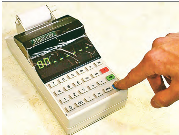
Подготовка к переходу на новые кассовые аппараты уже идет.