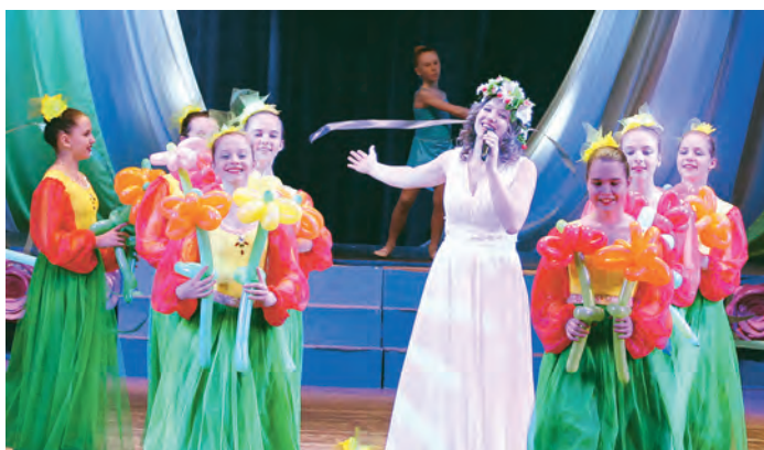
Артисты подарили женщинам букет из красивых концертных номеров

женщинам уважительное, отношение к семье традиционное, если женщина - носитель главных ценностей, тогда и общество будет здоровым, народ - достойным уважения. А еще Сергей Иванович вспомнил, что женщина - это предмет любви, восхищения и источник творчества, и не удержался от искусства и прочитал всем женщинам, сидящим в зале, стихи Валерия Брюсова, написанные поэтом конце 19 века и посвященные «Женщине». «Мы для тебя влечем ярем железный, тебе мы служим, тверди гор дробя, и молимся - от века - на тебя!» - процитировал поэта Сергей Иванович.