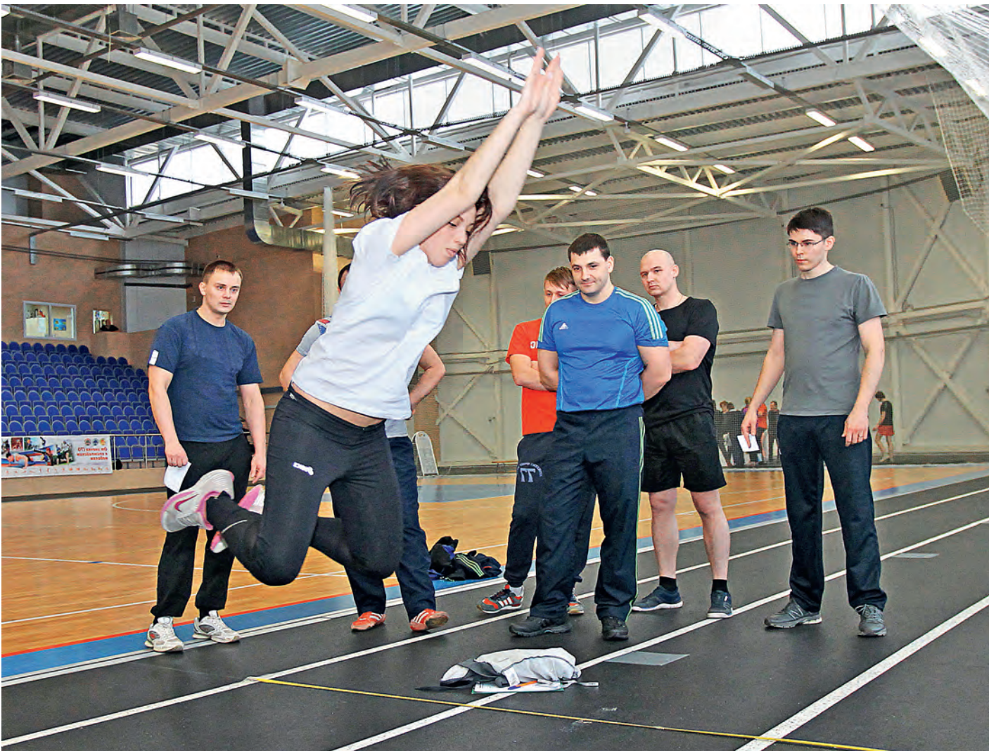
У каждого участника три попытки, в зачет пойдет лучший результат. А в случае чего - можно потренироваться и сдать еще разок-другой.

3 марта в «Старте» состоялся первый фестиваль ГТО. Впервые в Железногорске нормы Всероссийского физкультурно-спортивного комплекса «Готов к труду и обороне» сдавали взрослые.