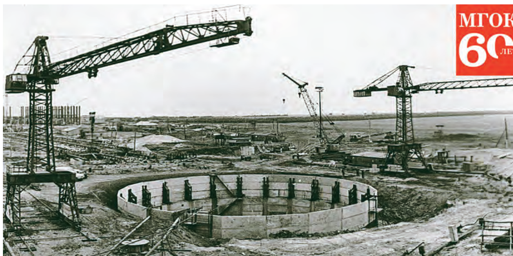
Строительство фабрики окомкования велось быстрыми темпами.