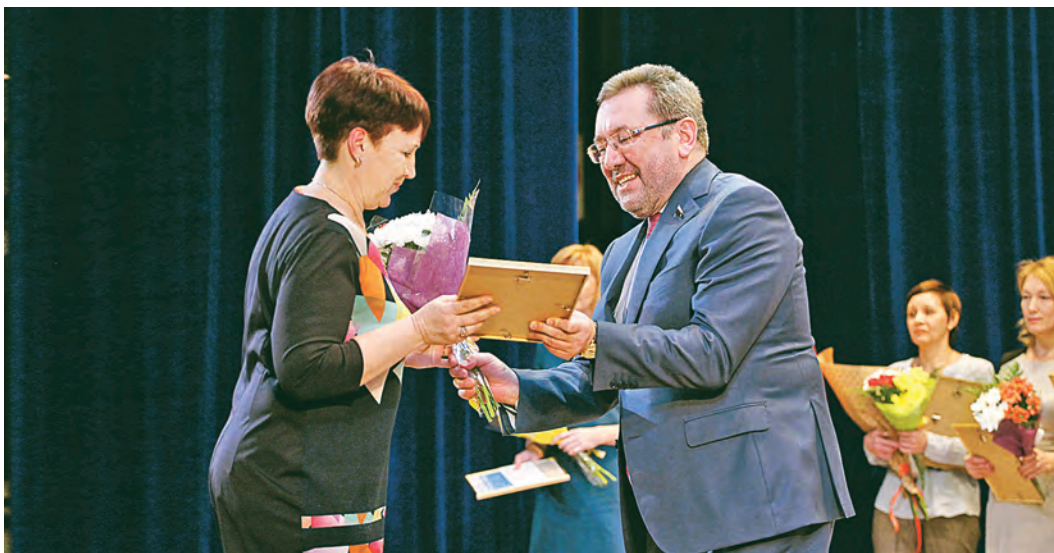
Четверть всех работников Михайловского ГОКа - женщины!