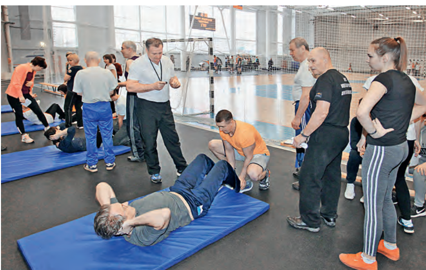
Судьи внимательно следят за правильностью выполнения упражнений.