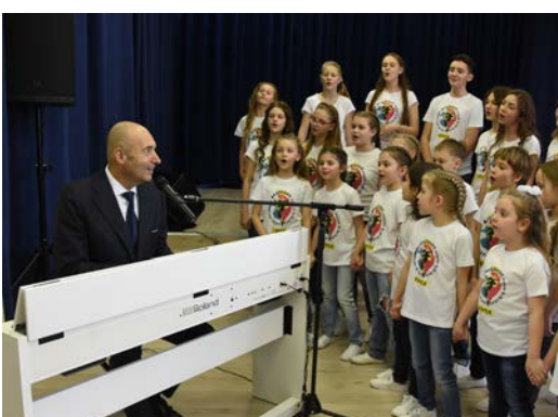
Юные таланты Курского края получили поддержку.