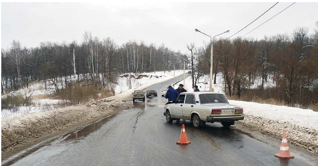
Недалеко от села Разветье «Лада» столкнулась с иномаркой.