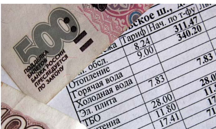
Новый закон позволит избежать накопления долгов перед РСО.