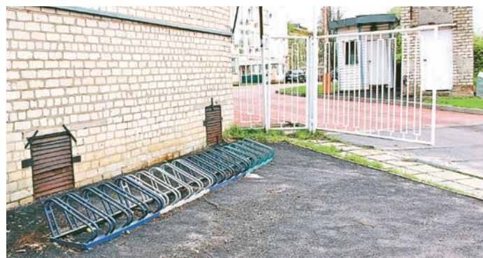
На велопарковке комбината всегда есть место для тех, кто предпочитает добираться до работы на велосипеде

Как показал опыт прошлых сезонов, велопарковка не особо востребована сотрудниками подразделений, расположенных поблизости. Также в социальном управлении нам пояснили, что из их коллектива никто не ездит на работу на велосипеде, да и посетители не обращали внимание на необходимость обустройства стоянки для двухколесных средств передвижения. Возможно, одной из при-