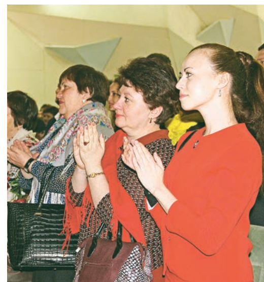
Зрители щедро отблагодарили артисток овациями...