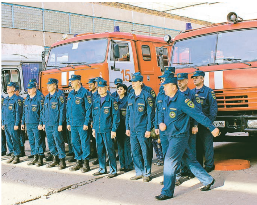
Сотрудники пожарной части всегда в полной боевой готовности

30 апреля профессиональный праздник работников пожарной охраны. Пожарная часть 15 охраняет объекты Михайловского ГОКа.