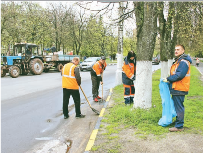
Сотрудники РУ навести порядок на большом участке улицы Ленина

Анна Дяченко