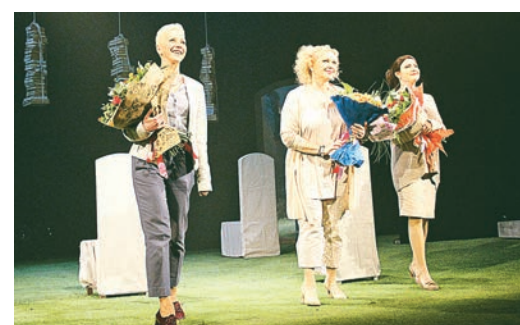
... и цветами