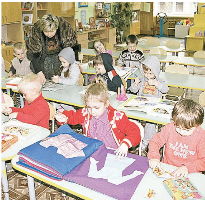
В детском саду № 12 все занятия проходят только в теплой одежде

Железнодорожные папы и мамы жалуются – с отключением отопления их дети замерзают в детских садах.