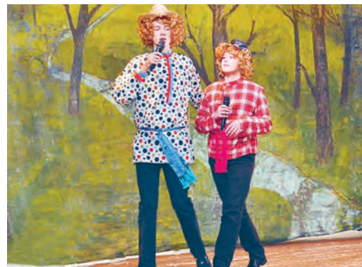
Веселые домовые - помощники юных артистов