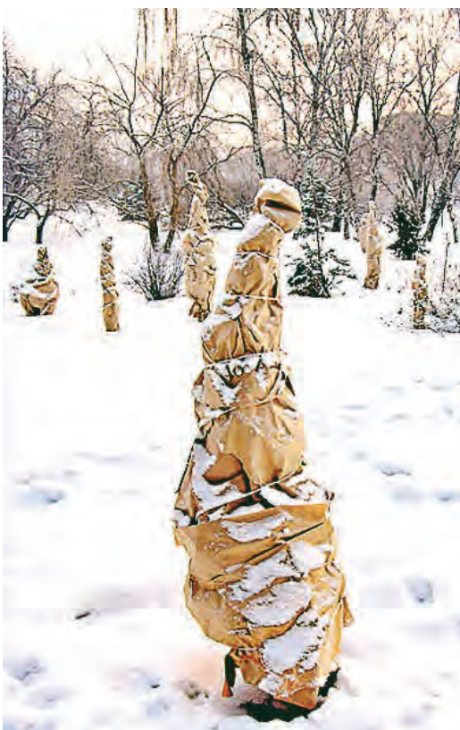
Молодые хвойники на зиму надо правильно укрыть

Рододендроны не всегда устойчиво переносят зиму. Для благоприятной зимовки корневую систему этих растений необходимо в ноябре укрыть торфом, листом, хвойным лапником на высоту 10-15 см. При этом вечнозеленые рододендроны для