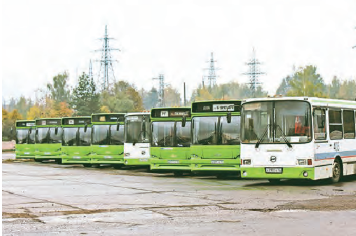
Современные комфортабельные автобусы - залог быстрой, своевременной и удобной доставки рабочих на промплощадки МГОКа

- Накануне Дня автомобилиста мы всегда подводим итоги работы нашего подразделения - за девять месяцев план по выпуску автомобилей на линию перевыполнен на 103% и мне очень приятно, что коллектив УГП встречает свой профессиональный праздник с хорошими производственными результатами, - отметил Константин Ширяев, начальник УГП. - В этом году немного