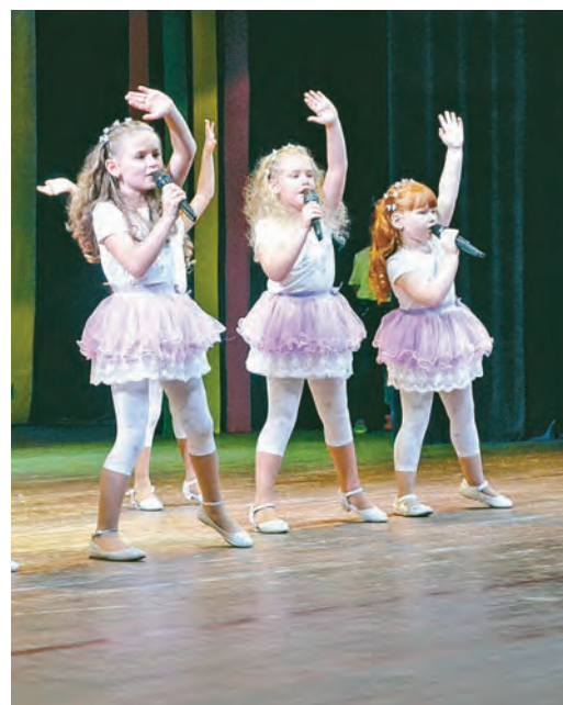
Маленькие солистки театра песни «Модемуз»