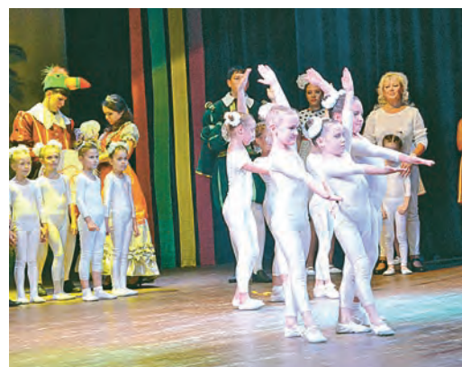
Этюд акробатов цирковой студии «Арлекино»