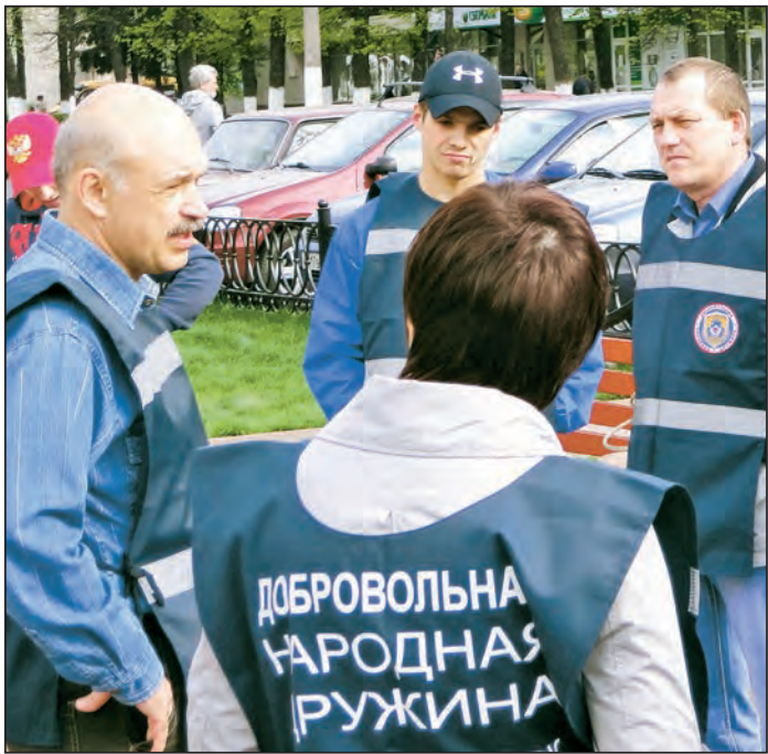
Сотрудники ДНД - надежные помощники Железнодорожской полиции

Ни одно даже самое стабильное государство не может решить проблемы обеспечения общественного порядка без опоры власти на сознательные слои населения.