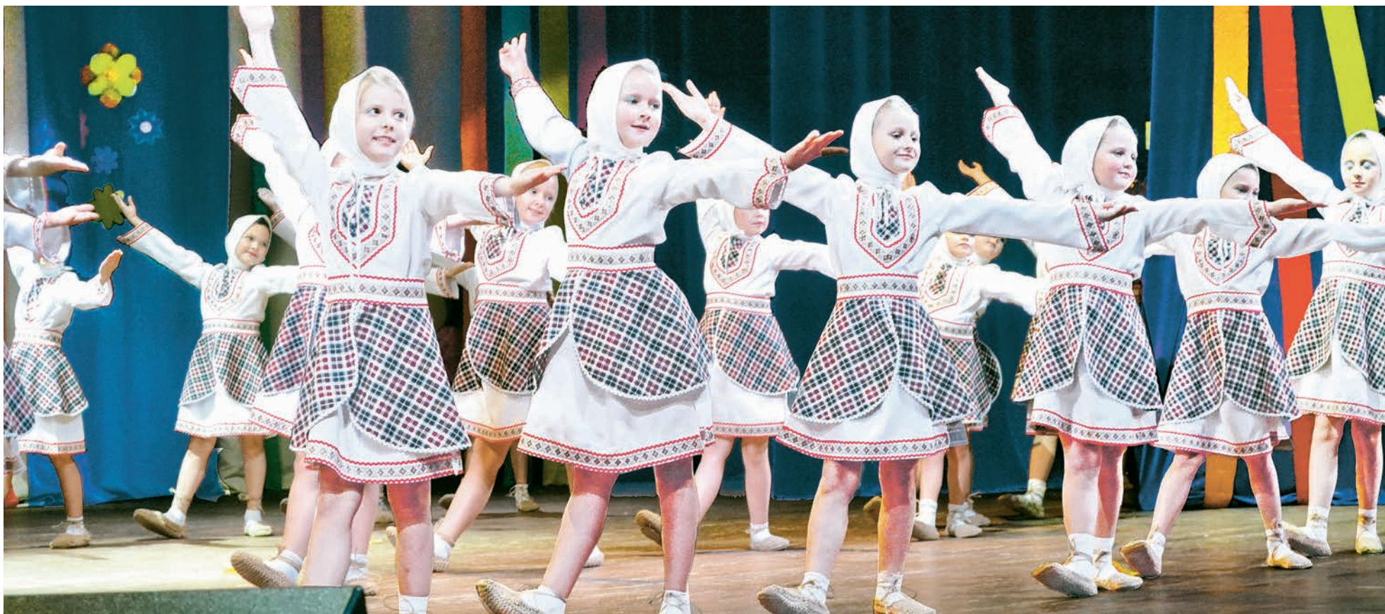
Народные танцы всегда вызывают восторг зрительного зала