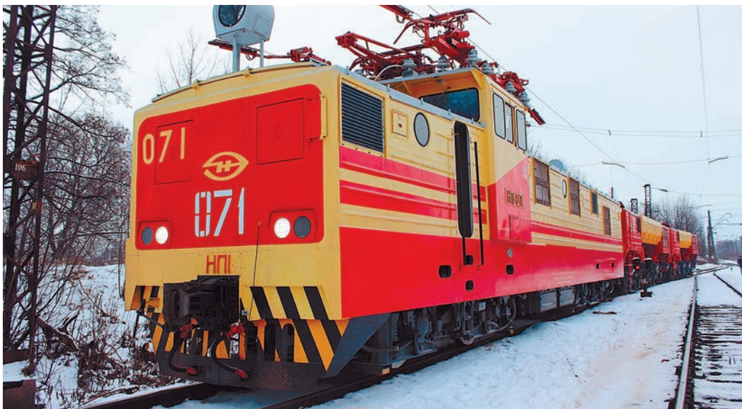
Сейчас тяговый агрегат проходит пуско-наладку и пробную обкатку в УЖДТ

В начале нового производственного года в УЖДТ поступил новый тяговый агрегат из Новочеркасска.