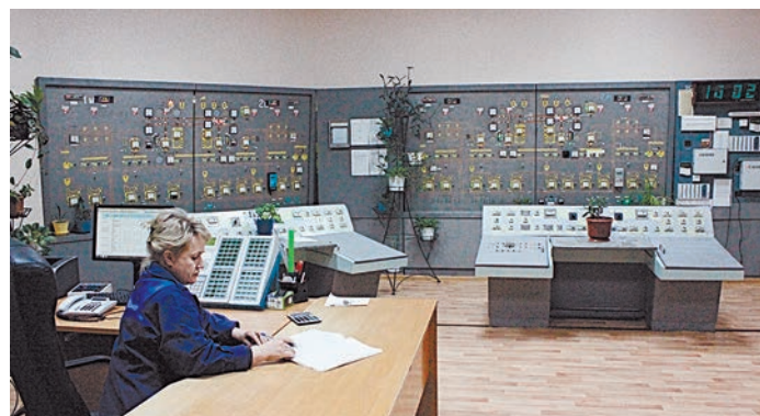
На ДОК проведен большой ремонт в центральной операторской и многих других кабинетах

— Кабинеты теперь светлые, чистые, в них легко