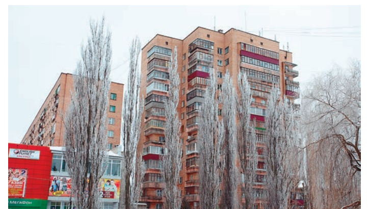
Льготники могут получить компенсацию расходов по оплате взноса на капитальный ремонт

Если гражданин занимает жилое помещение, общая площадь которого меньше социальной нормы площади жилья, размер компенсационной выплаты определяется исходя из фактической площади жилого помещения.