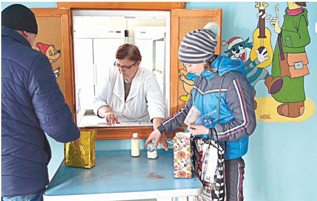
Молочная кухня получит вторую жизнь

– Совсем скоро горожане смогут получить ее продукцию не только в помещении молочной кухни, но и во всех