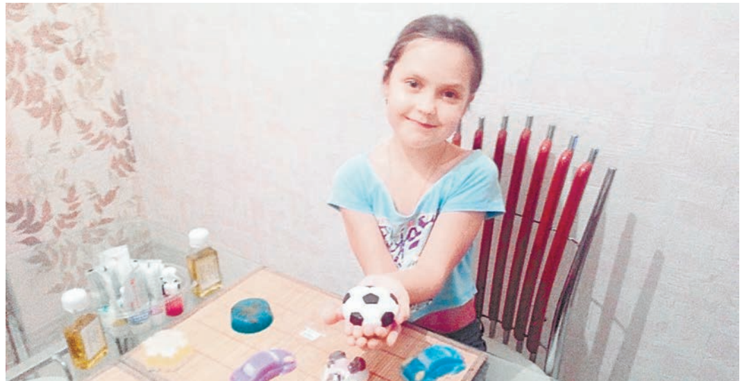
Делать мыло своими руками особенно понравилось детям

- Это очень кропотливая работа, но за ней полноценно