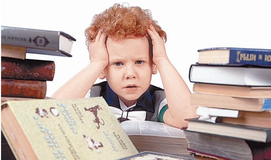
На маленького человека сваливаются совсем не маленькие проблемы

Детоцентризм давно уже стал реальностью современного общества. Наблюдается интенсивное соучастие родителей во взрослении ребенка. Итог: